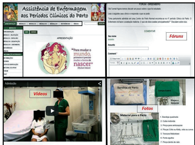
Figura 2 – Ilustrativo de mídias presentes na hipermídia, Fortaleza, Ceará, Brasil, 2019

Módulo IV: 4º Período Clínico do Parto, Greenberg foi dividido em dois tópicos: Tópico 01: Contextualização e Principais Conceitos do 4º Período Clínico do Parto: Greenberg e Tópico 02: Assistência de Enfermagem ao 4º Período Clínico do Parto.