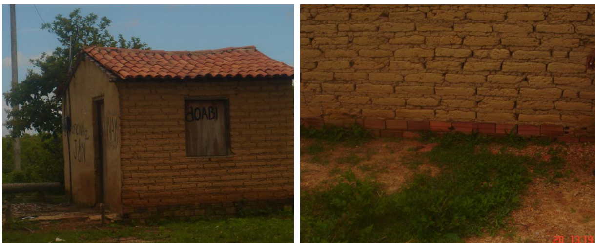
Figura 03 – Utilização de tijolos furados como baldrame das paredes de adobe.

O custo dos tijolos cerâmicos, bem como a dificuldade logística de seu fornecimento nos vários distritos de Coreaú, não pareceu como único motivo da grande proliferação de construções em adobe na região. O material também chamado de adubu ou tijolo mole está fortemente ligadas a cultura local, que mesmo em períodos eleitorais, na pratica de distribuição de tijolos furados entre a comunidade, esses então foram sutilmente adaptados as construções em adobe, sendo utilizados na base de construção de suas casas, substituindo-se a pedra.