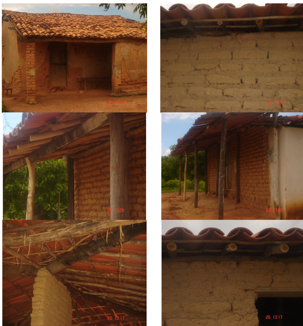
Figura 04 – Detalhes construtivos das construções em adobe.

As construções atuais, que foram mapeadas para mais de duas dezenas de novas casas sendo construídas, apresentam configurações arquitetônicas bastante semelhantes, como o telhado em duas, ou quatro águas, sala, quarto, cozinha e banheiro, pequenos pilares em adobe algumas vezes também sustentam a cobertura da casa avarandada, típica do sertão semi-árido, e como detalhes construtivos, percebe-se também, a não utilização de madeiras beneficiadas, essas sendo substituídas nas edificações antigas, pela carnaúba, e nas edificações recentes, pelas chamadas madeiras caatingueiras, que reduzem drasticamente o custo de mão de obra e de madeiramento das cobertas.