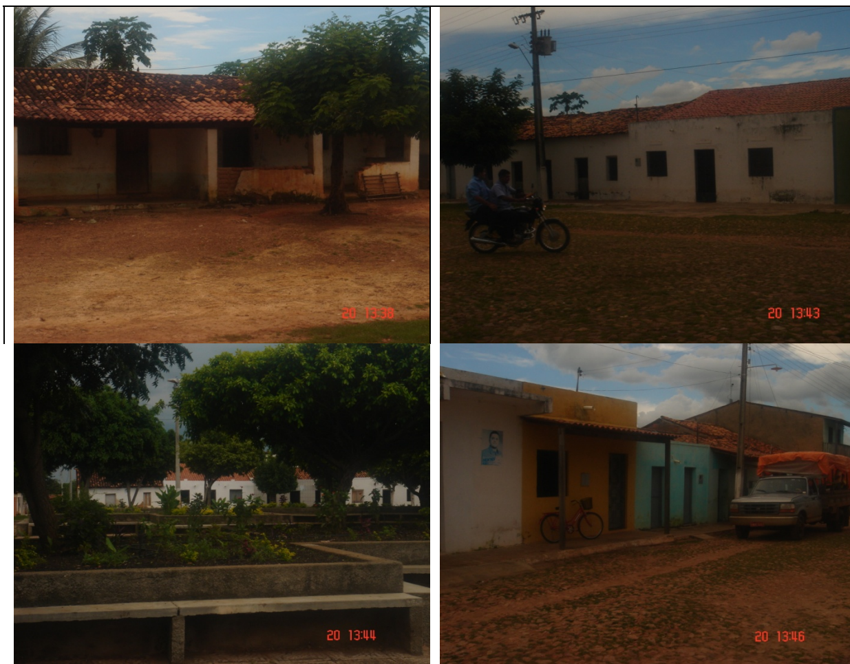
Figura 02 – Construções em adobe em Coreaú.

O custo dos tijolos cerâmicos, bem como a dificuldade logística de seu fornecimento nos vários distritos de Coreaú, não pareceu como único motivo da grande proliferação de construções em adobe na região. O material também chamado de adubu ou tijolo mole está fortemente ligadas a cultura local, que mesmo em períodos eleitorais, na pratica de distribuição de tijolos furados entre a comunidade, esses então foram sutilmente adaptados as construções em adobe, sendo utilizados na base de construção de suas casas, substituindo-se a pedra.