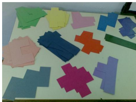
Figura 3. Pentaminós confeccionados com cartolina

A turma formou grupos de quatro alunos, cada grupo recebeu um jogo de pentaminós, confeccionados de cartolina e papel adesivo, sendo cada jogo, constituído por doze pentaminós (ver figura 3).