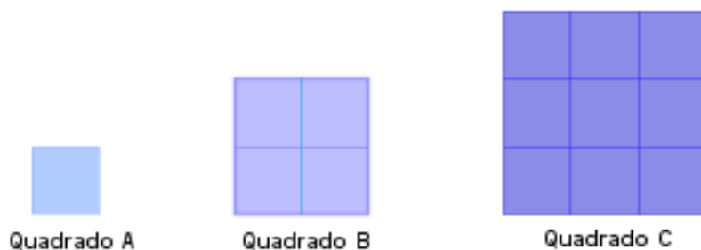
Figura 11. Quadrados desenhados pelo professor.

Após apresentado e validado o novo conhecimento, prosseguimos fazendo uma avaliação oral (Souza, 2013 p. 35), através de um exercício (ver Tabela 1). O professor desenhou três quadrados no quadro (ver figura 11).