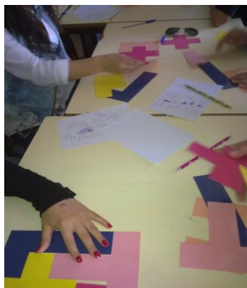
Figura 5. Alunos vivenciando a busca de uma estratégia.

Após construírem a figura (solução do problema-ver Figura 6), estavam prontos para observar e relacionar o perímetro e a área das figuras. Os alunos organizaram e apresentaram modelos que pudessem conduzi-los a encontrar o que estava sendo solicitado: pegaram caneta, lápis e papel. Determinaram o perímetro e a área das figuras. Alguns alunos usaram uma tabela para organizar os dados obtidos e analisá-los. Estavam a dar início a mais uma etapa da Sequência Fedathi, a Solução . Nessa etapa, aconteceu as trocas de ideias, opiniões e discussões dos pontos de vista e modelos propostos pelos alunos. O professor estimulou e solicitou que os estudantes explicassem seus modelos e justificassem as conclusões atingidas.