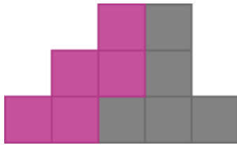
Figura 4. Atividade 2.

Caracterizamos assim, a Tomada de Posição , a primeira etapa da Sequência Fedathi. Dos grupos formados, apenas dois conseguiram construir os doze pentaminós. Partilhamos os doze pentaminós e fizemos uma relação com as letras do alfabeto (ver figura 2). Ao vivenciarmos essa etapa, verificamos que todos os alunos estão com o mesmo nível de conhecimento, facilitando a aquisição do novo saber matemático: Figuras Semelhantes. Os alunos estão prontos para vivenciar a Maturação e a Solução , duas etapas muito importantes durante o processo de ensino na metodologia Sequência Fedathi. Essas etapas caracterizam a diferença entre a Sequência Fedathi e o Ensino Tradicional que se centraliza apenas em duas etapas, a Tomada de Posição e a Prova (Souza, 2013 p.36). No Ensino Tradicional o professor, apresenta o problema e valida a sua solução, sendo o aluno um mero receptor do conhecimento. Enquanto que ao utilizarmos a Sequência Fedathi durante o processo de construção de conceitos o aluno torna-se o protagonista, participando ativamente na busca do novo saber (Souza, 2013 p. 37).