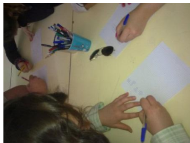
Figura 1. Descobrimo os pentaminós.

Material utilizado: Folha quadriculada A4, lápis e borracha. A turma foi dividida em grupos de quatro alunos (ver figura 1).