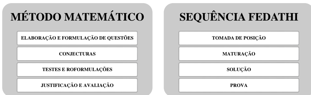
Figura 01 – Método de Trabalho do Matemático x Sequência Fedathi.

Pode-se perceber na Figura 01 que tanto no método de trabalho do matemático como no método Fedathi, ações como formular questões, conjecturar, realizar provas e refutações e argumentar ocorrem independente de seu sujeito da ação ser o matemático ou o aluno (BORGES NETO, 2016; PONTE; BROCARDI; OLIVEIRA, 2003).