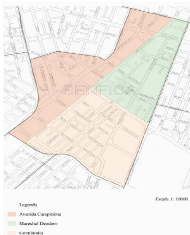
MAPA DO BAIRRO BENFICA. FONTE: PEREIRA (2008)

Guarda ainda a peculiaridade de ter um bairro dentro de um bairro. O bairro Gentilândia, criado oficialmente em 24 de julho de 2000, segundo o Diário Oficial do Município de Fortaleza, é considerado um dos menores bairros da Cidade e ocupa uma parte do espaço do Benfica (conforme pode ser visto no mapa 01), correspondendo ao quadrilátero entre as Avenidas da Universidade, Treze de Maio,