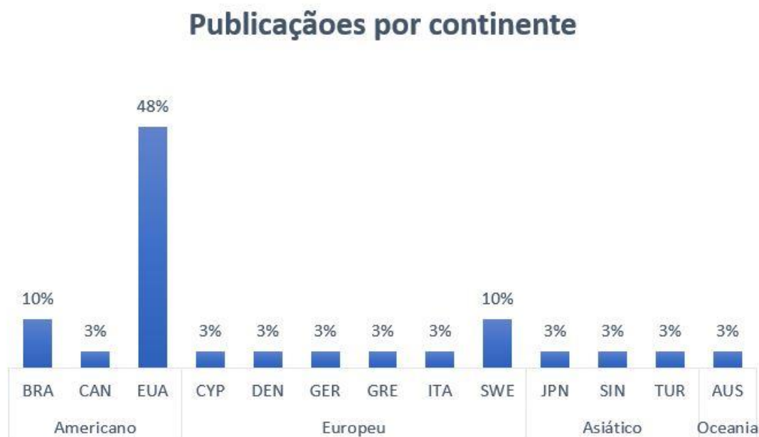
Figura 3 - Distribuição dos estudos selecionados por país.