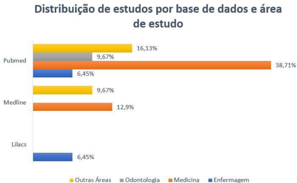
Figura 2: Distribuição dos estudos selecionados por base de dados e área de estudo.