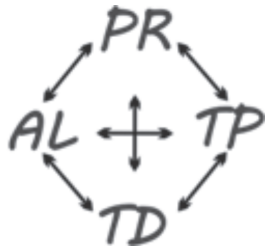
Figura 1: Esquema Jerárquico 1