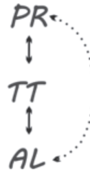
Figura 2: Esquema Jerárquico 2