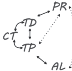
Figura 5: Esquema Jerárquico 5 (Flechas: con cuerpo sólido – interacción efectiva; con cuerpo con puntillos – interacción posible).

Sobre los lugares, cómo y cuándo ocurren las interacciones, dibujamos el cuadro siguiente, hecho a partir de los testimonios de todos los participantes: