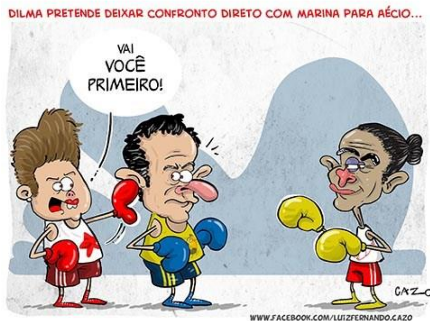
Figura 2: Charge 2