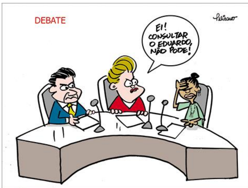
Figura 1: Charge 1