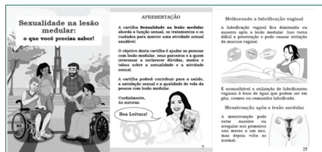
Figura 1. Ilustração representativa da capa, conteúdo e diagramação da cartilha “Sexualidade na lesão medular: o que você precisa saber”

Ao finalizar o processo de construção, a cartilha foi impressa em frente e verso, com tinta colorida, em papel ofício tamanho A4, com orientação de página no formato paisagem e manuseio tipo livreto, com dimensões de 148 x 210 mm, num total de 44 páginas (partes externas e internas) e encadernada no formato tipo brochura grampeada. A figura 1 apresenta a capa, apresentação e conteúdo da cartilha.