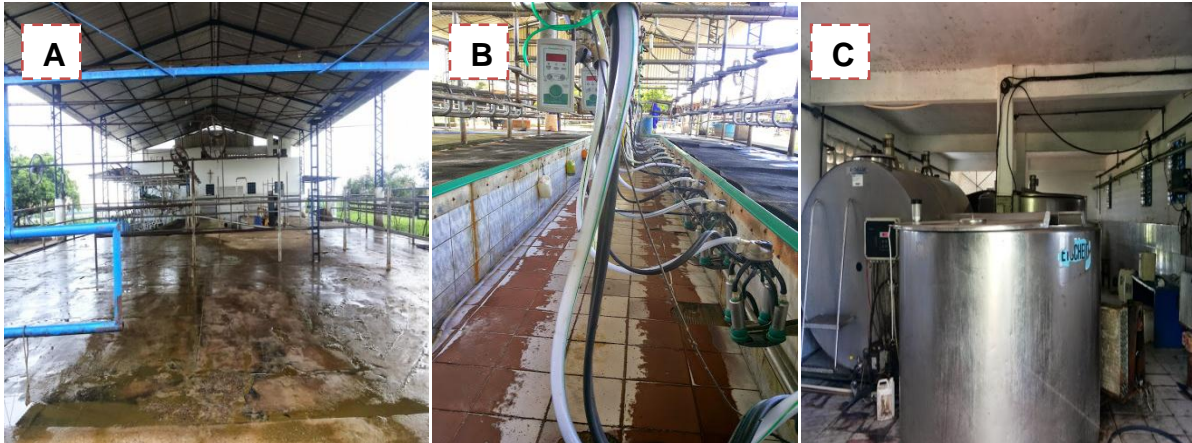
Figura 12 - (A) sala de espera; (B) sala de ordenha; (C) sala do leite;

formol ou água e sulfato de cobre, para evitar problemas de casco nas vacas, principalmente em períodos chuvosos.