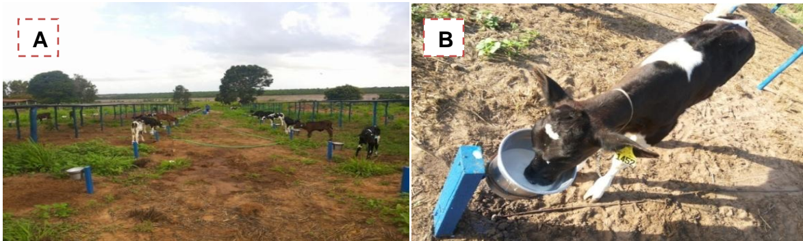
Figura 4 - (A) bezerreiro Argentino; (B) bebedouros de alumínio;