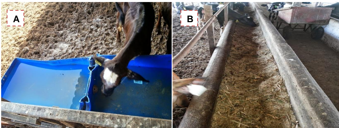
Figura 5 - (A) bebedouros das baias coletivas; (B) comedouros das baias coletivas;

Os bebedouros das baias coletivas (Figura 5A) são de material reciclável de plástico e a vazão da água é medida através de uma bóia. Os comedouros nas baias coletivas das fêmeas e dos machos são de alvenaria (Figura 5B) para a facilitação do manejo.