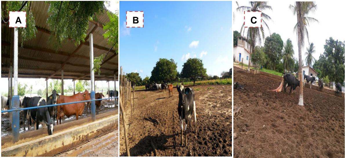
Figura 10 - (A) lote para secagem; (B) piquete de vacas secas; (C) piquete de pré parto;