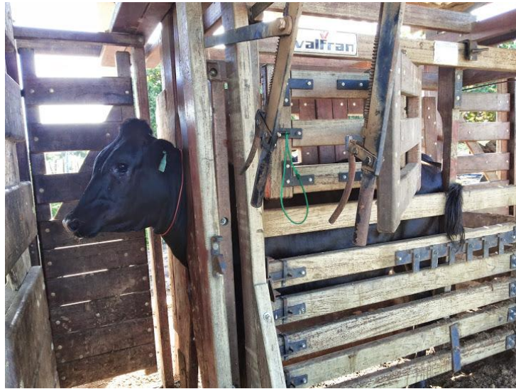
Figura 9 - Tronco para manejo de novilhas;