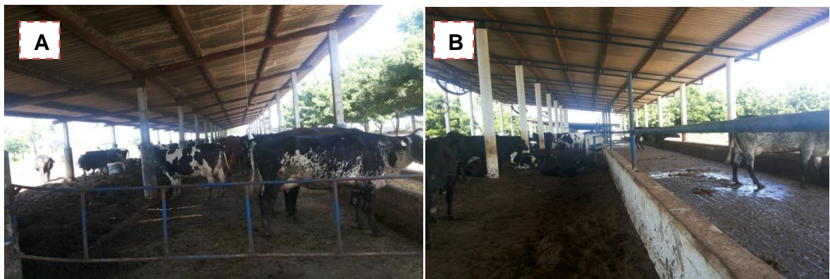
Figura 11 - (A) galpão Loose Housing; (B) galpão Compost Barn;

lotes de acordo com a produção de leite, sendo que cada lote possuía uma dieta diferente em quantidade, além de serem identificadas através de colares coloridos. Assim a divisão dos lotes era pós parto, novilhas 1, 2, 3, vacas 1 e 2, compostos 1, 2, 3; Os lotes do composto era os que produziam a maior quantidade de leite, seguido de novilhas 1 ,2 ,3 e depois vacas 1 e 2. A utilização de colares coloridos (Tabela 7) era para identificação de lotes facilitando o manejo.