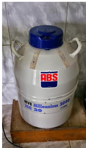
Figura 7 – Botijão de armazenamento de sêmen;

A inseminação com sêmen sexado era realizada apenas nas duas primeiras vezes que a novilha é inseminada, na terceira já era utilizado o sêmen convencional. O sêmen era armazenado em nitrogênio líquido (Figura 7) e descongelado no momento da inseminação em água á 35°C, em seguida ocorria à preparação do aplicador de sêmen, inseminação e por fim a aplicação de GnRH sintético.