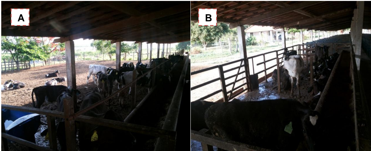
Figura 3 - (A) baia das fêmeas; (B) baias dos machos;

Os machos eram alocados para baias coletivas (Figura 3B) com cerca de dezesseis animais cada uma, também e recebiam a mesma alimentação das fêmeas.