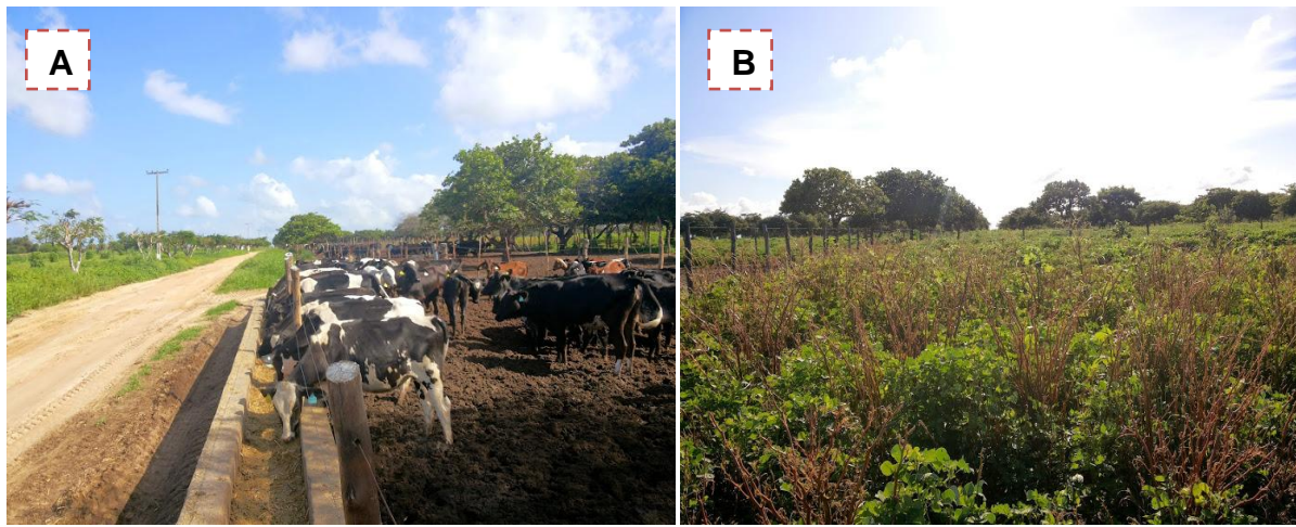
Figura 8 - (A) curral provido de cocho para alimentação e bebedouro; (B) área de pastagem;