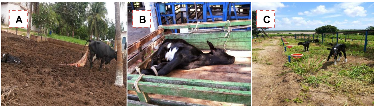
Figura 1 - (A) permanência de crias recém nascidas com a mãe; (B) transporte de crias recém nascidas; (C) instalação das crias recém nascidas.

2B) e brincos coloridos. As fêmeas recebiam brincos de cor amarela na orelha direita e os machos brincos de cor azul (Figura 2C), no brinco possuía o número do animal no rebanho, número da mãe e nome do pai. Aos três meses as bezerras recebiam uma nova identificação com brincos coloridos na orelha esquerda, com o objetivo de indicar a produção de leite materna. A cor azul indicava produção de 20 á 29 litros, branca de 30 á 39 litros, amarela de 40 á 49 litros e verde para 50 ou mais litros de leite. As pesagens seguiam com uma frequência mensal visando acompanhar o desenvolvimento dos animais. Já a descorna era realizada quando os botões córneos estivessem aparentes e quando houvesse uma quantidade relevante de animais, a fim de facilitar o manejo e não causar estresse prolongado nos mesmos. Em conjunto com essa prática, prosseguia a retirada de possíveis tetos extranumerários das fêmeas (utilização de tesoura e iodo a 10%).