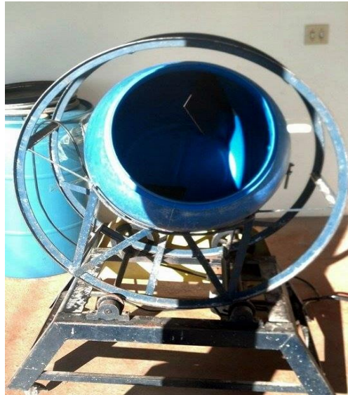
Figura 17 – Misturador utilizado para adicionar o palatabilizante na ração