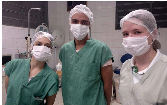
Figura 9 – Equipe que acompanhou o parto de uma das cadelas do laboratório

Todos os gatos do laboratório são castrados, sendo assim, a renovação da plantel ocorre com a aquisição de novos animais, geralmente filhotes.