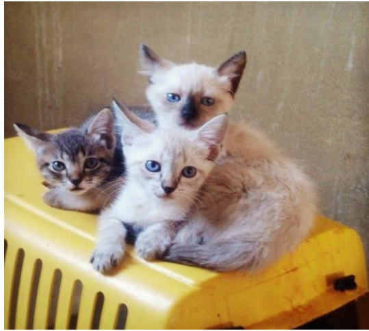
Figura 11 – Novos filhotes de gatos, adquiridos para o laboratório