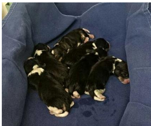
Figura 10 – Filhotes de cães após o parto