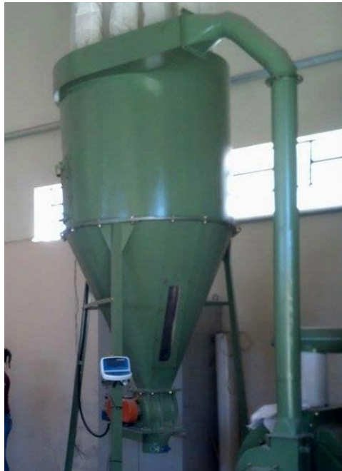
Figura 20 – Silo

A moagem é uma etapa fundamental, pois a granulometria irá influenciar na aparência e digestibilidade. Segundo Pencovic e Morris, (1975), grãos grosseiramente moídos têm baixa digestibilidade (no caso do milho, o amido resistente além de não ser digerido, também é responsável por transtornos intestinais) devendo-se atentar ao diâmetro das telas de moagem. No processo de moagem, ocorre aumento da temperatura dos grãos, que puxam umidade, o que possibilita maior aparecimento de fungos, por isso, não é recomendável armazenar grãos moídos.