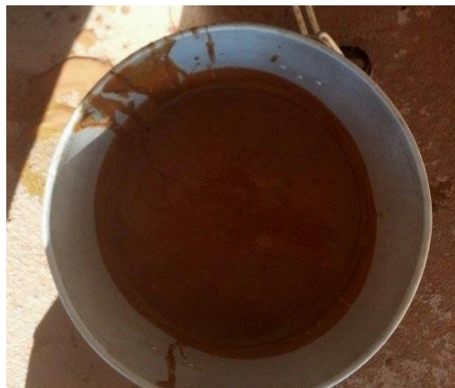
Figura 18 – Palatabilizante, com inclusão do extrato de canela