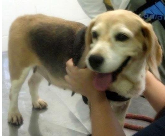
Figura 3 – Cão da raça beagle, pertencente ao Laboratório.

O laboratório contém 50 cães da raça beagle, 4 cães sem raça definida (SRD) e 39 gatos SRD no canil e gatil, respectivamente.