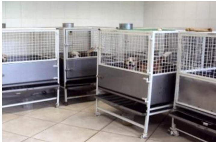
Figura 13 – Sala de digestibilidade para cães