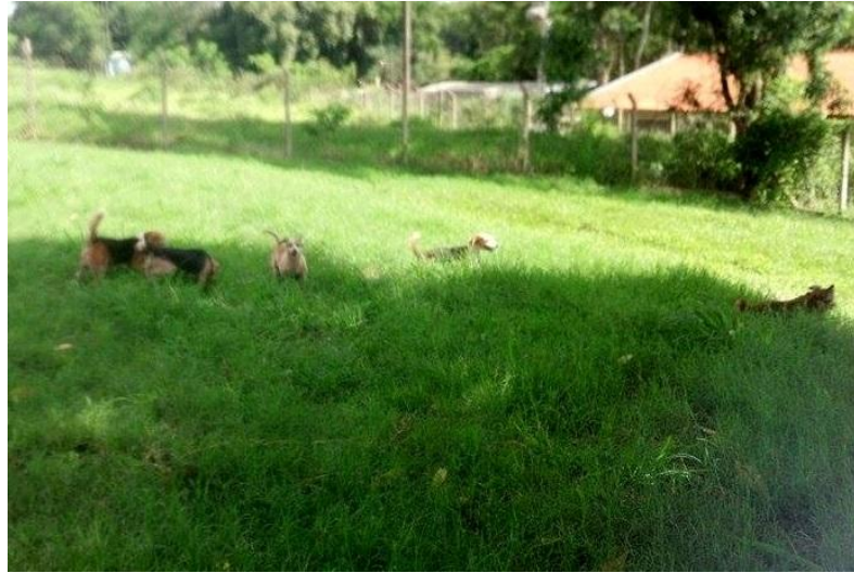
Figura 14 – Cães na área de socialização