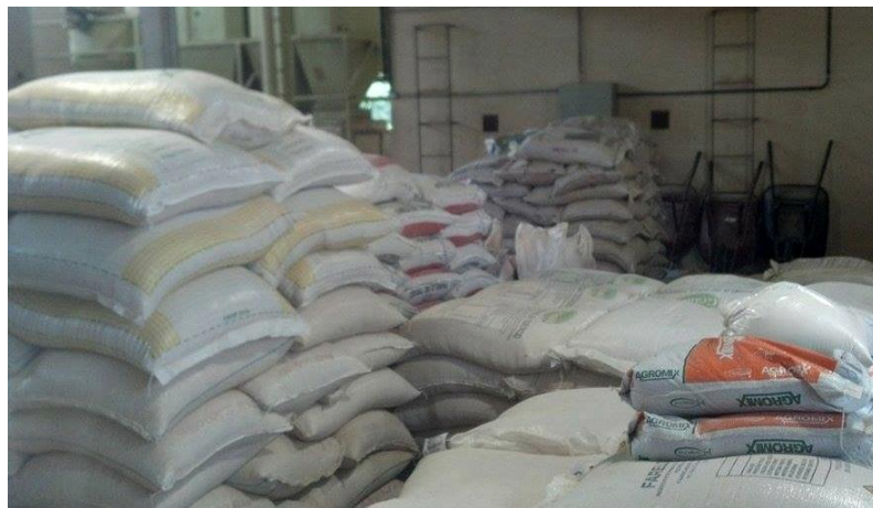
Figura 19 – Ingredientes armazenados