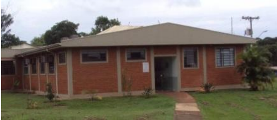
Figura 1 – Laboratório de Pesquisa em Nutrição e Doenças Nutricionais de Cães e Gatos