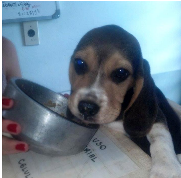
Figura 7 – Filhote de cão sendo alimentado