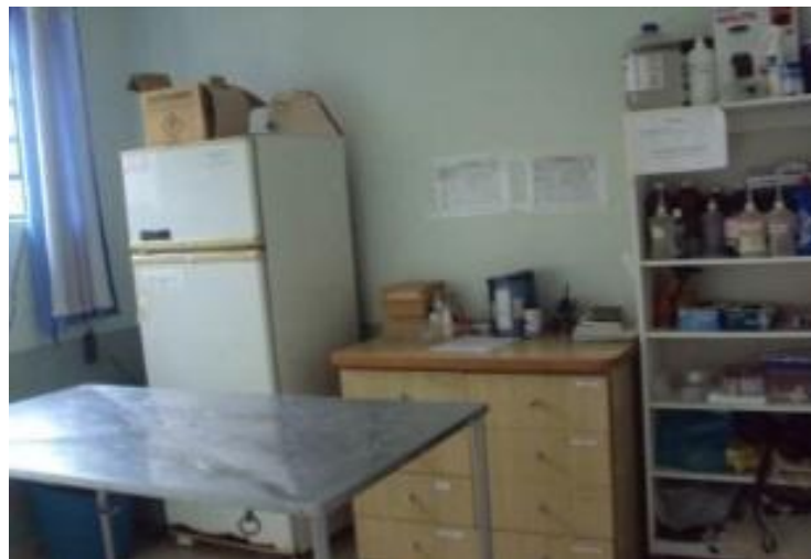
Figura 8 - Ambulatório, onde são armazenados os medicamentos

Alguns animais precisam receber medicação diariamente, pela manhã, tarde, ou nos dois horários. Cada animal possui um pequeno depósito, que contém o seu nome, onde será colocado a sua medicação, todos os dias, para que não haja troca de remédio e para facilitar o manejo.