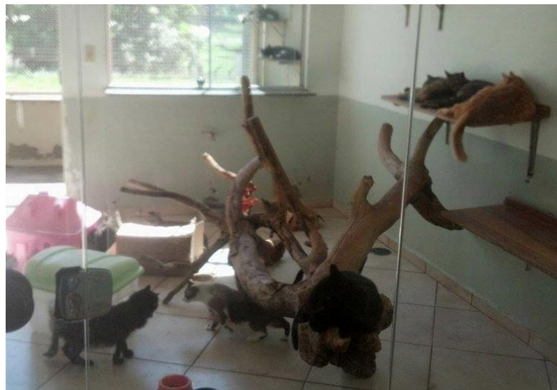
Figura 15 – Gatil com enriquecimento ambiental