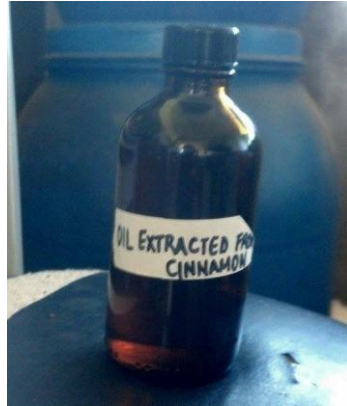
Figura 16 – Extrato de Canela