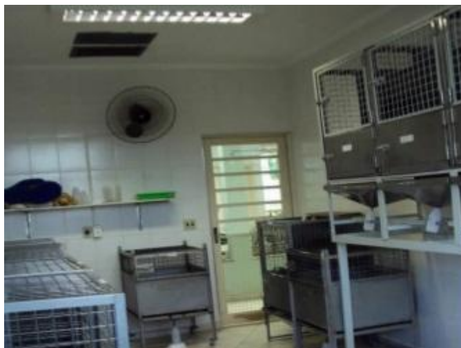
Figura 12 – Sala de digestibilidade para gatos

Os protocolos de ensaios de digestibilidade seguem as orientações da AAFCO (2004), mas as necessidades energéticas dos animais seguem as recomendações do NRC (2006). O método utilizado no laboratório é o da coleta quantitativa ou coleta total.