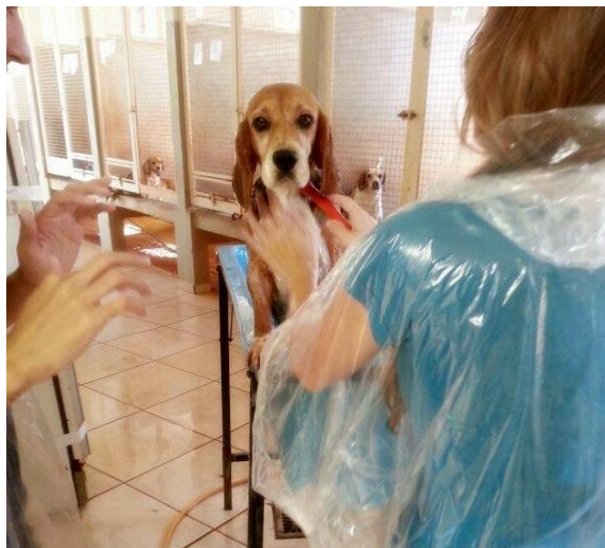
Figura 6 – Banho mensal dos cães