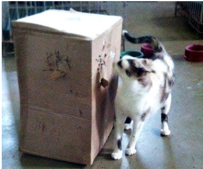
Figura 4 – Gato SRD, pertencente ao Laboratório.