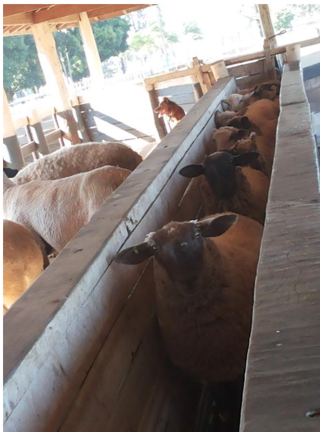
Figura 6 - Ovelhas no brete