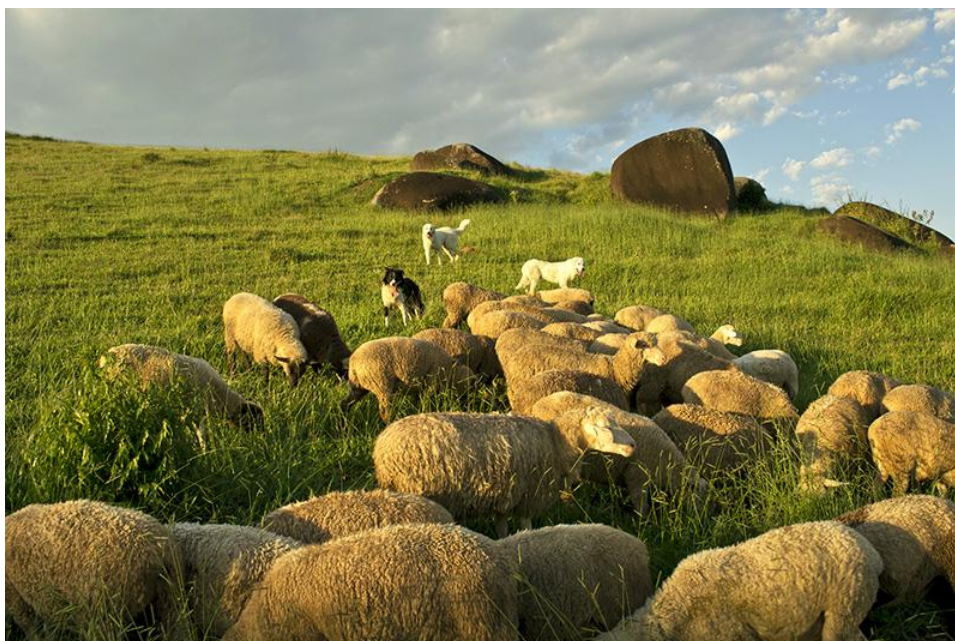
Figura 16– Cães Maremano Abruzes e Border Collie