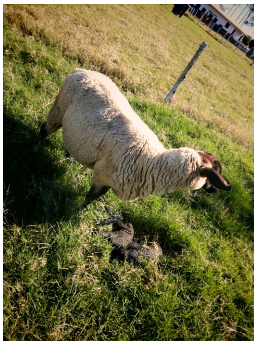
Figura 11 - Ovelha Suffolk com suas crias