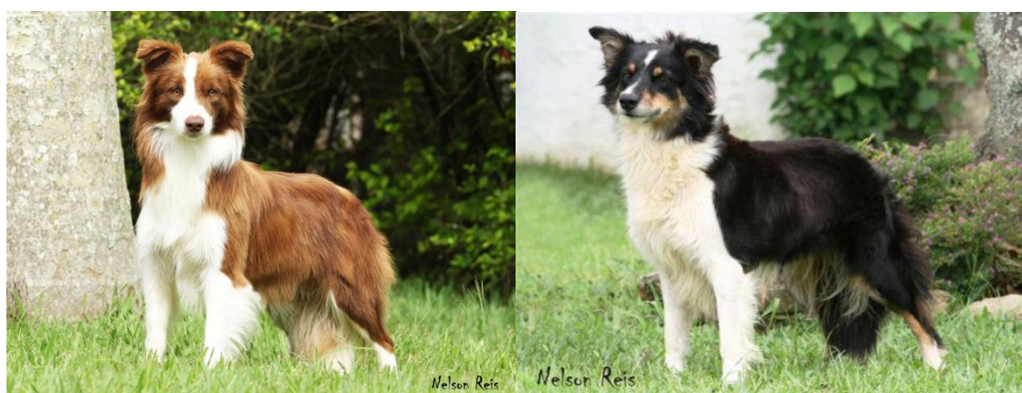
Figura 3: Cães da raça Border Collie

Como sempre foi priorizado o pastoreio como objetivo para a criação desses animais, não há um padrão rígido para a raça no tocante às suas características físicas, sendo aceitas várias pelagens como padrão da raça. O padrão estabelecido em 1906 baseava-se em habilidades para o trabalho e foi esta a referência para a raça desde então. Os cães eram chamados de Sheepdogs – pastores de ovelhas – e apenas em 1915 foi registrado o nome Border Collie. Logo que chegou na Américas, a raça encantou os criadores com seu trabalho ágil e sua capacidade de obediência e em 1995 o American Kennel Club – um dos maiores clubes de registro de genealogias de cachorro de sangue puro nos Estados Unidos – reconheceu a raça e a mesma entrou para o círculo das exposições.