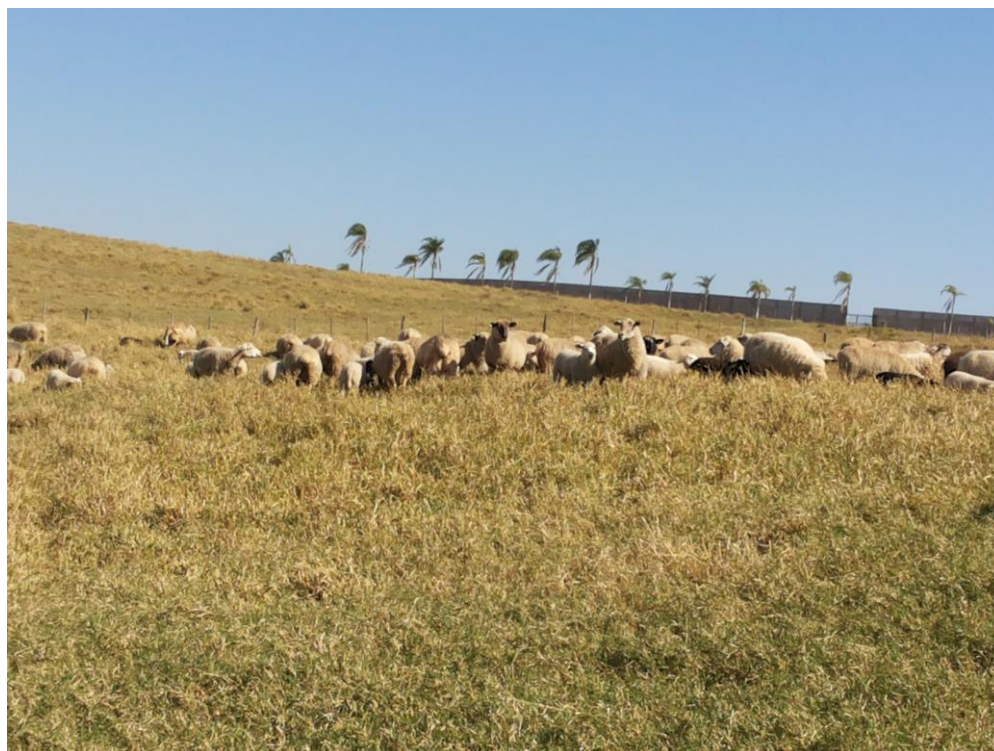
Figura 5 - Matrizes e cordeiros a pasto