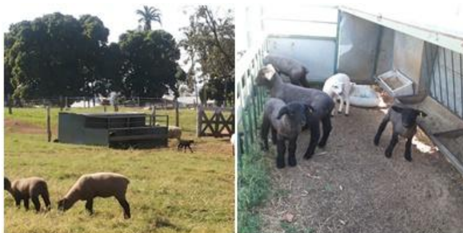
Figura 12 - Creep feeding