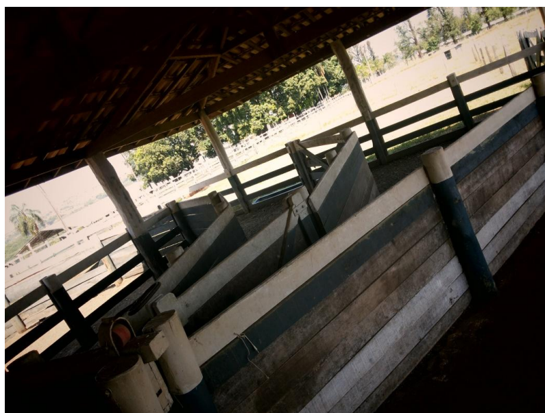
Figura 7 – Seringa em curva