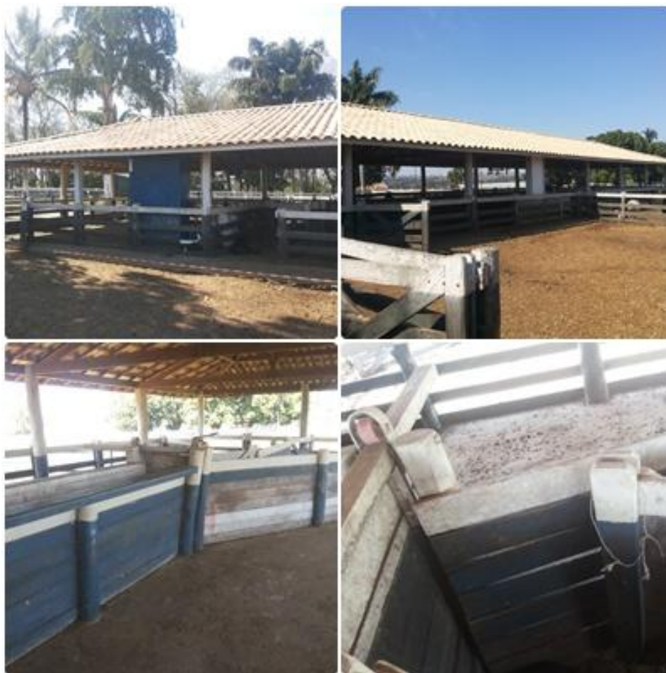
Figura 8 - Instalações no modelo australiano