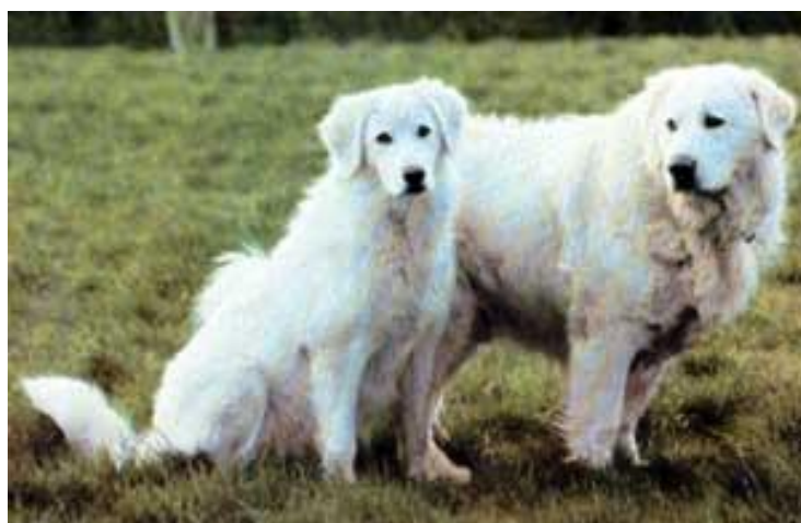
Figura 4: Cães da raça Maremano Abruzês

Já os cães da raça Maremano Abruzês, de origem italiana existentes há 2 mil anos, são destinados à proteção dos rebanhos contra o ataque de predadores. Esses animais, durante toda sua seleção, foram submetidos à vida dura, rústica e solitária, conferindo aos mesmos um temperamento único e especial. Seu comportamento é de submissão aos animais do rebanho, seguindo-os 24h por dia de maneira ininterrupta e não oferecendo riscos de predação à estes. Durante o período da noite, são extremamente ativos, patrulhando os limites, demarcando seu território e latindo quando houver risco de predação ao rebanho. Já durante o período diurno, são pacatos e preguiçosos mas nunca desatentos aos rebanho. O sucesso do Maremano Abruzês no exercício de sua função não é marcado pela quantidade de predadores mortos – sendo que o ataque só é feito em último caso, se o predador continuar avançando mesmo após os latidos –, mas sim pela ausência dos predadores no território. São animais que conseguem distinguir sons ofensivos ou inofensivos, animais fortes e bens constituídos com audácia suficiente para que possa impedir qualquer tipo de ataque ao rebanho. O pastor Maremano Abruzês vive entre 10 a 14 anos e não necessita de treinamento para exercer suas funções.