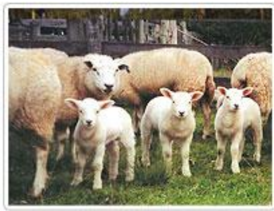
Figura 2: Ovinos Texel

No Brasil, a raça foi introduzida em 1972, pelos criadores Halley Marques e Ligia Vargas Souto que importaram da Holanda 18 fêmeas e 2 machos para suas fazendas, no município de Itaqui/RS (BRASTEXEL, 2014).