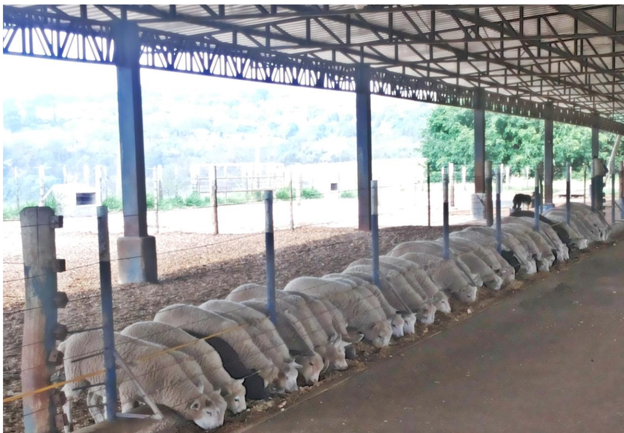
Figura 13 - Cordeiros no confinamento

O confinamento tem capacidade estática para 600 animais podendo terminar 2000 cordeiros por ano e anteriormente já recebeu animais de terceiros, prática que não é mais realizada na unidade. O trato é fornecido aos animais de forma manual com o auxílio de um trator somente para o transporte da silagem. Os dejetos orgânicos são retirados logo após a saída dos lotes e os mesmos são utilizados como adubo nas pastagens da própria Cabanha.