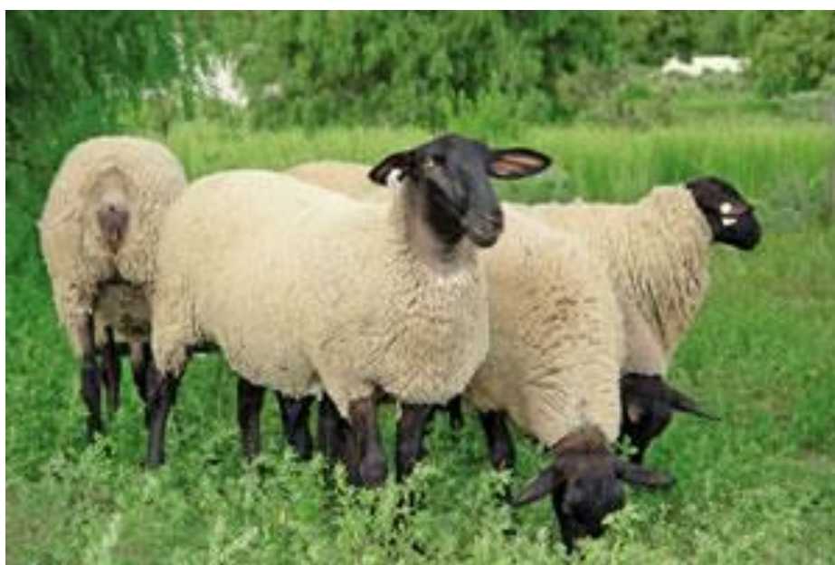
Figura 1: Ovinos Suffolk

A expansão de fato começou no início da década de 1980, com importações feitas da Inglaterra e Nova Zelândia. A partir de 1990 houve importações massivas dos Estados Unidos e Canadá e hoje a raça está presente em todo o Brasil, com predominância nos estados das regiões Sul, Sudeste e Centro-Oeste (ARCO, 2014).