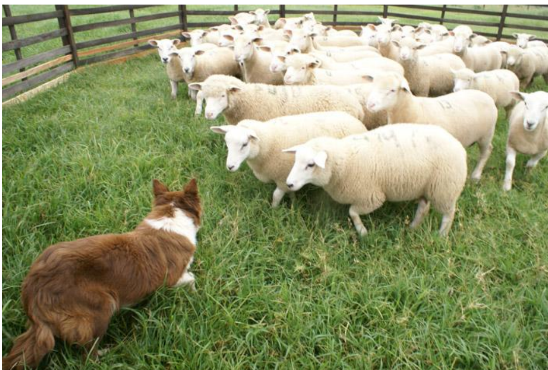
Figura 15- Cão da raça Border Collie

Os animais chamados popularmente de “cães de pastoreio” podem exercer funções distintas e para isso requerem características especializadas.