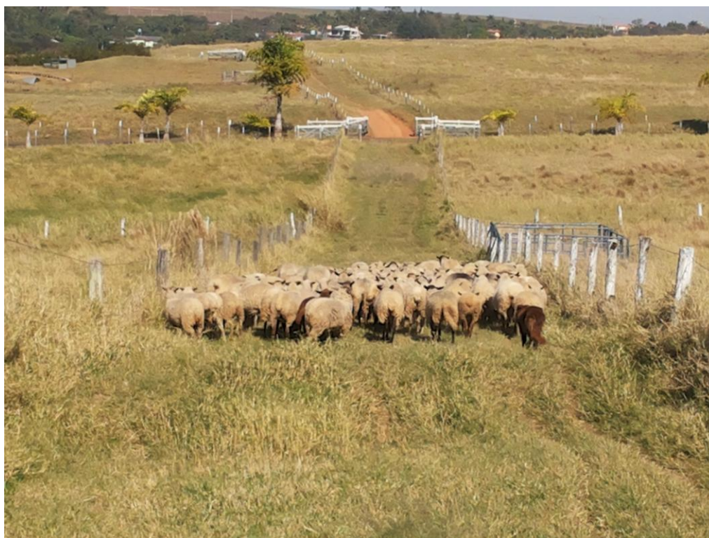
Figura 17 - Rebanho de ovinos sendo conduzido pelo Border Collie