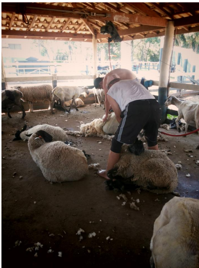
Figura 14 – Tosquia dos ovinos

Uma vez por ano, geralmente entre os meses de setembro/outubro, os animais da Cabanha são tosqueados, exceto os cordeiros. A tosquia é executada por uma empresa terceirizada que possui parceria com a UNIMAR, realizando o serviço em troca da lã.