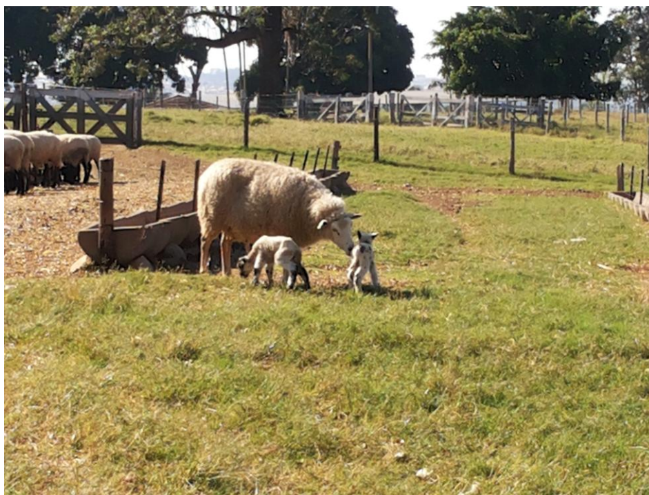
Figura 10 - Ovelha Texel com suas crias

atividade de parto. As matrizes parem no próprio pasto e após limparem suas crias e as mesmas mamarem o colostro, são recolhidas ao centro de manejo onde ficam nos primeiros 10 dias de vida. Normalmente não ocorrem problemas com partos distócicos e nem problemas com rejeição de crias, no entanto, quando os mesmos ocorrem, as ovelhas são levadas ao Hospital Veterinário da UNIMAR, onde passam pelos devidos procedimentos e permanecem até a liberação para retornarem à fazenda. A prolificidade do rebanho atualmente é de 1.2.