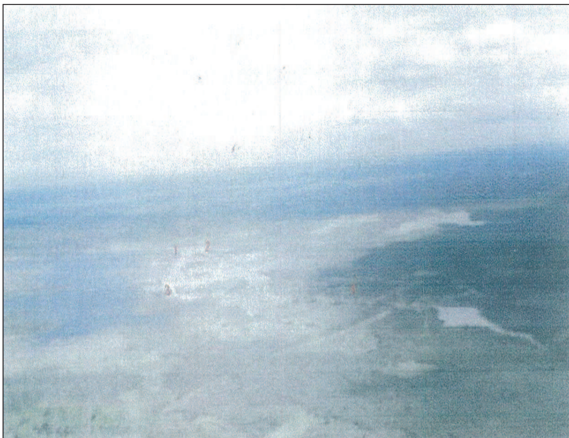
Foto panorâmica do Assentamento Santa Bárbara.