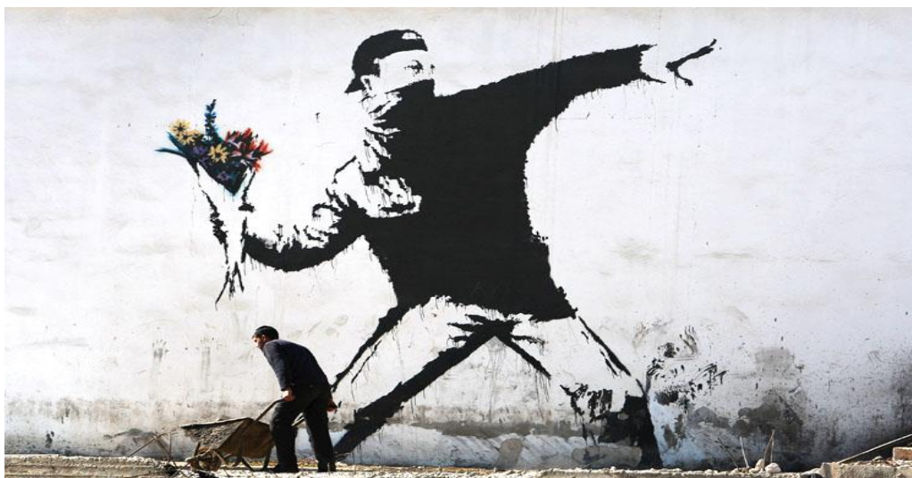
FIGURA 02 – GRAFITE STENCIL