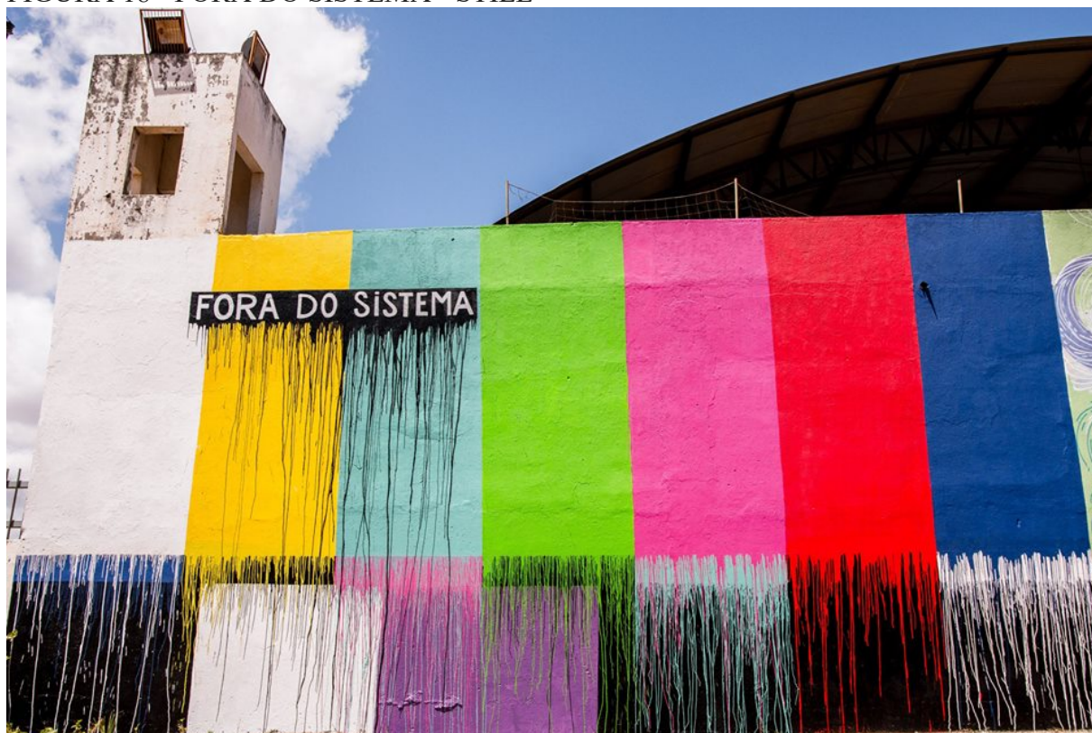
FIGURA 18 - FORA DO SISTEMA - STILE