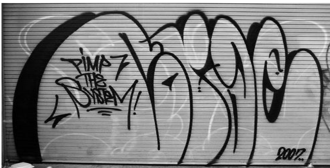
FIGURA 05 – GRAFITE THROW-UP