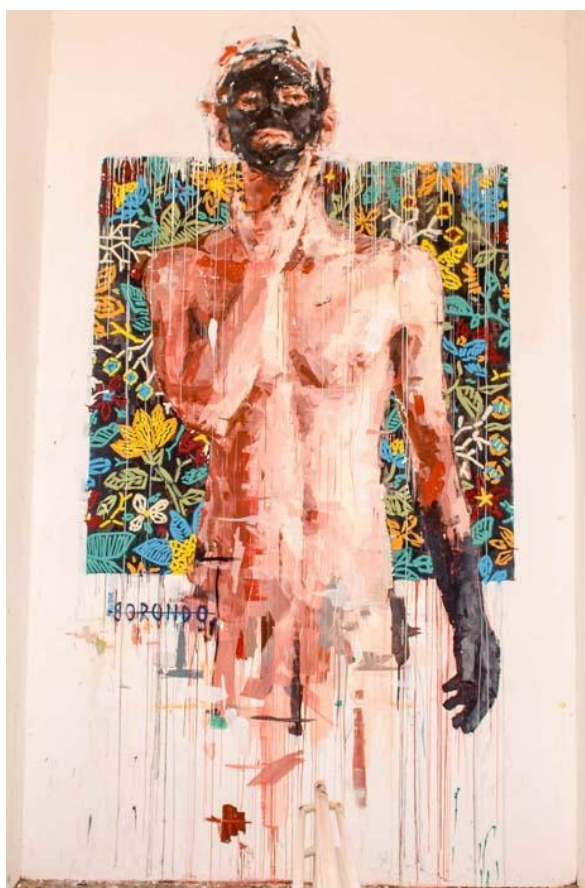
FIGURA 11 - MARACATU - BORONDO