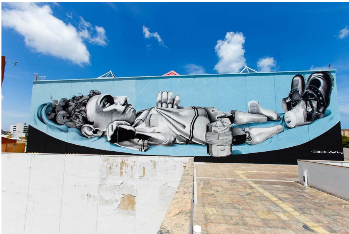
FIGURA 14 - MURAL ETHOS - CLAUDIO ETHOS