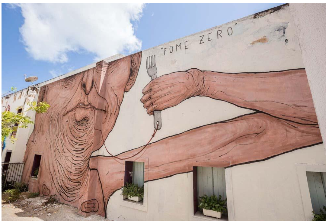
FIGURA 09 - FOME ZERO - NEMO's