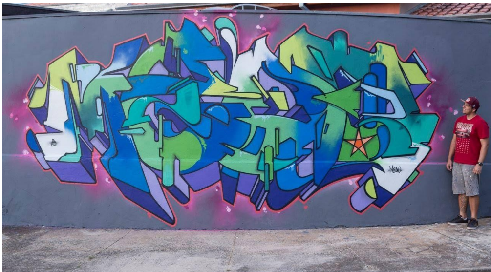
FIGURA 04 – GRAFITE WILDSTYLE