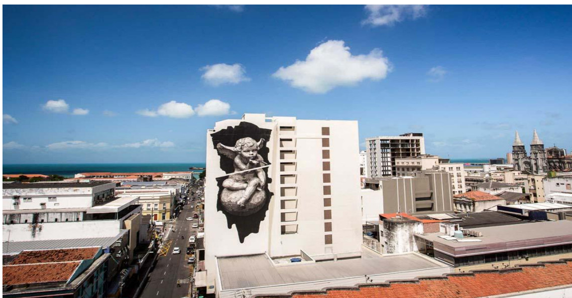
FIGURA 12 - CÉU E INFERNO NA TERRA - INO

Fonte: http://www.festivalconcreto.com.br/wp-content/uploads/festival-concreto-2015-historico-32.jpg