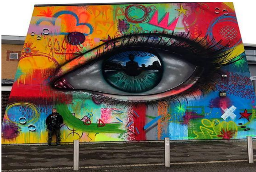
FIGURA 06 – GRAFITE FREESTYLE