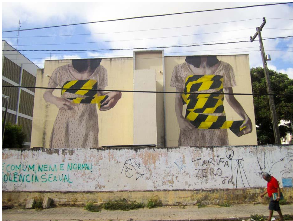
FIGURA 10 - PUBLICO/PRIVADO - HYURO