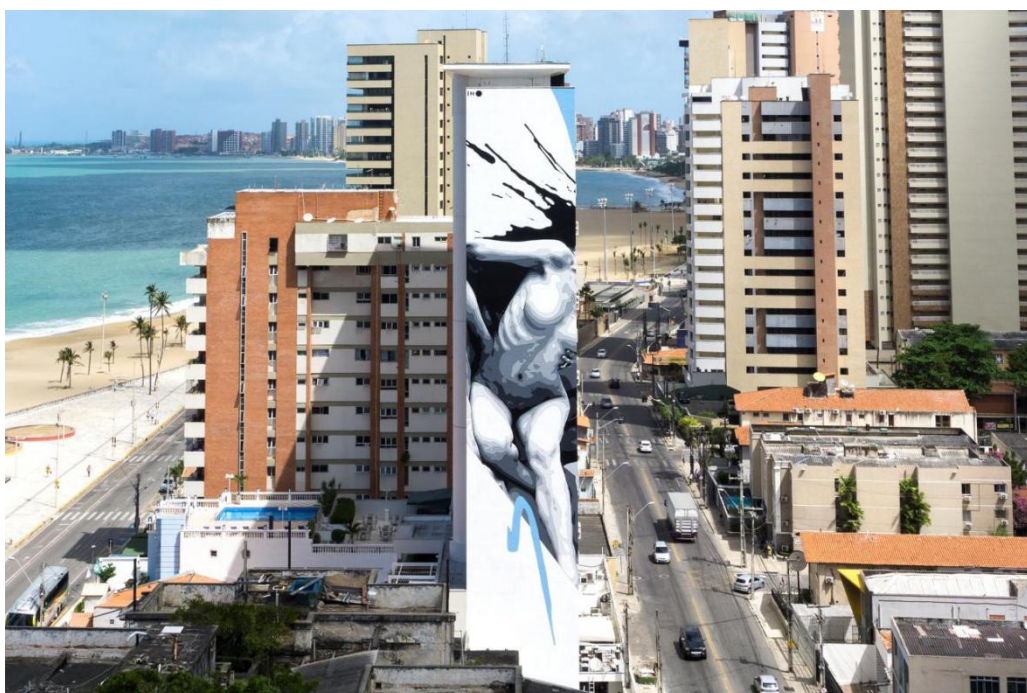
FIGURA 13 - BROKEN - INO