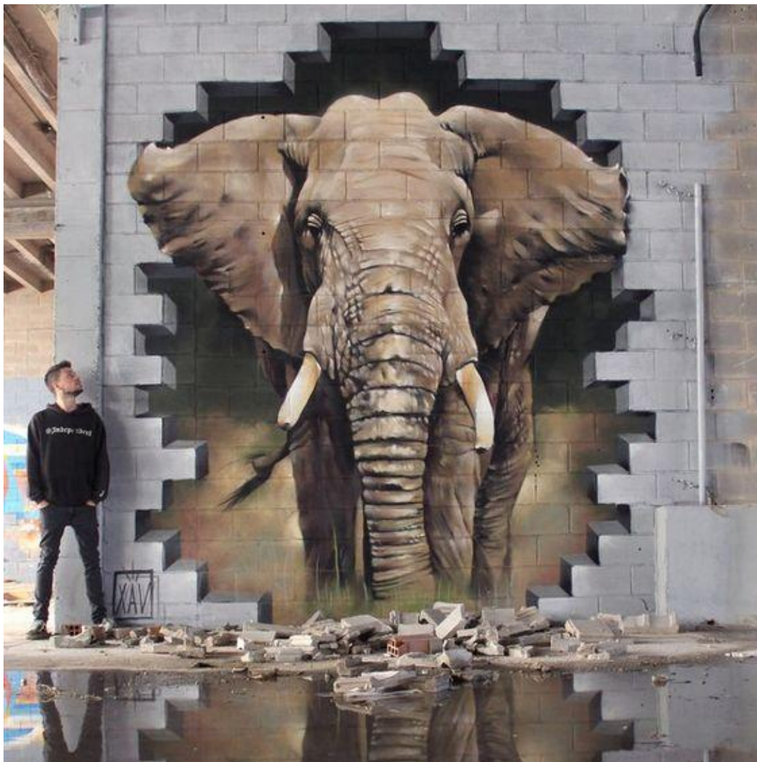
FIGURA 08 – GRADITE 3D STYLE