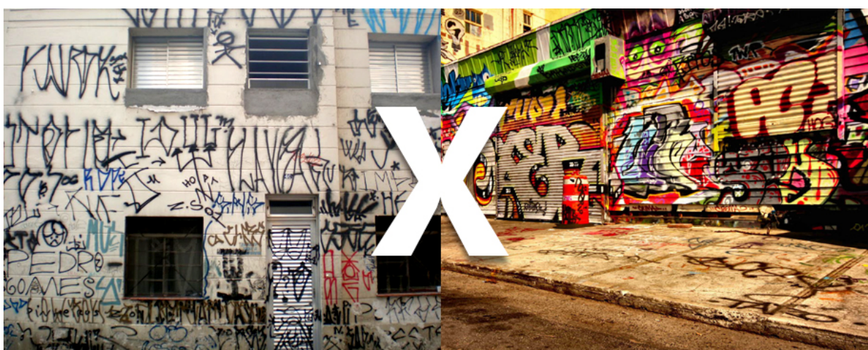
FIGURA 01 - PICHAÇÃO X GRAFITE