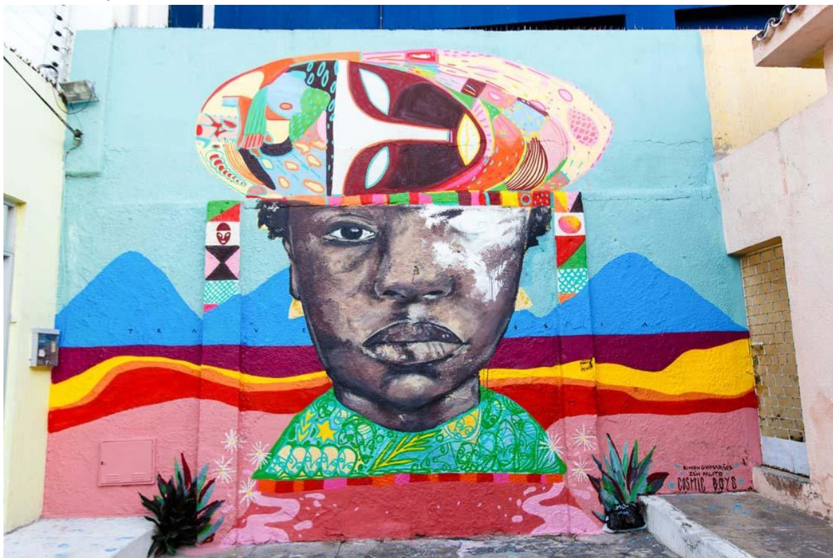
FIGURA 16- OBRA SEM TÍTULO - COSMIC BOYS