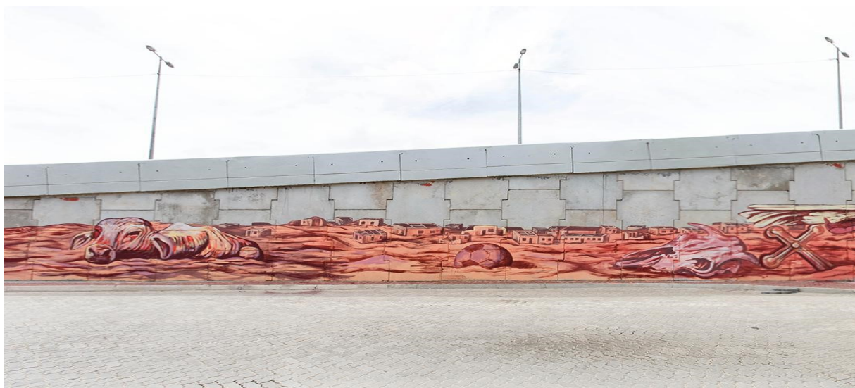
FIGURA 15 - VERDE LAMA - DINHO BENTO

É durante esse aprofundamento que a imagem ganha um novo significado. O garoto passa a ser ícone de uma causa, enquanto empina, o que podemos imaginar ser uma pipa, símbolo de esperança e força, mas também pode fazer alusão a uma brincadeira infantil típica da cultura brasileira, já que segundo Laraia (2000) temos a necessidade de atribuir um sentido ao que nos é desconhecido.