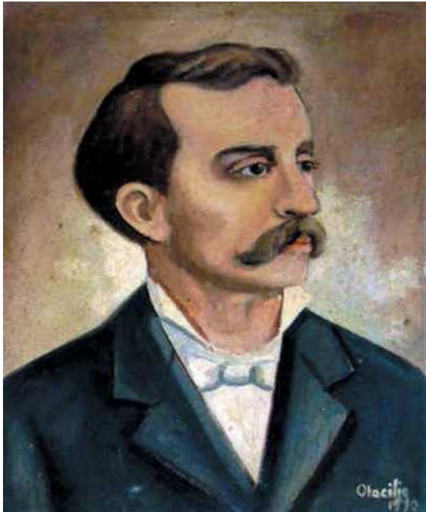
Figura 03: X. de Castro. Óleo sobre tela de Otacílio de Azevedo. Acervo da Academia Cearense de Letras.

Entre 1891 e 1894 não pudemos localizar nada sobre X. de Castro. O professor Sâncio de Azevedo localizou um cromo de X. de Castro n’ A República (fundada em 1892 a partir da fusão do Libertador com O Estado do Ceará ) de 10 de outubro de 1894. Não podemos precisar se X. de Castro publicou ou não alguma coisa entre os anos de 1891 e 1894 devido à escassez de exemplares de periódicos desses anos nas hemerotecas que consultamos, mas podemos inferir, através das palavras de Ulisses Bezerra, no já citado número 17 d’ O Pão , que o poeta provavelmente passou algum tempo sem publicar: