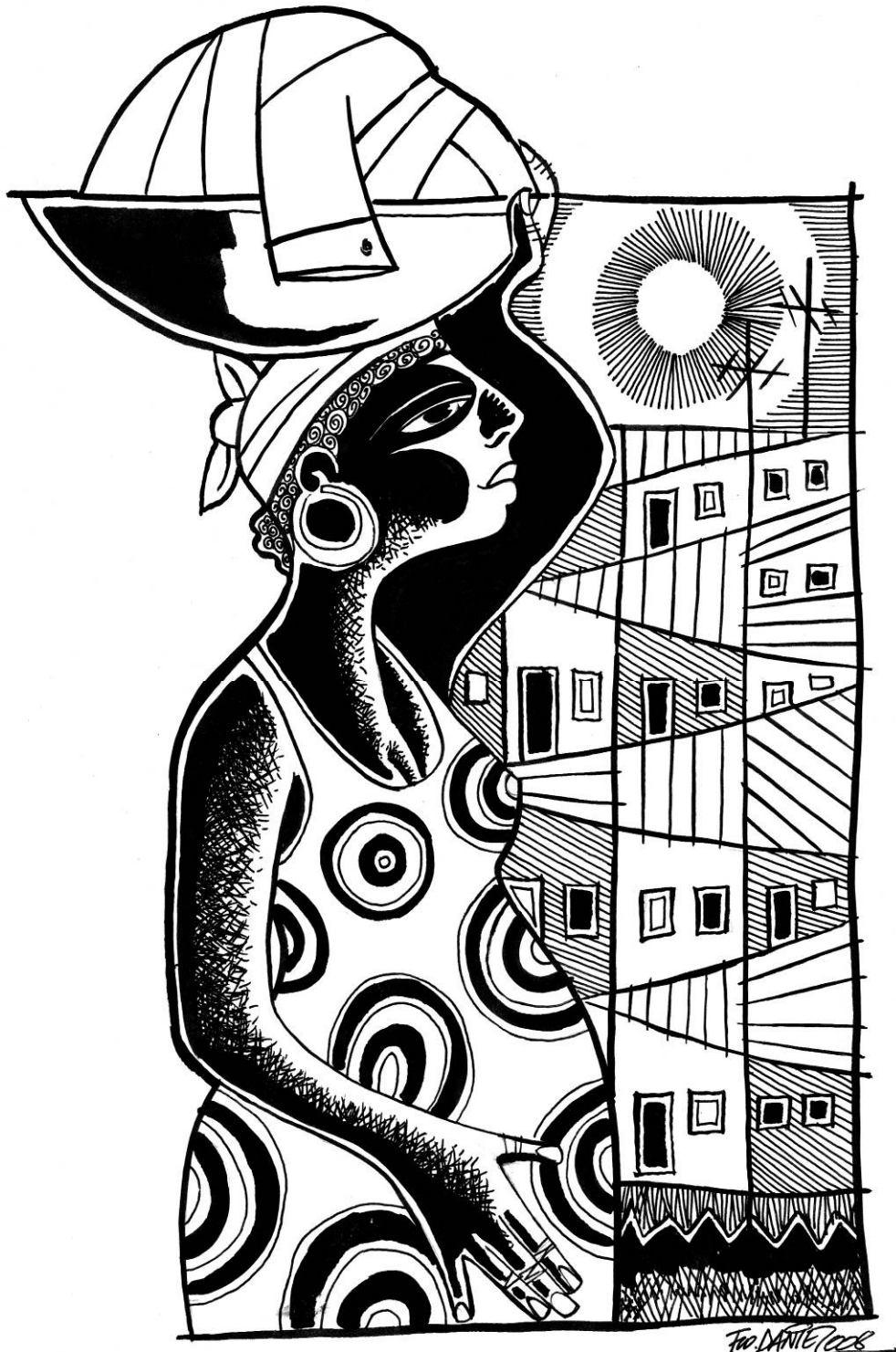
Figura 07: A lavadeira . Nanquim sobre papel de Francisco Daniel

—Tu deixa de atrevimento... Moleque, tem fundamento... Sae d'ahi, negro!—charuto!