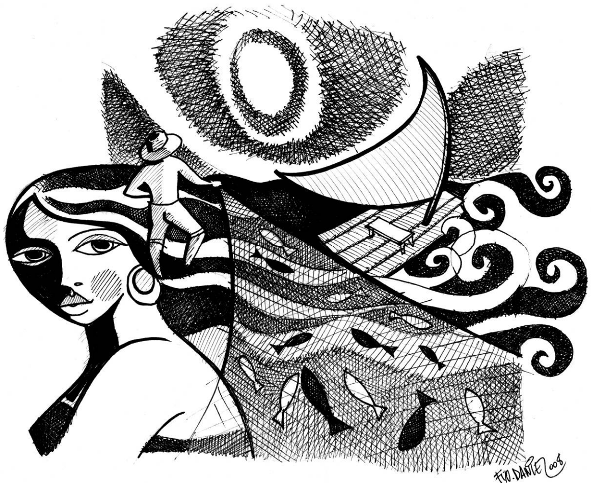
Figura 05: Resignada . Nanquim sobre papel, de Francisco Daniel

—Espera, á porta sentada, Que volte a alegre jangada Do marido,—o pescador.