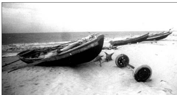
Figura 2 – Modelo de carreta solicitada pela comunidade pesqueira do Pecém para viabilizar a movimentação de embarcações na praia.

No recinto onde também se comercializa gelo, várias espécies de peixes puderam ser identificadas, com destaque para aquelas de maior abundância, tais como ariacó, Lutjanus synagris , beijupirá, Rachycentron canadus , arraia-manteiga, Dasyatis americana , guarajuba, Caranx crysos , cavala, Scomberomorus cavalla , galo, Selene vomer , parubranco, Chaetodipterus faber , e guaraximbora, Caranx latus . Considerando-se a informação de que o pescado tem origem em outra comunidade, obviamente este não pode ser registrado como produção local, apesar dessas espécies serem também características da área do Pecém.