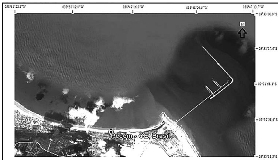
Figura 1 - Área da costa do município de São Gonçalo do Amarante, mostrando a localização do Terminal Portuário do Pecém.