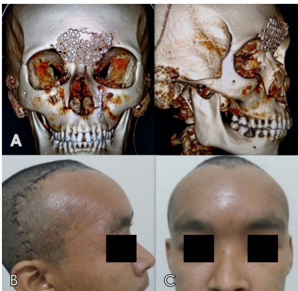
Figura 3: A- Reconstrução 3D imediata ao pós-cirúrgico. Nota-se o sistema de fixação utilizado e o correto posicionamento ósseo das fraturas. B-C Paciente em um controle pós-operatório de 15 dias. B- Vista Lateral e C- Vista Frontal. Estética facial reestabelecida, com correta distância intercantal, ausência de distopia ocular, e projeção nasal corrigida, bem como uma satisfatória arquitetura do osso frontal.

No pós-operatório de 15 dias foi removida sutura em pele sem nenhuma queixa algica relatada, e após um acompanhamento de 12 meses, não foi observada nenhuma complicação e/ou intercorrência. Paciente apresentava um resultado satisfatório e a estética restabelecida.