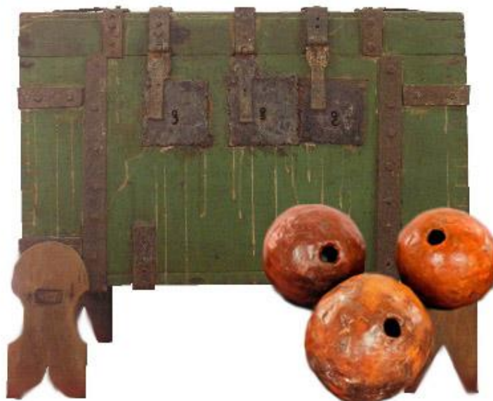
Figura 2 – Cofre e pelouros típicos do Brasil colonial em que se guardavam os nomes das pessoas eleitas para os cargos de oficiais das câmaras municipais.