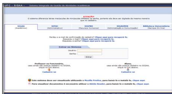
Imagem 1 – Tela inicial do SIGAA. Primeiro acesso: o aluno devera clicar no link à direita onde há escrito cadastre-se abaixo do nome “aluno”.

professores, alunos e a coordenação do curso. Os docentes das disciplinas utilizam o SIGAA como uma plataforma pedagógica, onde postam atividades, textos, notas, frequência e os participantes de cada disciplina. É importante manter os seus dados cadastrais sempre atualizados. Para acessar o SIGAA basta acessar o link www.si3.ufc.br.