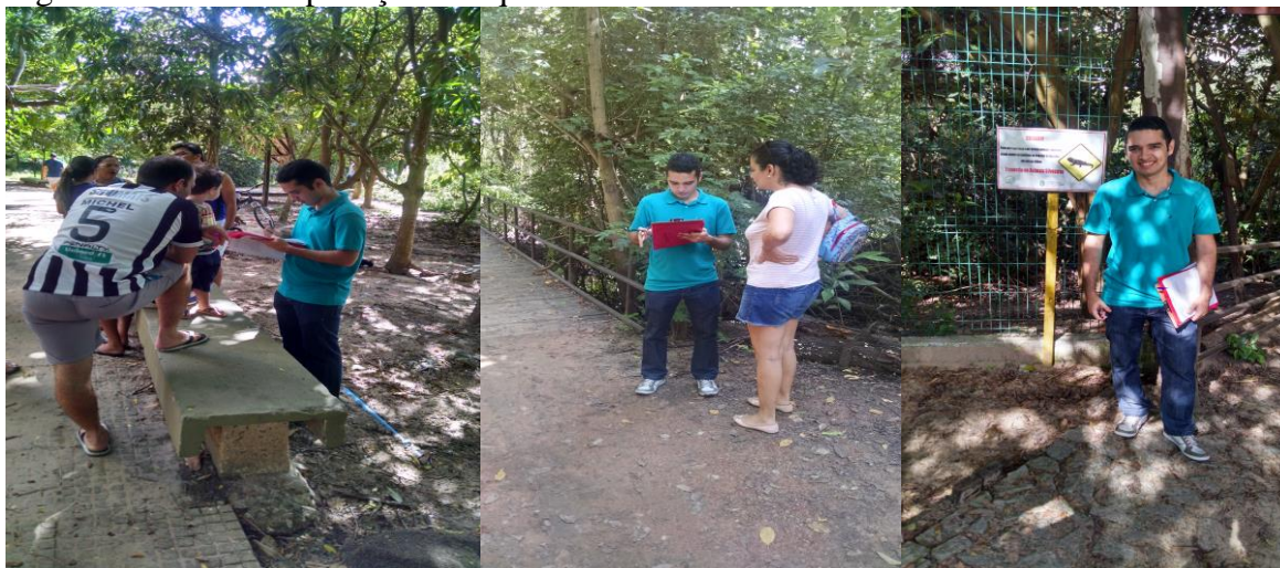
Figura 1 – Fotos da aplicação dos questionários