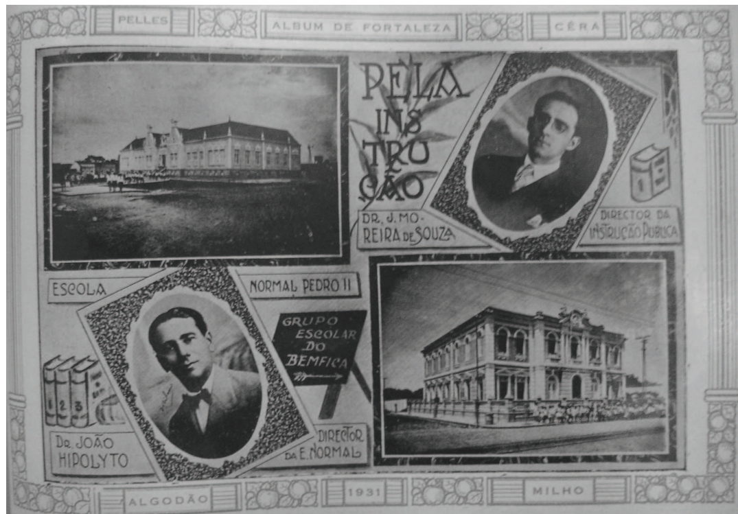
Figura 2: Pela Instrução. Álbum de Fortaleza, 1931.