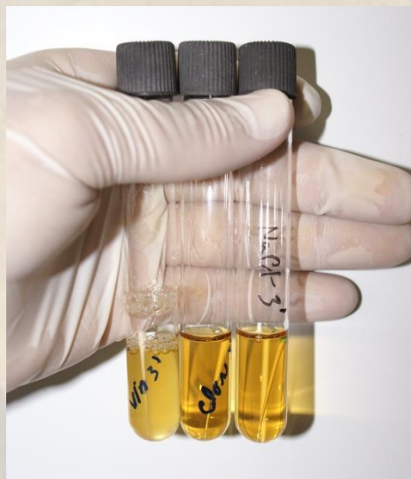
Figura 3. Avaliação da turvação dos meios de cultura após 7 dias.