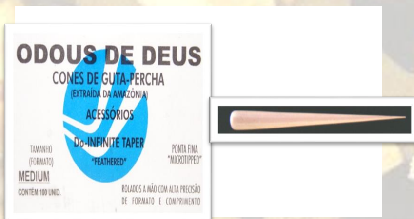
Figura 1. Cones de guta-percha utilizados no estudo.

Embora os cones de guta-percha sejam considerados os materiais de escolha para a obturação dos sistemas de canais radiculares, eles apresentam a desvantagem de não resistirem aos processos convencionais de esterilização pelo calor úmido ou seco. Por esta razão, mesmos eles sendo comercializados acondicionados em caixas fechadas, não se apresentam esterilizados. Com o cuidado de não quebrar a cadeia de assepsia, os cones de guta-percha necessitam de uma descontaminação rápida no momento do uso (4).