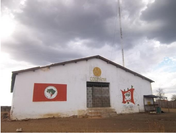
Foto: sede da Cooperativa do Assentamento onde está instalada a Rádio 25 de Maio