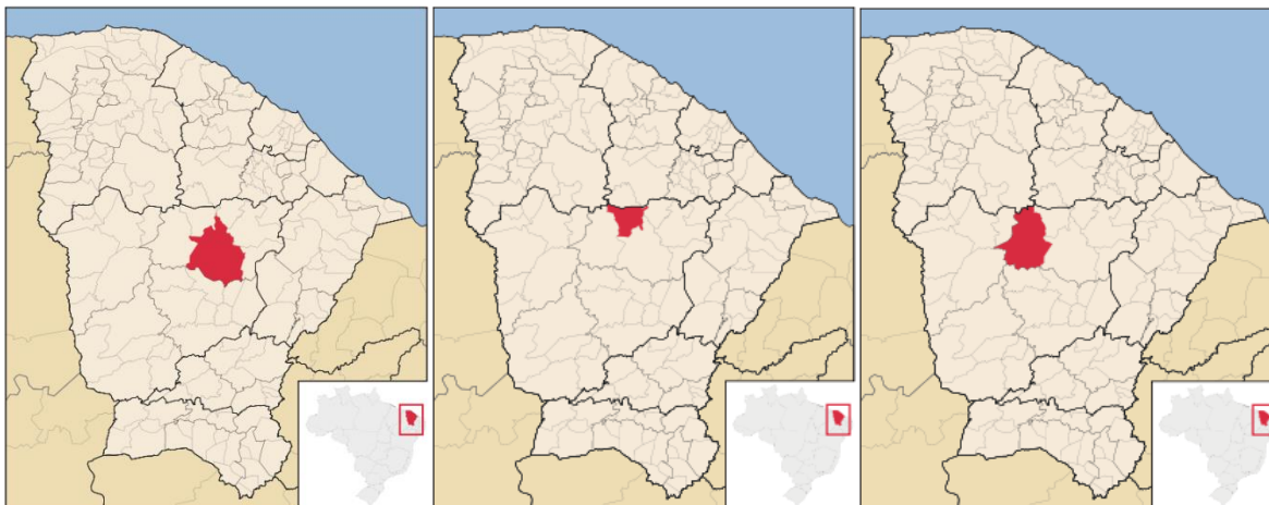
Imagem 1. Mapa município de Quixeramobim

grilagens de terras, ocupava um total de 22.992,498 hectares de terra (mapas abaixo).