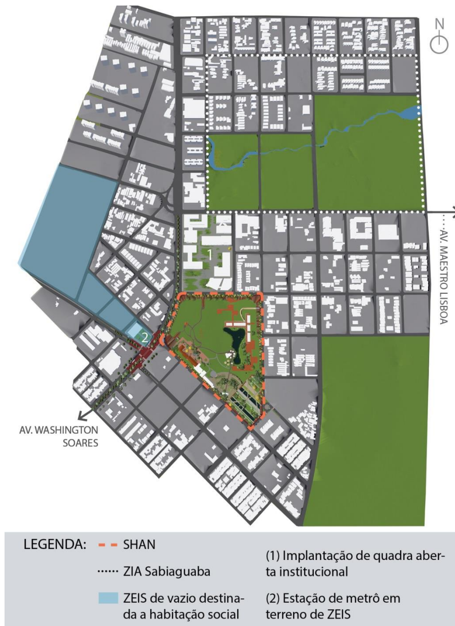
Figura 3: Proposta de conexão do SHAN com os instrumentos do PDP de Fortaleza.