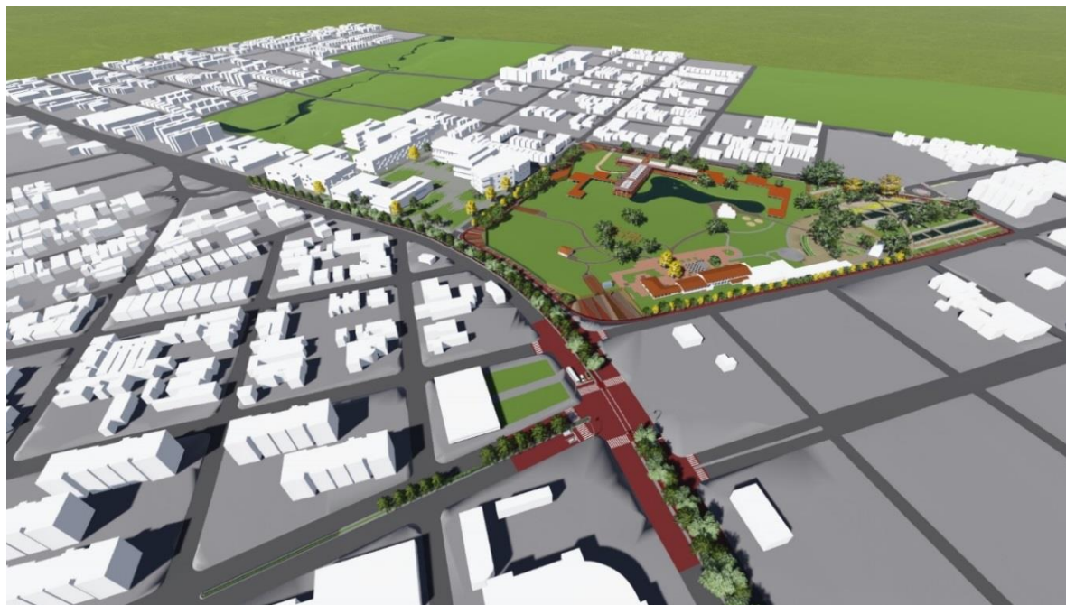
Figura 4: Vista área da proposta de intervenção urbanística no entorno do SHAN.

estar social na construção da cidade. A conjugação da proteção do patrimônio com o ordenamento do território e os seus instrumentos reforçam a ideia de que uma gestão inteligente dos recursos patrimoniais constitui um elemento a ser seriamente considerado na sustentabilidade do desenvolvimento urbano (Fig.4).