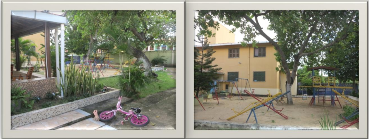
Imagens 03 e 04: Lateral direita e parquinho