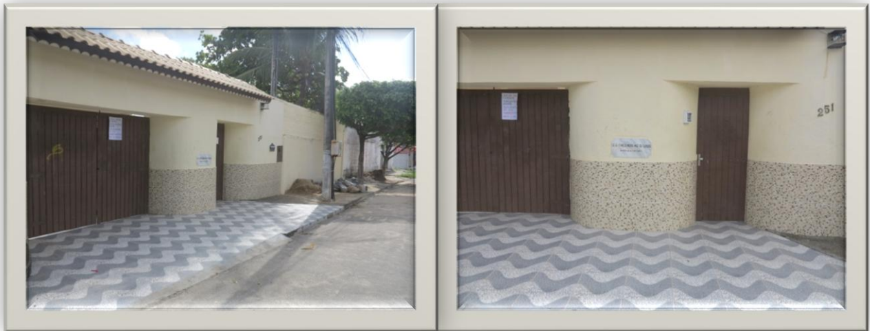
Imagens 01 e 02: A rua e a entrada da Casa Família

Chegando ao portão pequeno, é preciso interfornar e é possível ver as câmeras de segurança no entorno do muro. Medida de segurança comum, nas residências atualmente.