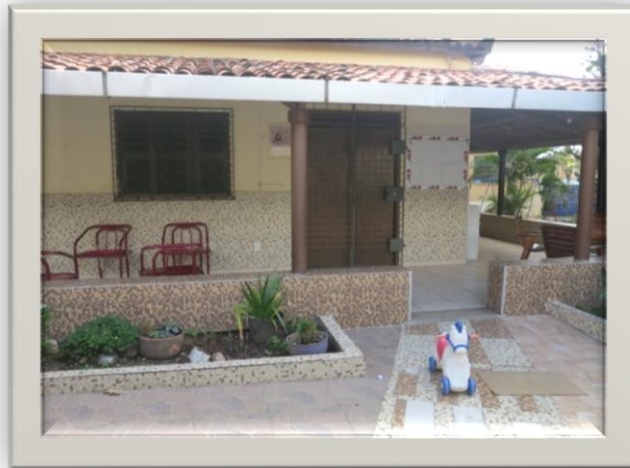
Imagem 07: Alpendre