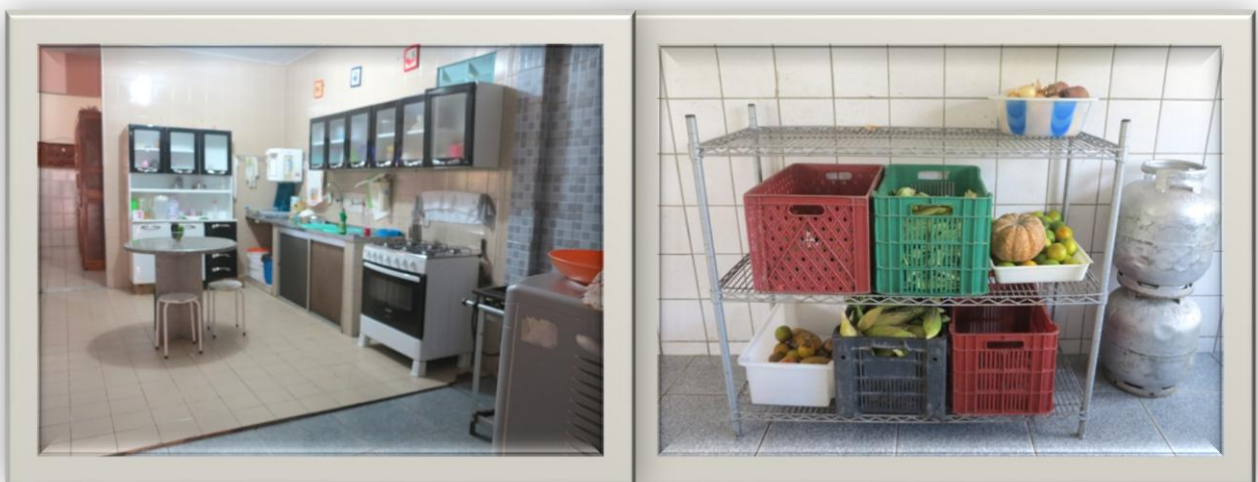
Imagens 08 e 09: Cozinha e área de serviço

Há dois acessos ao interior da instituição: o primeiro, pela frente da casa, uma porta ao centro do alpendre (ver imagem 07). O acesso nos leva à ante-sala, seguida por uma sala de TV e salas para estudo, como um escritório, chegando a uma mesa para refeições das Irmãs, em frente à cozinha ampla e bem equipada e ao lado de outras salas de trato pessoal das Irmãs. É possível ver uma escada que leva aos dormitórios das Irmãs e seguindo pela cozinha chega-se até a área de serviço, com tanques, máquinas de lavar e equipamentos de limpeza, por fim o quintal.