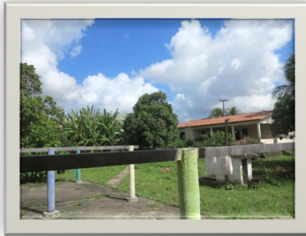
Imagem 15: Quintal