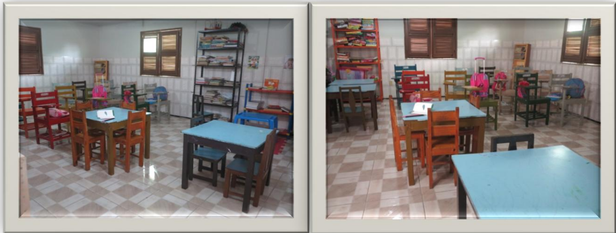
Imagens 13 e 14: Escolinha