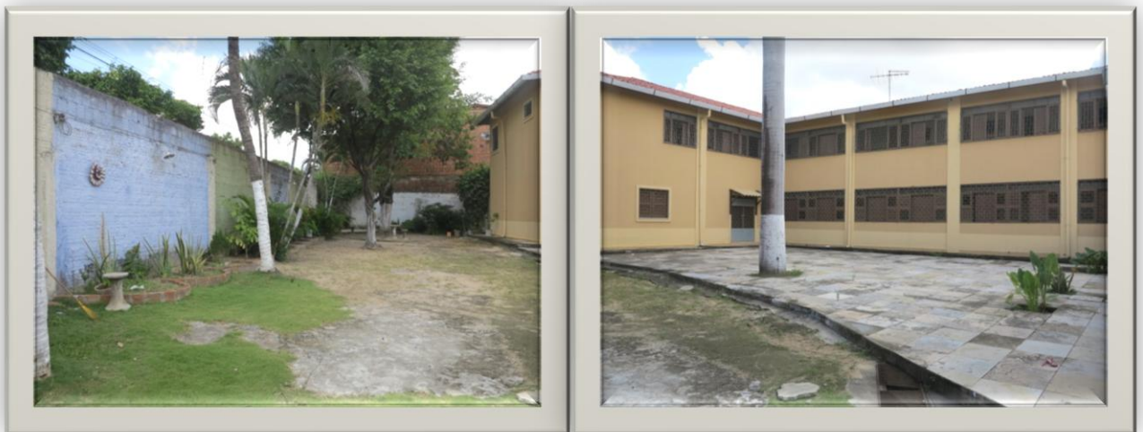
Imagens 05 e 06: Lateral esquerda e pátio

Do lado esquerdo, mais plantas, jardins, uma mesa e bancos de cimento sob uma árvore enorme e um pátio aberto.