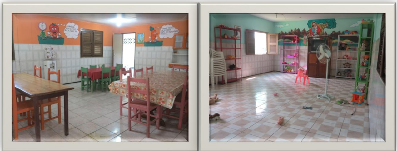
Imagens 11 e 12: Refeitório e Sala de TV

O corredor passa pelo refeitório das crianças, com mesas, cadeiras pequenas e grandes, coloridas. O cômodo seguinte é uma sala que uns chamam de sala de TV ou sala de lazer, espaço com equipamentos de vídeo, de livre acesso pelas crianças, estantes com diversos jogos e brinquedos, cadeiras e espaço livre para brincar.