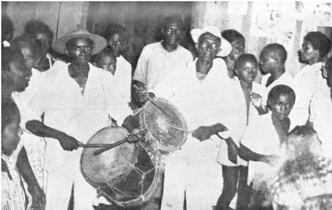
Festa de Marabaixo: Disponível em: http://porta-retrato-ap.blogspot.com.br