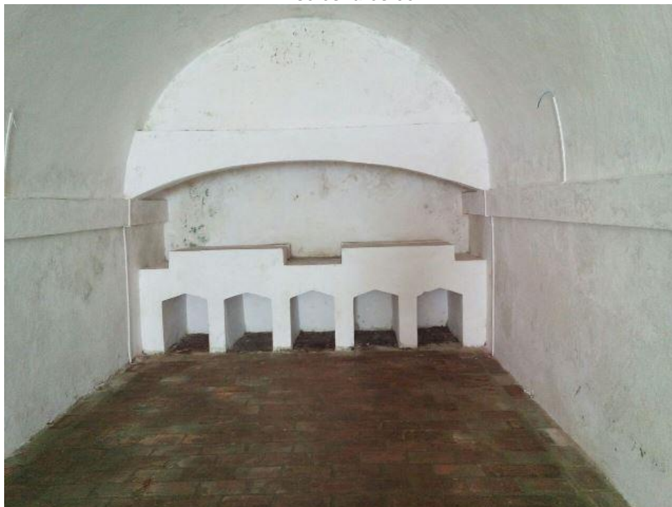
Casamata da Fortaleza São José de Macapá.