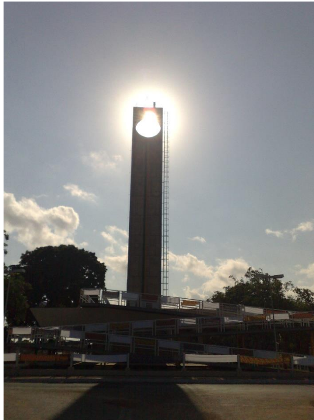
Equinócio da Primavera.