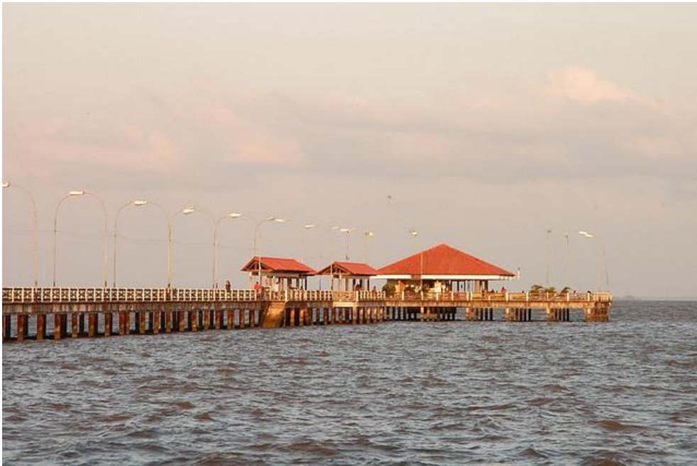
Trapiche Eliezer Levy.