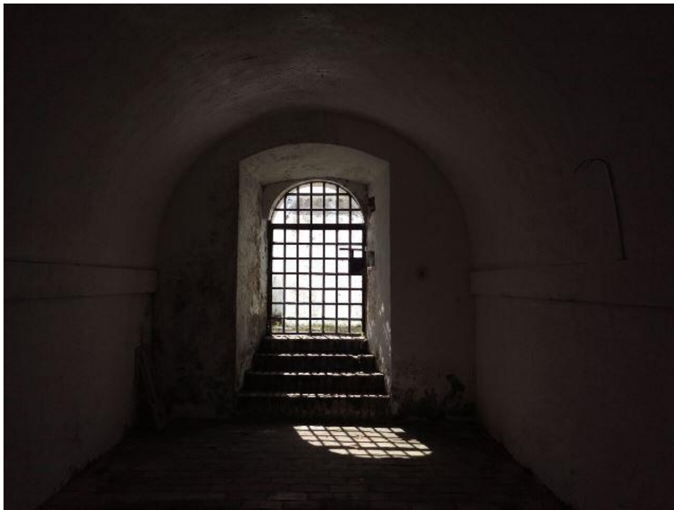
Calabouço da Fortaleza de São José de Macapá.