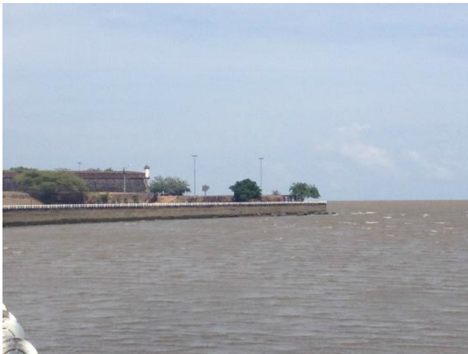
Rio Amazonas. Disponível em: https://www.tripadvisor.com.br