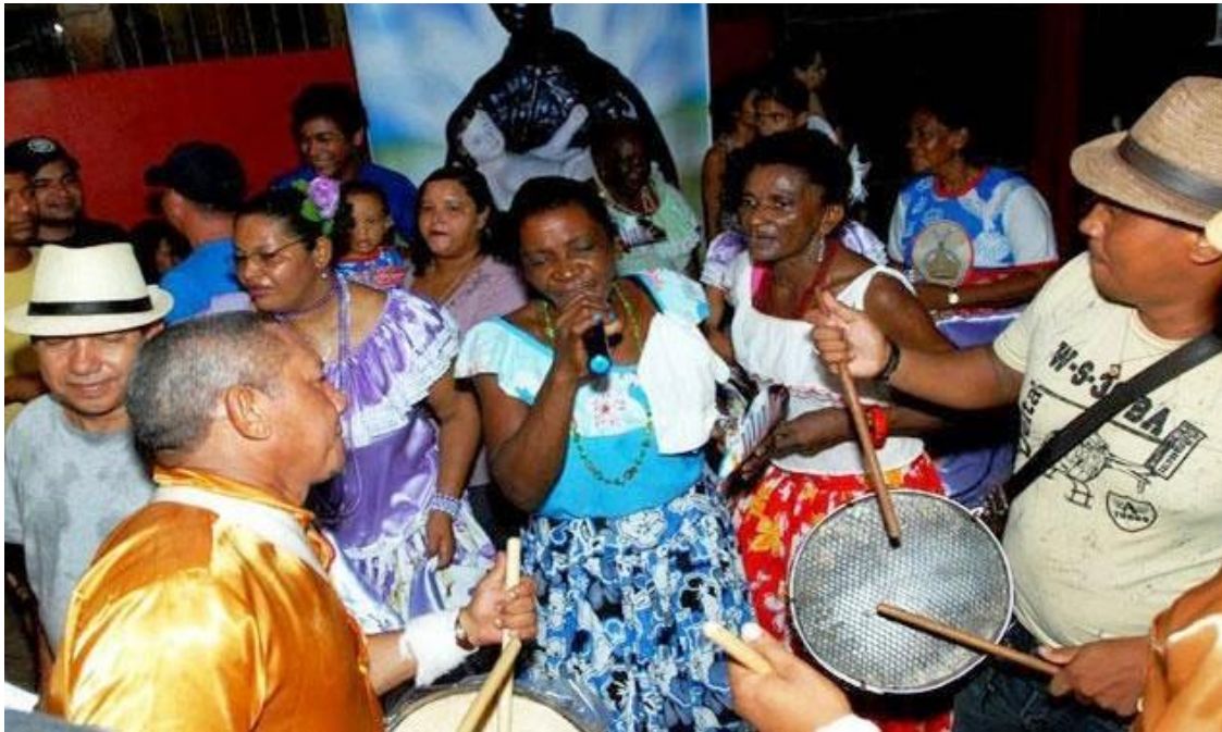
Festa de Marabaixo.