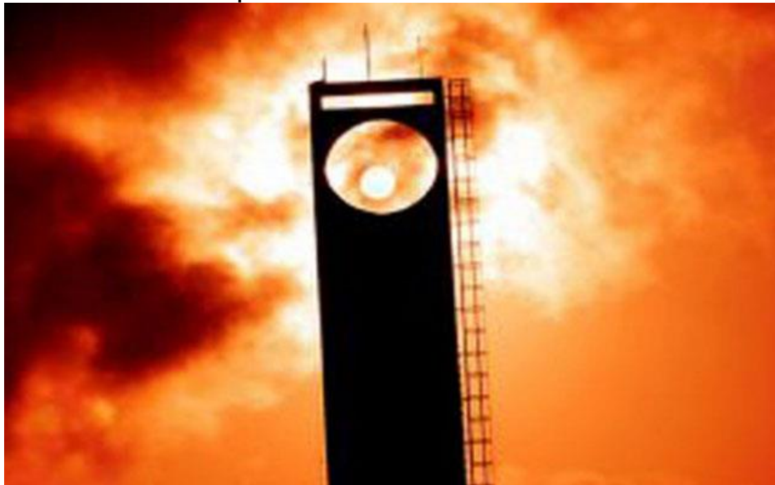
Equinócio da Primavera.