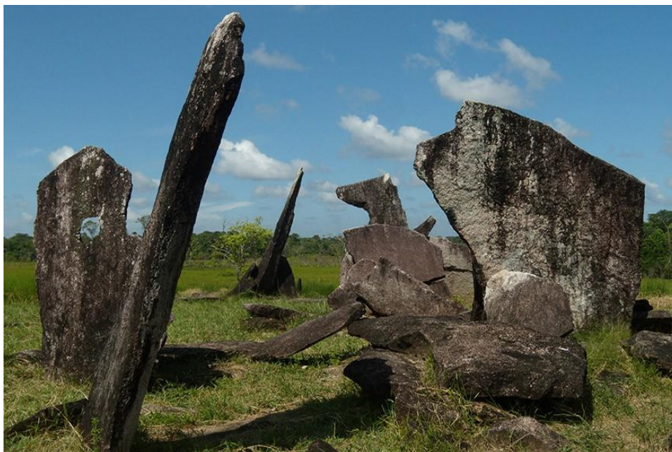
Sítio Arqueológico de Calçoene. Disponível em: http://portal.iphan.gov.br/galeria/detalhes/143?eFototeca=1