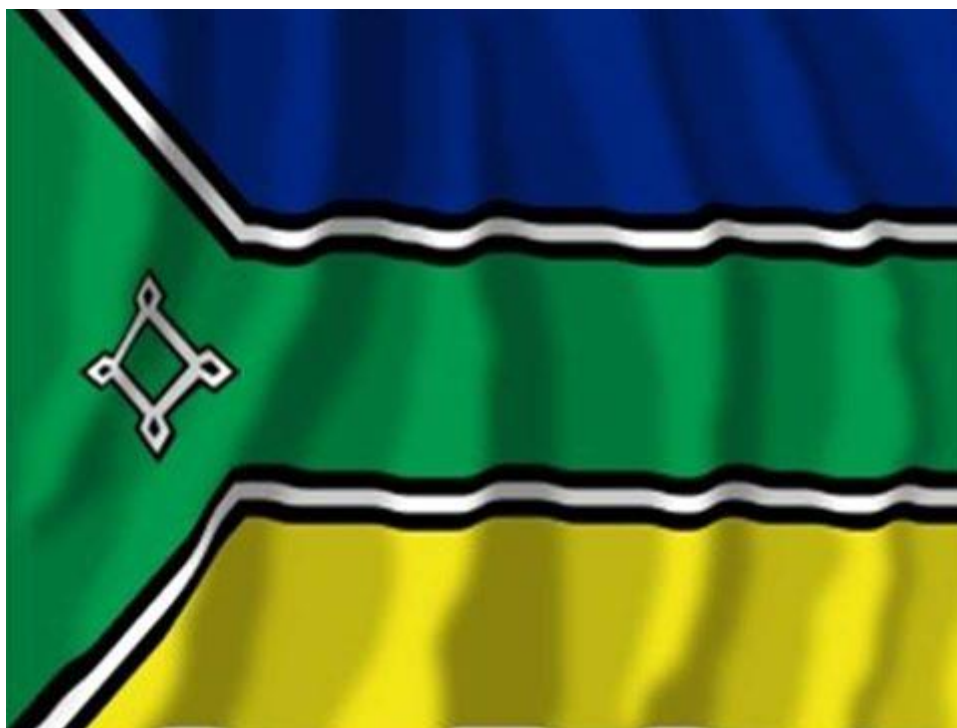
Bandeira do Estado do Amapá.

Azul: Representa o céu e a Justiça. Verde: Perfaz 90% da área do Estado; representa a floresta nativa – ainda preservada – a esperança, o futuro e o amor, além da liberdade e a abundância. Amarelo: representa a União e as riquezas do Subsolo. Branco: Tem a simbologia da pureza, da paz, do desejo de segurança e da união entre seus habitantes, evitando-se a discórdia entre poder público e seus moradores. Negro: representa o respeito aos antepassados que enalteceram a região. Estas interpretações estão contidas no Decreto 4120/1984 (Fonte: Edgar de Paula Rodrigues).