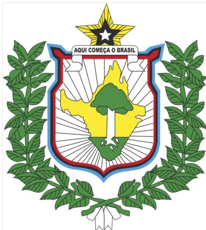
Brasão de Armas do Estado do Amapá.

I - Ao topo a estrela branca e as arestas amarelas simbolizando o surgimento de mais um Estado da Nação. A cor branca simboliza a pureza, a serenidade e paz. O amarelo nossas riquezas.