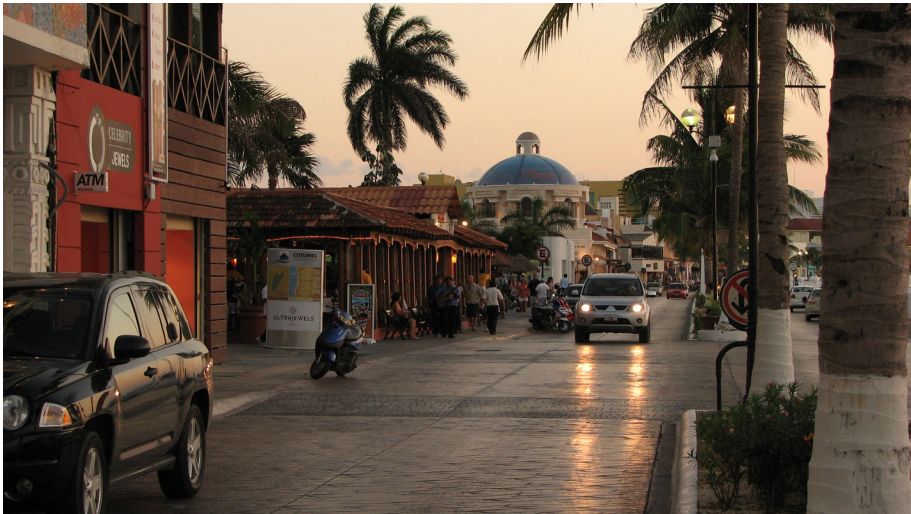
Imagen 5. Restaurantes, bares y hoteles en el Malecón de Cozumel (Fotografía: Antonio Rodrigues, 2012).

decreto presidencial de 27 de mayo de 1974, bajo el argumento de que en esas tierras no se realizaban más actividades agrícolas que justificaran la dotación y que, por otro lado, dichas tierras habían adquirido gran interés turístico (RAN, Carpeta Básica del Ejido Cozumel, 1979c). Así, por razones de interés público, se expropió una gran parte del ejido Cozumel. 22