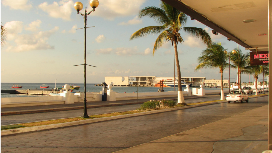
Imagen 4. Atardecer en el Malecón de Cozumel.

y 2016 los Juegos Olímpicos, eventos que tienen como objetivo impulsar el turismo en el país.