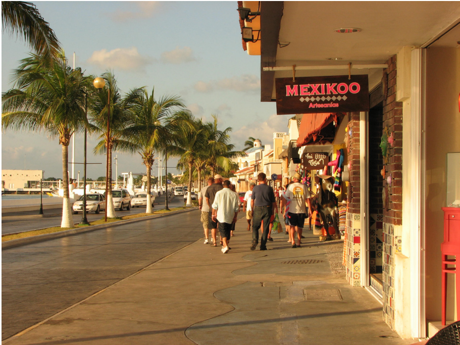
Imagen 3. Turistas de cruceros en el malecón de Cozumel.

económica en las estrategias de desarrollo; se carece también de una evaluación de los efectos de los diferentes tipos de turismo, sobre todo en cuanto a las posibles ventajas sociales, y está ausente una planeación que compare las ventajas de los proyectos turísticos elegidos con respecto a otros proyectos del mismo sector. De acuerdo con de Kadt, los métodos y técnicas de planificación adoptados no ponen de manifiesto las particularidades de cada país, sobre todo cuando se trata de países pequeños, en los cuales las posibilidades de maniobra son más limitadas por la ausencia de cuadros técnicos y administrativos calificados.