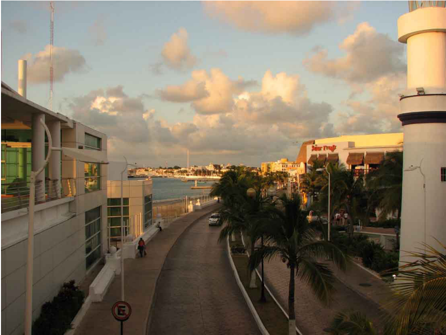
Imagen 2. Vista del muelle de Cozumel desde la zona hotelera.

turistas, además de la tripulación de las embarcaciones. 11 En 2012, por ejemplo, se llegó a un record histórico al recibir en la última semana de febrero un total de 24 cruceros, con cerca de 60 mil pasajeros, lo que supuso una derrama económica de aproximadamente cuatro millones de dólares. 12 Para el mes siguiente, se esperaba que el número de embarcaciones aumentara a 27, con la expectativa de generar un ingreso de seis millones de dólares. 13