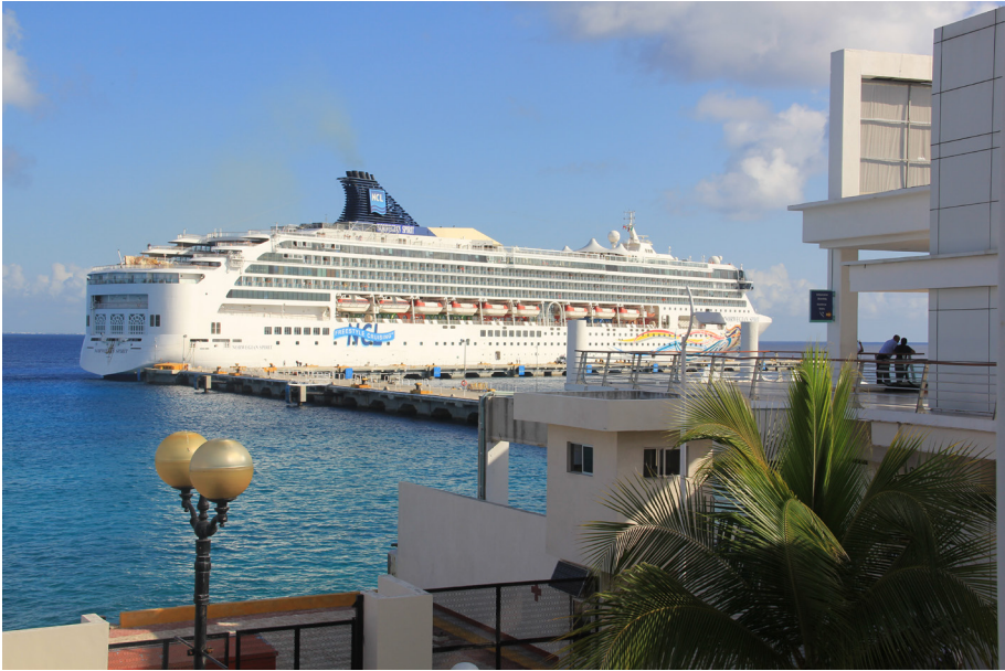
Imagen 1. Llegada de cruceros a Cozumel.

inversiones en el ámbito del turismo de masas. 3 En esta modalidad de turismo, Cozumel ocupa el segundo lugar mundial en la recepción de pasajeros, y el primer lugar en México y en la región del Caribe. 4