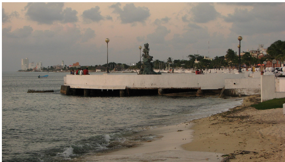
Imagen 6. Pobladores locales en la costa de Cozumel, a lo lejos la zona hotelera.

apropiación cultural muy común en los contextos del turismo, pero además se trata de un proceso que mina las capacidades de los ejidatarios por controlar su patrimonio, sea este una fiesta, su identidad territorial o las propias tierras, lo que pone en evidencia las desigualdades de poder y la fragilidad de los ejidatarios ante los grandes intereses de empresarios y políticos.