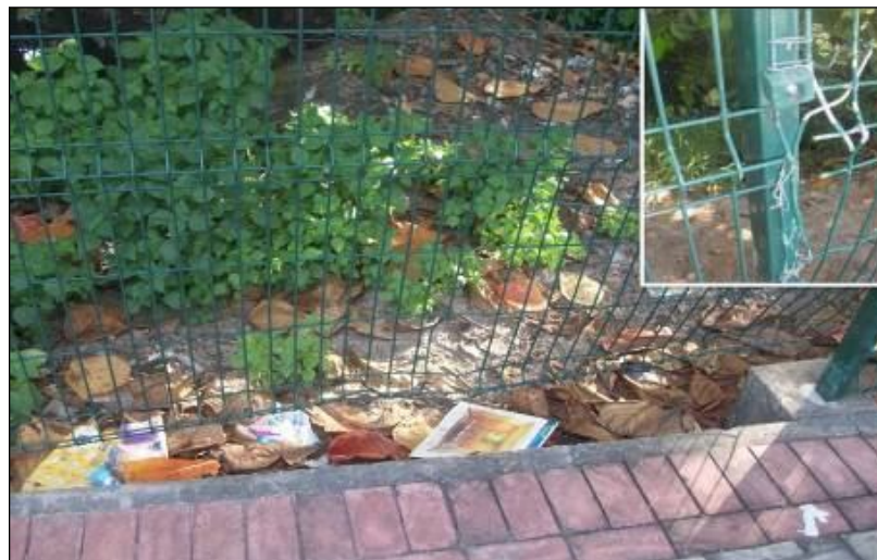
Figura4: Cerca danificada para entrada dos pescadores nas margens do Rio Cocó em baixo da ponte do Parque do Cocó