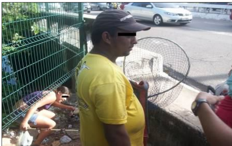
Figura 3: Pescadores entrando, por entre o desnível entre cerca e ponte do Rio Cocó, nas margens do Rio.

Pode-se apreender essa relação empiricamente no caso das cercas colocadas no Parque do Cocó, onde a normatização dos usos imposta pelo uso das cercas é burlada por ações que desviam/distorcem as ações planejadas para aquele espaço. Tais formas de se “driblar” e “confrontar” as cercas ali colocadas ocorrem nos momentos de busca pelas iscas da pescaria, pois o único modo de ter acesso a elas é entrando nas margens do rio e entorno (Figura 3).