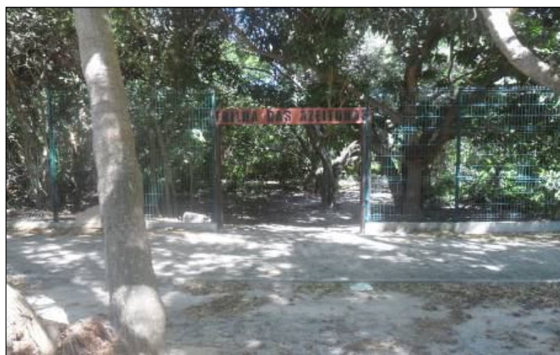
Figura 2: Vista de uma das quatro entradas delimitadas pela cerca no Parque Ecológico do Cocó.

Em 2007, tendo em vista “trazer mais segurança ao Parque” que vinha sendo utilizado como esconderijo de pessoas que cometiam atos infracionais, segundo as autoridades públicas, o Parque foi cercado fazendo com que passasse a não ter mais algumas entradas anteriormente utilizadas. A partir desse momento, elas passam a ser fisicamente demarcadas pela gerência institucional (Figura 2) e reguladas de acordo com horários rígidos de abertura e trancamento dos portões de acesso ao parque.