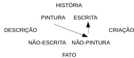
Figura 4: Negação da pintura e asserção da escrita.

Como mostra o esquema acima, tanto a pintura como a escrita estão relacionadas com a história. No entanto, se o sujeito histórico confirma a pintura e nega a escrita, essa escolha significa que ele descreve passivamente a história. Contrariamente, se ele nega a pintura e confirma a escrita, como fez o pintor-protagonista, isso quer dizer que ele tem à sua mão a possibilidade de recriar a história: