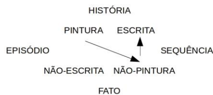
Figura 5: A pintura é paradigmática (episódica); a escrita é sintagmática (sequencial).

Como mostra o esquema acima, tanto a pintura como a escrita estão relacionadas com a história. No entanto, se o sujeito histórico confirma a pintura e nega a escrita, essa escolha significa que ele descreve passivamente a história. Contrariamente, se ele nega a pintura e confirma a escrita, como fez o pintor-protagonista, isso quer dizer que ele tem à sua mão a possibilidade de recriar a história: