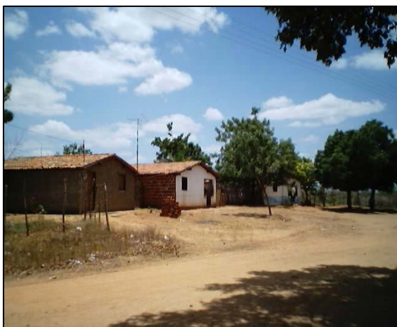
FIGURA 2 - vista parcial da vila. 2003.

Sobre as condições infra-estruturais, o assentamento conta com vinte casas, sendo uma fora da vila, cerca de 5km. Uma das moradias é improvisada, pois se trata de uma casa de farinha, por hora desativada por conta da pequena produção de mandioca. Das 20 casas 17 são de alvenaria e 3 de taipa. Em doze residências existem cisternas de placa (15 mil litros) que serve água para o consumo animal e da família.