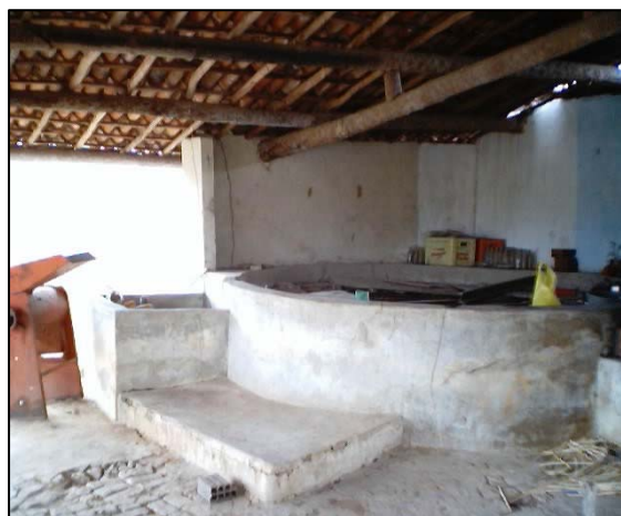
FIGURA 3 - casa de farinha (residência improvisada). 2003.

Todas as residências possuem energia elétrica proveniente da COELCE. Os recursos para a instalação da rede elétrica foram adquiridos através do Projeto São José. O atendimento desse serviço foi importante, pois de certa forma modificou os hábitos culturais, já que quase todas as casas possuem eletrodomésticos, tais como geladeiras, televisores e aparelho de som. A rede elétrica também é importante para o sistema de irrigação existente no local.