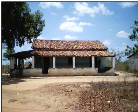
FIGURA 1. Casa mais antiga do assentamento. 2003.