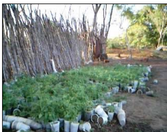
FIGURA 4: preparação de mudas de coentro e cebolinha.

O uso de agrotóxicos nas lavouras foi abandonado desde 1997, portanto, nenhuma constatação foi feita a esse respeito já que a terra e os alimentos estão livres desse mal. As recomendações técnicas de aplicação de adubos têm sido observadas por apenas 5 assentados; 8 afirmaram que tal prática não se aplicam e 4, não observam tais técnicas. Estas observações foram recomendadas por um técnico, durante o período de conversão da agricultura convencional/tradicional pela alternativa, ou seja, no período da introdução da agricultura orgânica no assentamento às lavouras. Parte dos assentados admitem que muitas vezes, o total de produtos incorporados é determinado por suas próprias experiências, não se levando em conta as quantidades determinadas pelos técnicos agrícolas.