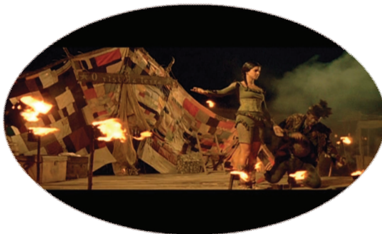
FIGURA 10 – O circo

...a presença dos artistas errantes nas cidades causava uma série de mudanças em seu cotidiano. Entretanto, se havia o receio, um sentimento inegavelmente presente, havia também o deslumbramento, não menos marcante. Seria muito simples pensar na mera coexistência dessas sensações: medo e fascínio. Mas talvez um outro esquema possa expressar mais adequadamente as relações entre esses nômades e os sedentários: temor e maravilhamento se enredavam nessa trama. Temia-se justamente a sensação explosiva e alegre, difícil de ser contida, assim como a incontrolável e prazerosa transformação da cidade. Por outro lado, os perigos daí decorrentes atraíam. O que maravilhava também ao mesmo tempo assustava: as possibilidades abertas pelas alterações advindas do nomadismo, explicitado não apenas na mobilidade geográfica dos artistas, mas, como veremos, no estilo de vida por eles construído.