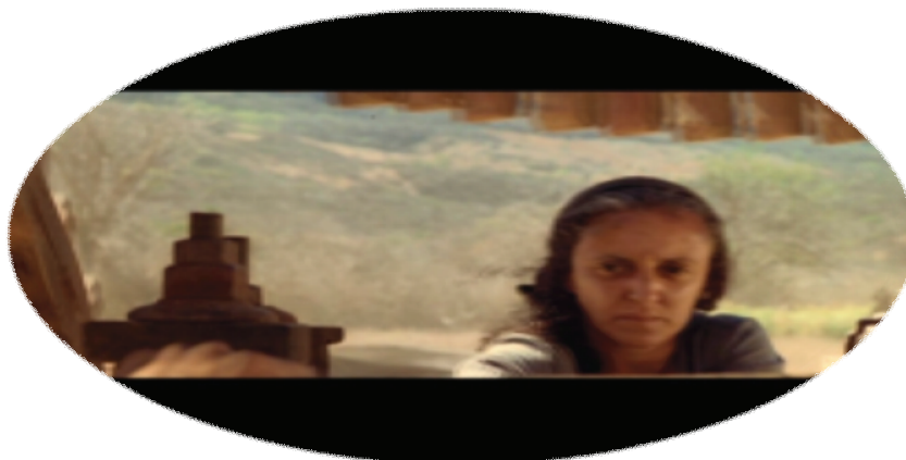
FIGURA 5 – A mãe Breves

As mães, portanto, sabem que “a solidariedade envolve indivíduos prontos para sofrer em benefício de um grupo mais amplo” (DOUGLAS, 2007, p.15), e se posicionam, muitas vezes, nesta condição de sofrimento, logicamente esperando que haja em relação aos demais membros da comunidade a mesma disposição.