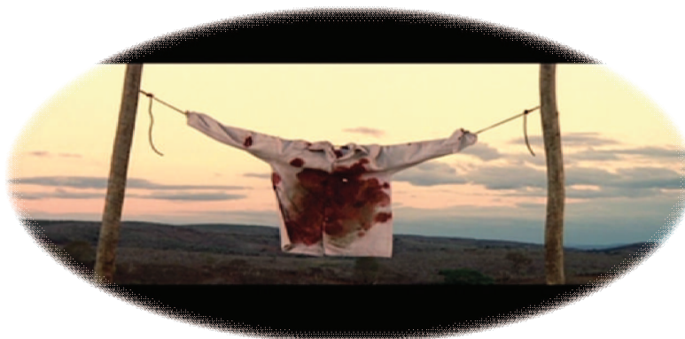
FIGURA 6 – Camisa manchada de sangue

precipitação, no caso em que se mata com o sangue ainda vermelho (descumprindo a trégua), ou descaso, quando se mata muito depois do sangue amarelar (nestas ocasiões, diz-se que não houve preocupação com o morto).