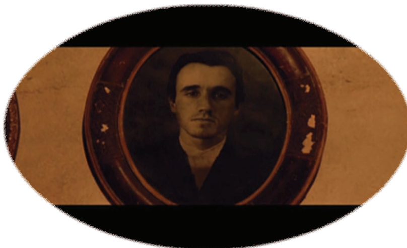
FIGURA 7 – Foto de antepassados mortos

A bolandeira, mais uma vez como metáfora do ciclo de vinganças, não extrai somente a força dos bois. Ela encilha também os homens, pondo-os para rodar tais quais estes animais. Atrrelados a roda da vendeta, os homens são obrigados a traçar uma trajetória circular, a “pegar o risco” dos bois, são exauridos em sua força vital, flertam com a morte. Mas será que a analogia com os bois é totalmente correta? Será que o mecanismo se impõe com tanta força que toda vez que roda, os homens também “rodam, rodam e não saem do lugar” (ROTEIRO apud Butcher & Muller, 2002), como afirma o menino Pacu?