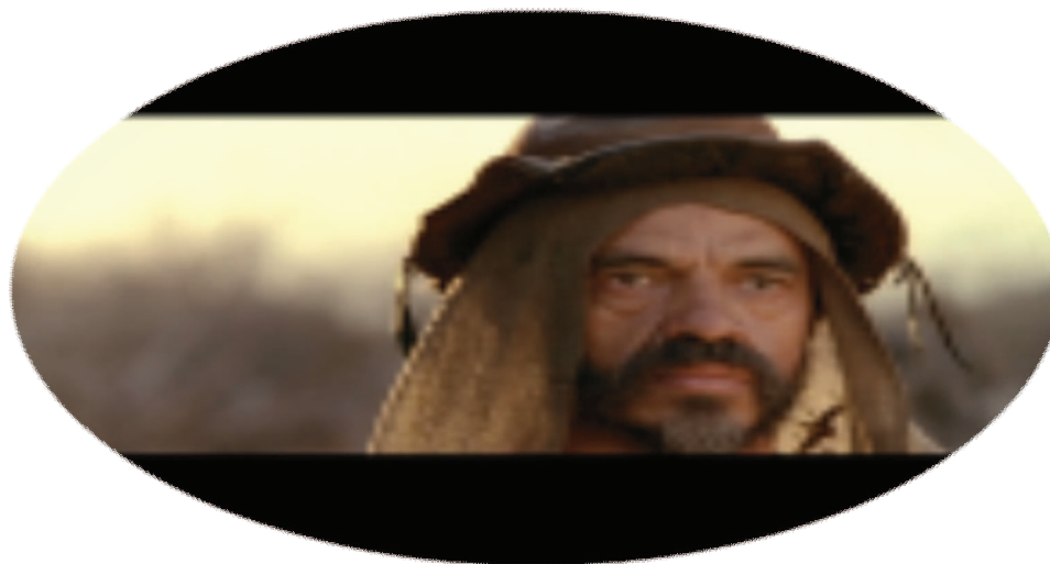
FIGURA 4 – O pai Breves

Na paz, o indivíduo pode “se abandonar” – o “se” refere-se às diversas forças e interesses de sua natureza, os quais podem se deixar desenvolver em várias direções e de forma independente uns dos outros. Em tempos de ataque e defesa, todavia, isto poderia causar uma perda de energia – devido às tendências contrárias de partes de sua natureza – e uma perda de tempo, por causa da necessidade contínua de reuni-los e organizá-los. Consequentemente, todo o indivíduo deve utilizar, como posição interior de conflito e chance de vitória, a forma da concentração.