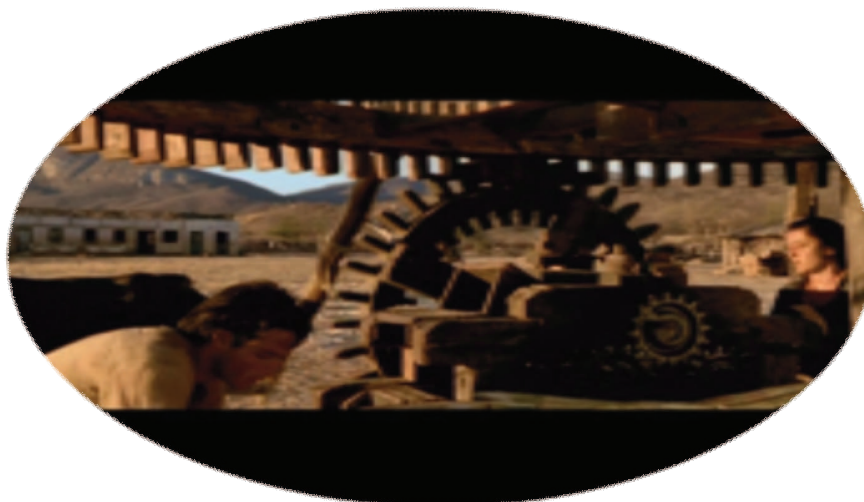
FIGURA 3 – A estrutura interna da bolandeira

Por capital-vida – categoria forjada por Verdier ( apud Fatela, 1989, p.69) – é possível entender: