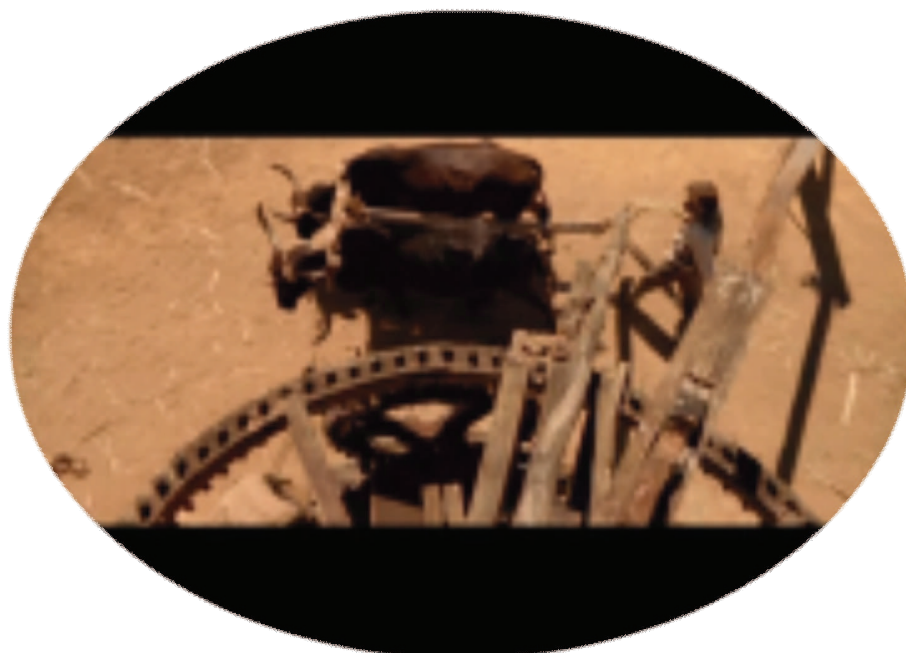
FIGURA 2 – Os bois em trajetória circular

Neste contexto, é importante perceber que uma vez já estabelecida a “intriga”, o ato inaugural do conflito parece ficar em segundo plano: de acordo com os ditames locais, uma ofensa não pode ficar sem resposta. Mesmo tendo se apropriado das terras dos Breves, os Ferreiras não vão deixar de cobrar o sangue do seu ente morto. Assim, “o assassinato de um dos meus parentes, independente de justificação aos olhos do adversário, para mim é o início de uma absoluta dívida sagrada...” (TRICAUD apud ANSPACH, 2002, tradução livre ).