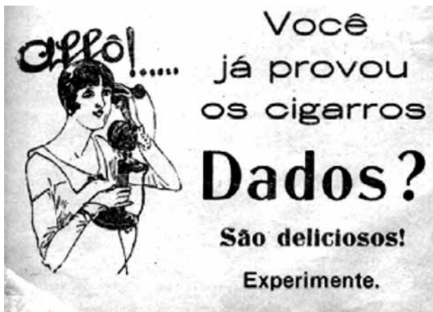
Anúncio 1 - (Ba-ta-clan. Ano 1, edição especial nº 5, 1926.)

Desse material, selecionamos oito anúncios que foram submetidos às categorias já apresentadas para avaliar o uso de procedimentos de manipulação dos afetos (BRETON, 1999). Vejamos o primeiro: