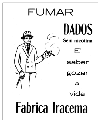
Anúncio 2 (Ba-ta-clan. Ano 1, nº 14, 1926).

Identificamos, nos dezenove números da revista, diversas ocorrências de anúncios do mesmo anunciante, a “Fabrica Iracema”, em que se observa tanto a recorrência de um slogan quanto a de uma imagem, conforme vemos a seguir: