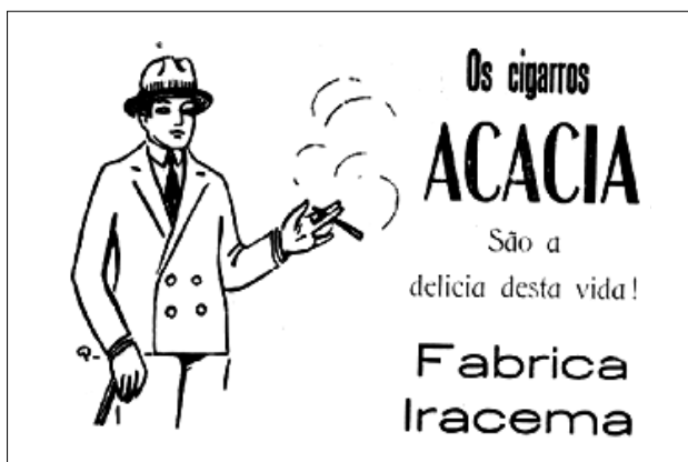
Anúncio 5 - (Ba-ta-clan. Ano 1, nº 13, 03/10/1926).

A repetição nos quatro anúncios (e nos demais do mesmo anunciante) parece, assim, querer reforçar não uma marca específica, mas propriamente o consumo do cigarro produzido pela “Fabrica Iracema”. Importa ao anunciante que seus produtos sejam lembrados e consumidos. O uso dos mesmos elementos ( slogan e imagem) é de fato uma aposta na “fadiga mental” a que Breton se refere, um estado que propicia o interlocutor a submeter sua vontade aos interesses de quem o manipula. Contudo, para evitar que o interlocutor se canse da repetição, cria-se uma variação dos elementos: presença ou ausência de imagem e alternância de slogans . Apesar da mudança, os dois slogans mantêm a mensagem que associa os cigarros anunciados ao prazer de viver.