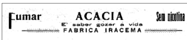
Anúncio 4 - (Ba-ta-clan. Ano 1, nº 1, 08/07/1926).

Fato curioso a se observar, a seguir, é ora o uso do mesmo slogan , ora o uso da mesma imagem para outro produto da “Fabrica Iracema”: os cigarros “Acacia”. Vejamos outros dois anúncios: