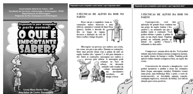
Figura 2 – Diagramação da capa e tópicos do manual educativo.

Ao final, o manual foi composto por 44 páginas e 38 ilustrações. Foram desenvolvidos dois personagens (a mulher e seu acompanhante) exclusivos para o manual, a fim de facilitar a visualização da sequência de acontecimentos. A Figura 2 apresenta a diagramação da capa e de um dos tópicos do manual.