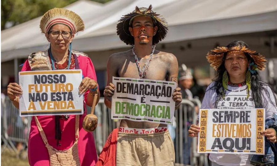
Povos indígenas de diversas regiões do país estão mobilizados em Brasília.

articula, anualmente, no mês de abril, em Brasília, o Acampamento Terra Livre (ATL), considerada a maior assembleia indígena na luta por dar visibilidade às demandas desses povos, especialmente àquelas que procuram subtrair seus direitos constitucionais.