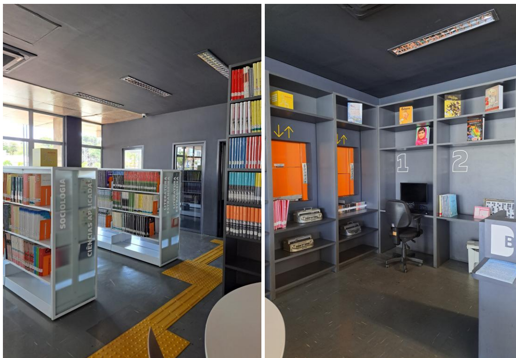
Figura 4 e 5 - Setor Leitura Acessível.