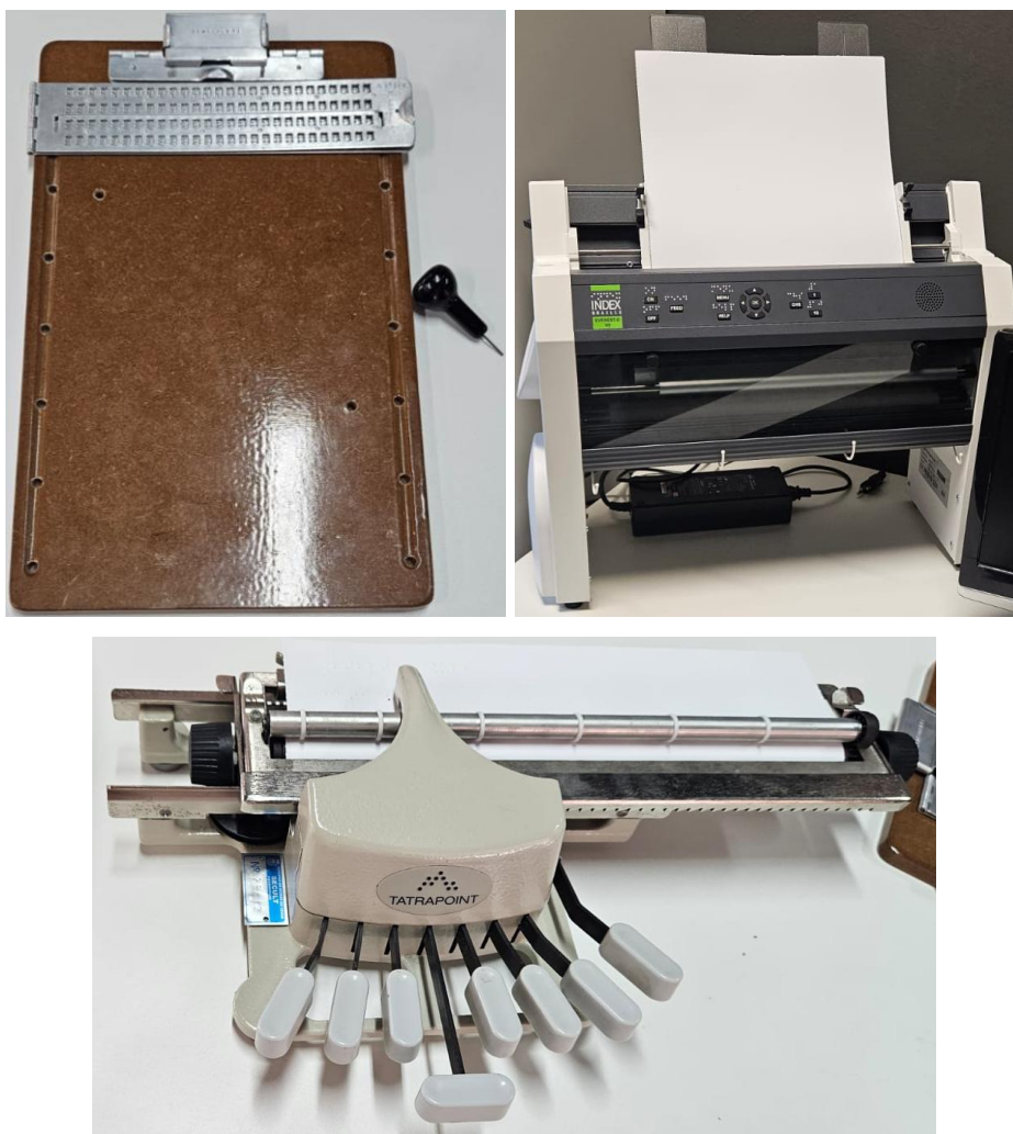
Figuras 1, 2 e 3 – Tecnologia assistiva