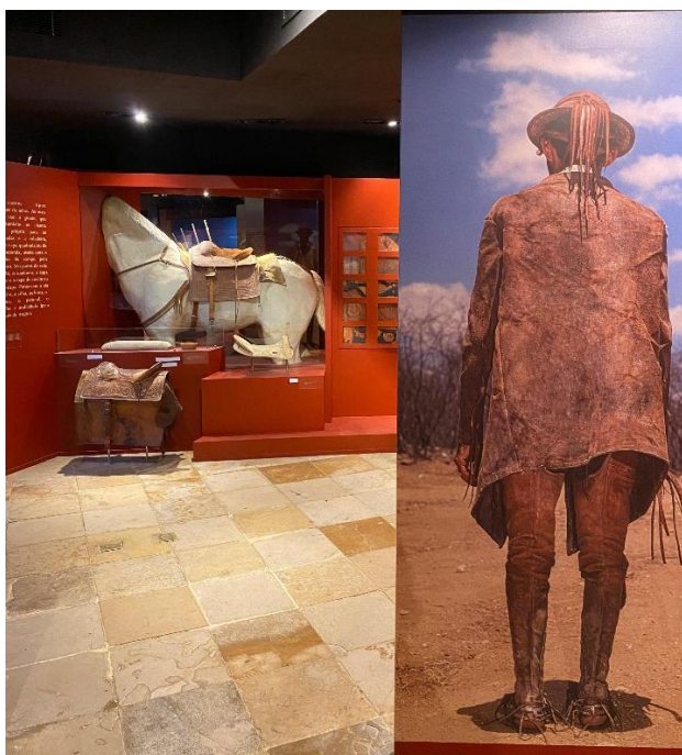
Imagem 1: ambiente

O projeto curatorial de Margarida Hernandez apresenta como premissa a concepção de que os vaqueiros integram o imaginário popular do Ceará e expressa modos próprios de vida, trabalho e relação com o ambiente. Todos esses itens materializam tanto o modo de vida sertaneja e as práticas dos vaqueiros, como também se configuram como expressões simbólicas de memória e identidade que, nesse ambiente assumem então a posição de patrimônio cultural.