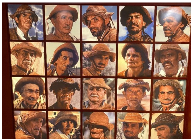
Imagem 6: painel de fotografias

Nesse sentido, a dimensão política da mediação se concretiza quando “os envolvidos na ação mediadora tomam consciência de si e da sua realidade, o que favorece a compreensão da condição social de todos e o potencial de se transformarem em protagonistas sociais.” (JESUS; GOMES, 2021, p. 8)