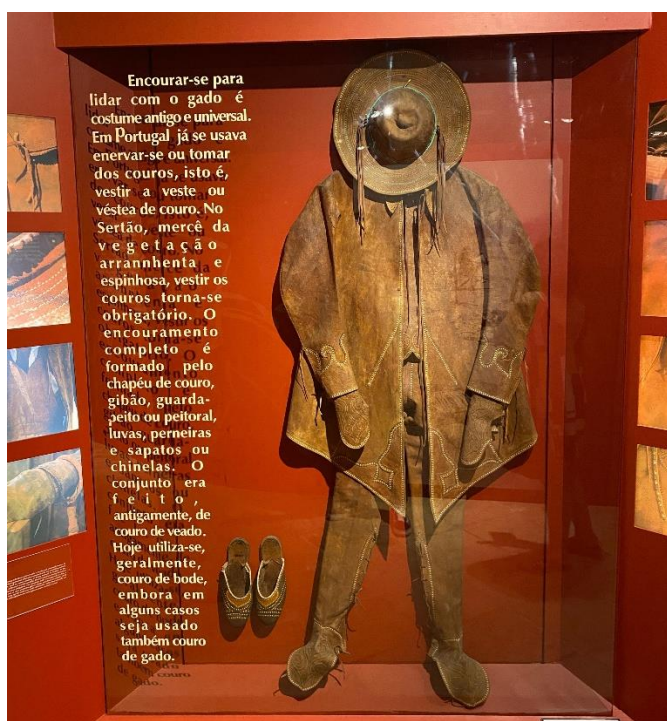
Imagem 5: a roupa do vaqueiro

é preciso acolher o outro e ser receptivo com o diferente, pois as ações de mediação da informação realizadas em favor do livre pensar e do livre expressar exigem abertura para o processo dialético que é convocado no encontro das contradições constitutivas dos fenômenos. (JESUS; GOMES, 2021, p. 7)