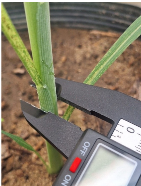
Figura 12 – Avaliação do diâmetro do colmo.

Essas avaliações foram realizadas com o máximo cuidado, visando reduzir erros de mensuração e garantir maior precisão nos dados coletados. Ressalta-se que, nesse estágio inicial, as plantas ainda se encontram em fase de estabelecimento, sendo esperadas respostas menos expressivas