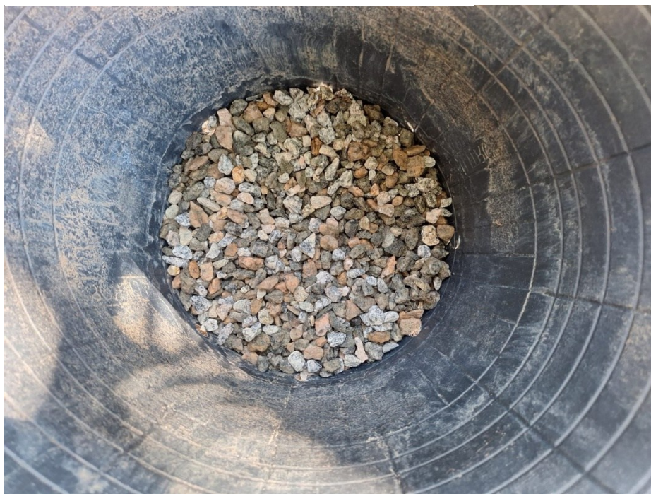
Figura 6 - Colchão de brita no fundo do vaso.

O bioinsumo foi incorporado e homogeneizado ao solo, juntamente com a areia grossa, com o objetivo de promover a distribuição uniforme da matéria orgânica em todo o perfil do vaso.