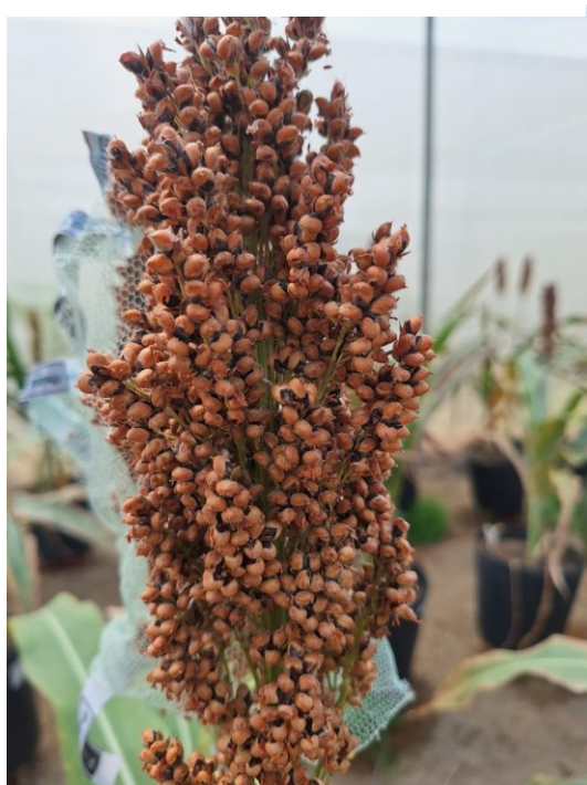
Figura 15- Panícula no ponto ideal de colheita.

A utilização do material permitiu a adequada circulação de ar, evitando o acúmulo de umidade no interior da proteção. Além disso, garantiu maior segurança na obtenção dos dados de produtividade, minimizando perdas.