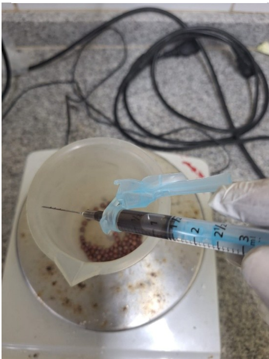
Figura 9 – Inoculação das sementes.