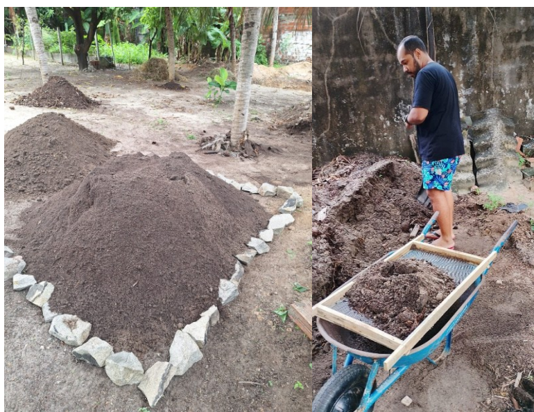
Figura 5 - Bioinsumo oriundo da composteira.

Os vasos de 25 L foram adotados para disponibilizar maior volume para o crescimento das raízes do sorgo.