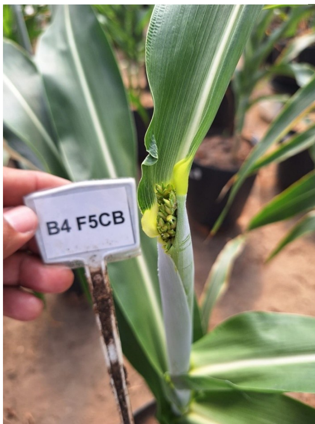
Figura 13 – Surgimento da panícula.

Ao longo do ciclo da cultura, avaliou-se o tempo de surgimento da inflorescência, ou seja, a panícula; esse tempo foi contabilizado a partir da semeadura até a verificação visual da emergência da panícula. Na figura 13 é possível visualizar a panícula do sorgo em estágio inicial.