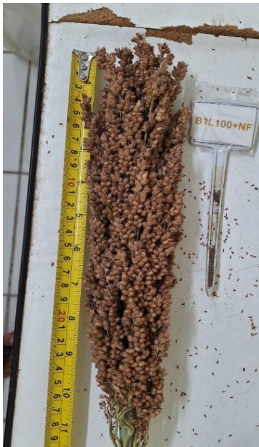
Figura 17 - Avaliação do comprimento das panículas.