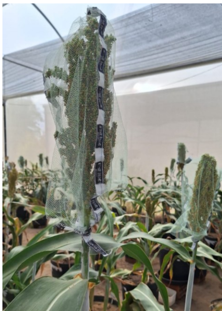
Figura 14 - Tecido telado para proteção da panícula.