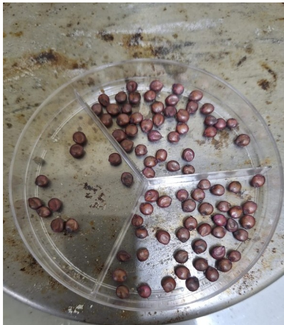
Figura 7– Sementes de sorgo selecionadas.