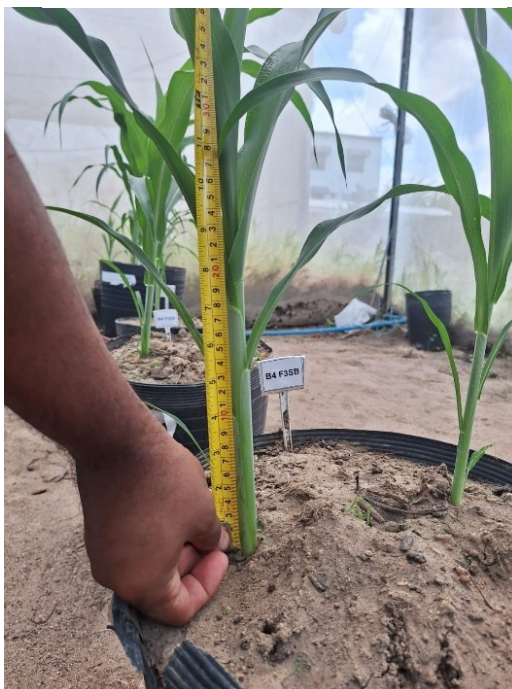
Figura 11– Avaliação da altura.