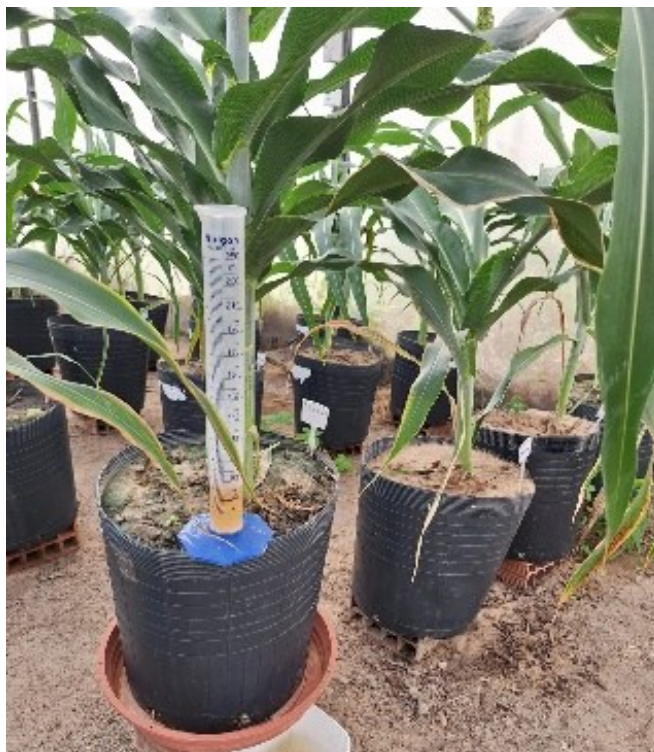
Figura 10 – Volume coletado na drenagem.

sobre o desenvolvimento e a produtividade da cultura. Na Figura 10, observa-se o volume de água coletado durante o processo de drenagem dos lisímetros.