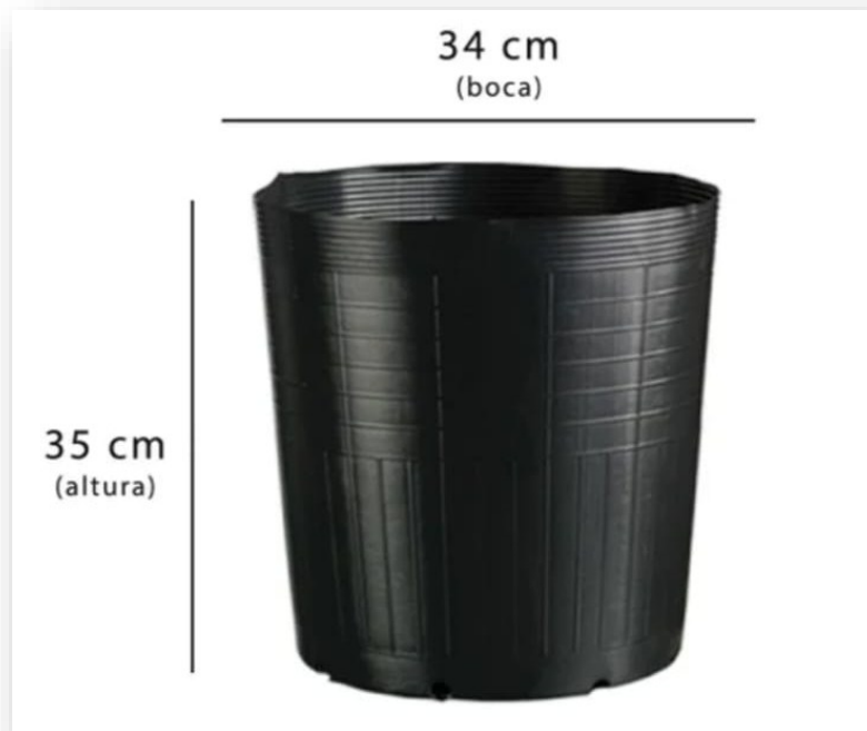
Figura 4 - Vasos utilizados no experimento.