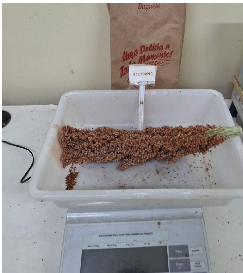
Figura 16 – Avaliação da massa das Panículas.

Após a colheita do sorgo, a massa total das panículas foi medida em uma balança de precisão, modelo OHAUS Adventure AR 3130, com capacidade máxima de 3100 g e mínima de 0,5 g (Figura 16).