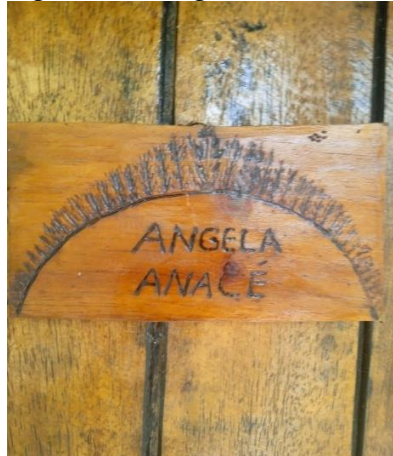
Figura 1 - Pirografia – Arte desenvolvida por Dona Angela