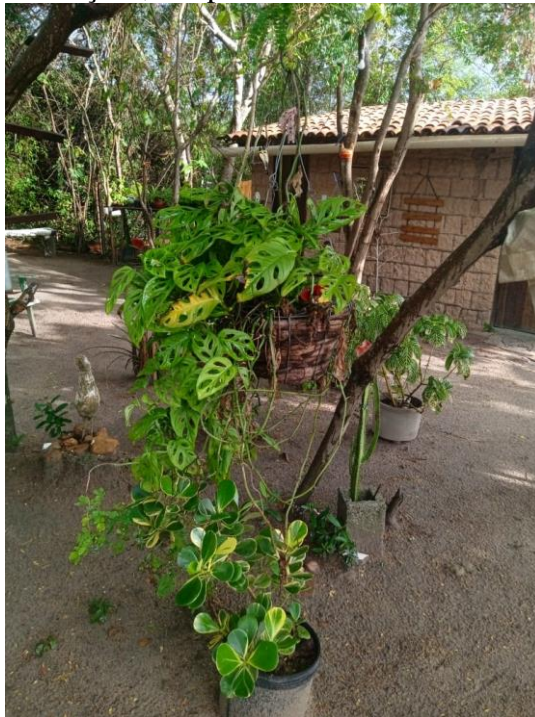
Figura 11 - Espaço Cultural da Dona Angela - Casa aberta para formações, terapias e trocas de saberes

Há os cheiros trazidos pelo vento e nos sons de pequenos animais, pássaros e árvores que rangem seus galhos e liberam cheiros captados por nossos sentidos, mesmo de forma inconsciente, algo muito sutil que se torna uma medicina tradicional acontece, contribuindo para o melhoramento da pessoa, é um tratamento natural trabalhando várias dimensões da pessoa, mexendo com os sentidos, ressignificando as dores e sofrimentos. Pois, no jardim de Dona Angela, a terapia se estende pela casa toda, já que foi construída pensada em todas essas dinâmicas pedagógicas através das oficinas, ela ao se envolver com as pessoas divide sua intimidade ao abrir sua casa.