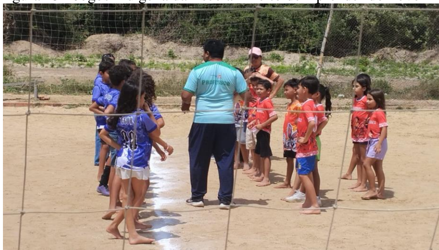
Figura 25 - Jogos Indígena da Escola Direito de Aprender do Povo Anacé

É uma grande reflexão, pensar nas características brancas existindo nos corpos físicos indígenas, quando ao surgir tais traços na estrutura indígena fica evidente os processos de experimentações de relações abusivas e de violências vividas pelos indígenas na colonização, o quanto foram desumanizados. Pensando no corpo como território, a narrativa acima cria um mapa, localizando a vida através das marcas permanentes que se apresentam como extensões do corpo. Foi profundo o trauma que faltou com o respeito e a dignidade do corpo indígena. Inviolável por sua divindade, o corpo é um lugar de santidade porque ele também é natureza.