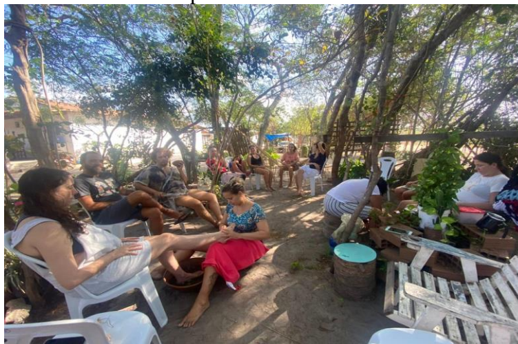
Figura 12 - Execução da Cosmociência, do Etnoconhecimento e da Etnoaula Etnoaula/oficina de Espiritualidade

pedaços da visão ancestral e de uma forma de vida enraizado na troca de saberes por considerar qualquer outra forma de vida. As etnoaulas trazem profundidade e intensidade no combate a colonização dos saberes e dos sentidos porque se fundamenta na etnogênese Anacé, construída na luta e na resistência. Esses processos pela sobrevivência, ao existir, garante possibilidades de experiências que formulam e moldam as pessoas nas dimensões da ética, da estética e da política. A razão maior é a confirmação que após um processo de luta pela existência, o ser humano se enche de uma compreensão ancestral, onde a dimensão da consciência está na experiência, pois, o fenômeno aciona seus dispositivos de sobrevivência, deixando sensíveis seus receptores quanto ao invisível.