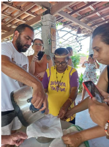
Figura 14 - Etnoaula/Oficina de Medicina Tradicional