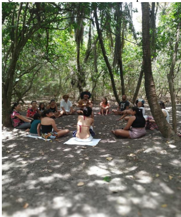
Figura 18 - Etnoaula/Oficina de Espiritualidade

Sobre a espiritualidade, ela diz que: “A espiritualidade está em todos os lugares. Assim como os temas geradores estão em um, um está em todos. É a forma de acreditar nos nossos antepassados. Que a gente sabe que mesmo eles tendo tombado, passado dessa vida para a outra, eles continuam sempre com a gente em todos os aspectos, os lugares e nas lutas. A gente os traz como um ser de luz que iluminam nossos caminhos, onde quer que estejam. Nós, seres humanos, temos o corpo físico e o espírito, quando o espírito se desliga do corpo, a matéria-corpo, a gente planta, porque a gente veio da terra e devolve para a terra o corpo, por isso, que a gente chama de Mãe-Terra.