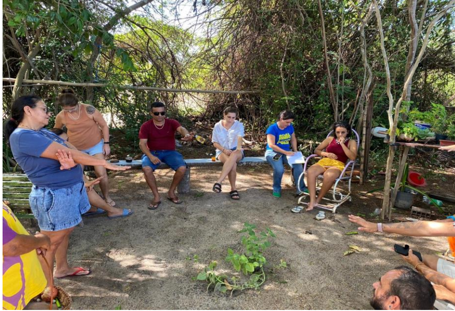
Figura 2 - Etnoaula/oficina de Medicina Tradicional