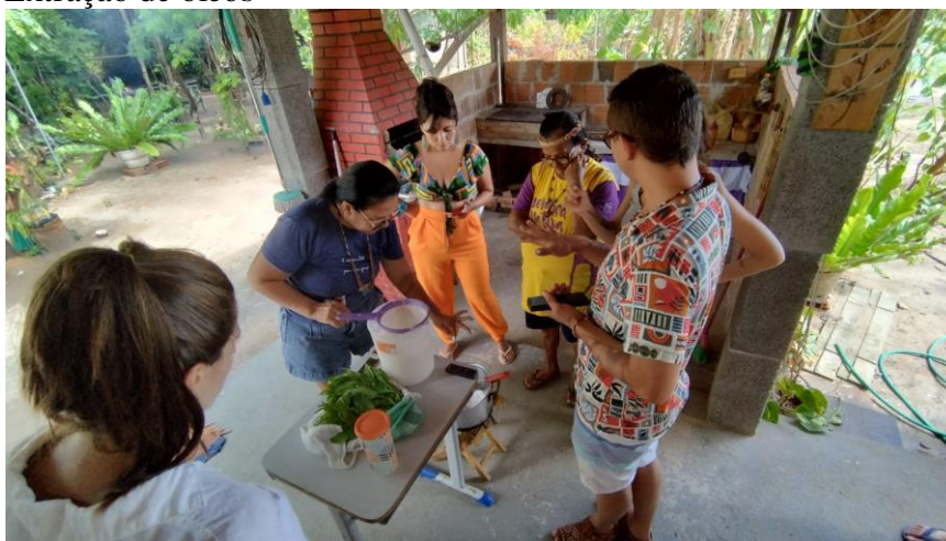
Figura 22 - Etnoaula/Oficina de Medicina Tradicional Extração de óleos

Outro ponto importante é a Medicina Tradicional que parte da observação à natureza, da relação das plantas, os animais e os elementos da natureza. Na observação dava para saber qual planta poderia ser usada e para qual necessidade o bicho usava. Foi assim, através dessa imersão na mata foi possível que as pessoas se orientassem por meio de seus segredos ancestrais, através do manuseio das plantas, extraíndo seus saberes e ensinamentos, aos quais chamamos de tradicionais.