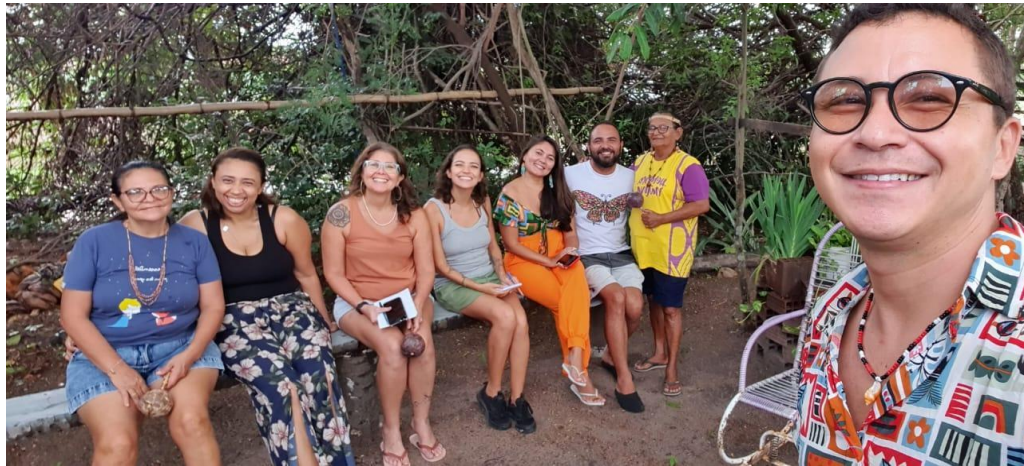
Figura 3 - Etnoaula/oficina de Medicina Tradicional