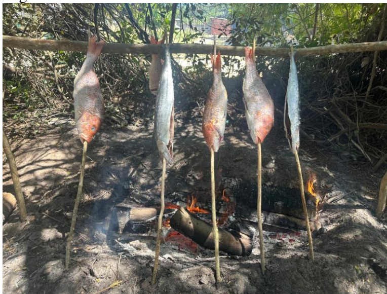
Figura 20 - Festa na Aldeia