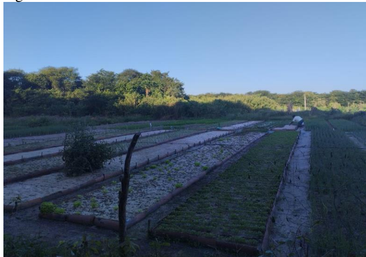
Figura 5 - Horta Comunitária da Reserva

Foi com essas temáticas que iniciamos os trabalhos de campo e executada a primeira oficina na Reserva Taba dos Anacé. Tudo na cultura indígena começa pela espiritualidade, referencial adotado para iniciar qualquer atividade que os indígenas realizem. Pois, a espiritualidade, perpassa pelas dinâmicas sociais que constroem o cotidiano da aldeia, por meio da escola, dos domicílios, da horta comunitária, da casa de farinha, dos eventos e rituais religiosos e culturais onde é compartilhado o jeito Anacé de estar no mundo.