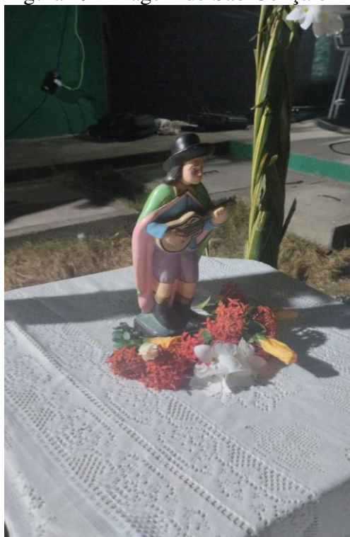
Figura 19 -Imagem de São Gonçalo

Quanto a espiritualidade, não poderíamos deixar de falar da Dança de São Gonçalo, arte tão marcante no meio dos Anacé. Através da dança eles manifestam e acessam seu supremo e o que é superior, agradecem por suas realizações e pedem proteção ao Santo. Nesse momento a divindade do Santo se encontra com a divindade dos dançantes, dos tocadores, dos cantadores e dos espectadores, onde nessa grande comunhão são liberadas emoções de gratidão e curas realizadas naquela atmosfera cheia de alegria e felicidade, ao dançarem no meio do terreiro ao som dos tocadores e cantadores.