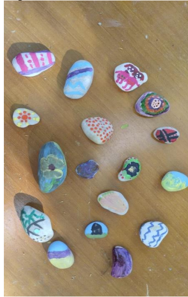
Figura 9 - Produto da etnoaula/oficina de Espiritualidade