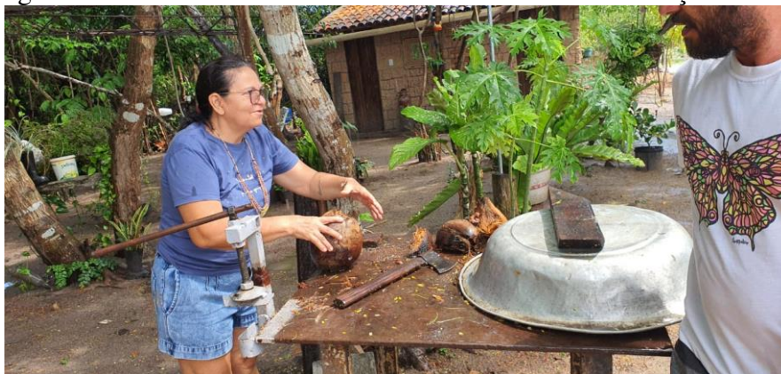
Figura 23 - Etnoaula/Oficina de Medicina Tradicional Extração de óleo de coco