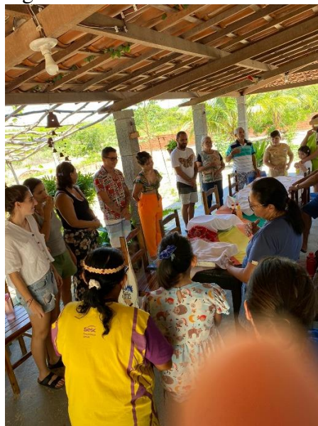
Figura 7 - Etnoaula/oficina de Cultura Alimentar

Cultura Alimentar foi a segunda oficina realizada na Reserva Taba dos Anacé. Na merenda da manhã, somos recebidos com alimentos orgânicos pensados a partir da soberania alimentar: tapioca, beiju, batata doce, suco e chás de plantas medicinais retiradas da natureza local. Para os povos indígenas, as refeições são “medicinas” que preparam nosso corpo para executar as tarefas do dia, sendo uma fonte de energia. Essa dieta potencializa uma alimentação sem veneno, ou seja, uma alimentação consciente, sem agrotóxicos. Como posicionamento político, consciente e crítico, é ressaltado o processo produtivo dos alimentos servidos. Saber de sua produção e de sua distribuição, combate à alienação do trabalhador rural. Neste “tema gerador” são apresentadas técnicas milenares de produção e conservação de alimentos, ao mesmo tempo, vamos identificando usos e costumes do nosso dia a dia, herança dos nossos antepassados indígenas e que não sabíamos da origem de hábitos aos quais construímos nosso cotidiano.