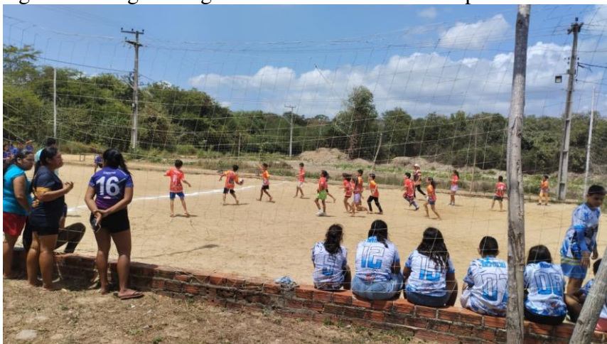
Figura 24 - Jogos Indígenas na Escola Direito de Aprender do Povo Anacé