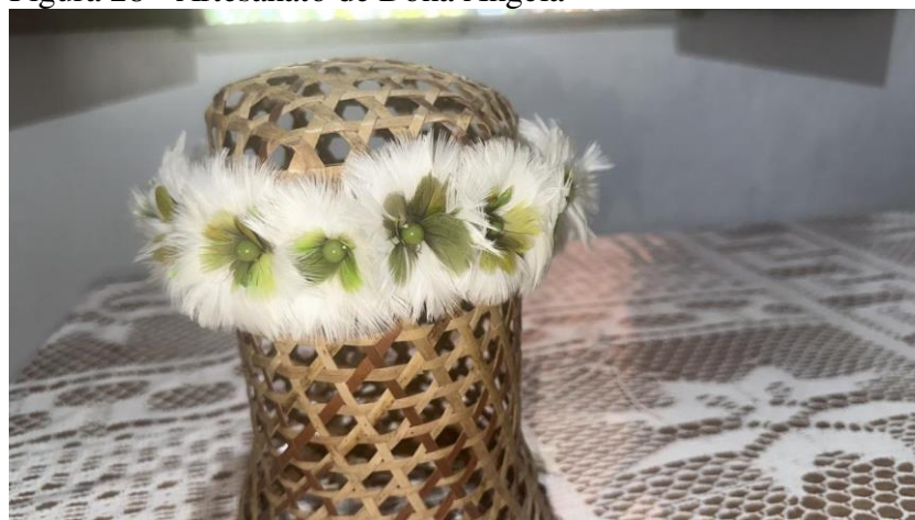
Figura 28 - Artesanato de Dona Angela

Porque as vezes tem material que não se consegue juntar para fazer a arte, você precisa sentir também que a combinação de um para outro tem diferença muito grande. É preciso saber da essência para fazer artesanato, ao criar o artesanato e começa a fazer e antes de terminar você se desgosta. E desfaz tudo, faz outro e não presta, desfaz de novo e continua não prestando. Então, vejo essa espiritualidade dentro do artesanato, porque naquele dia não é para sair nada.