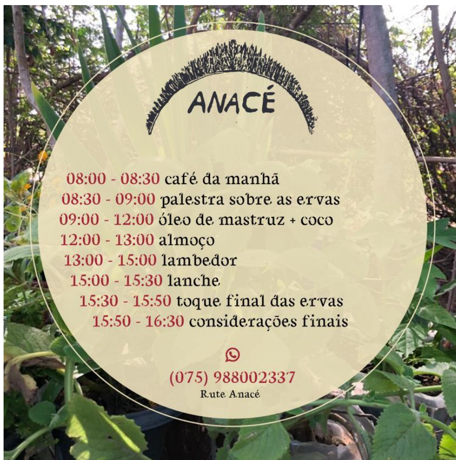
Figura 16 - Estética Anacé nos cartazes

Abaixo segue um dos roteiros, especificamente sobre medicina tradicional. Ele nos mostra a impressão artística Anacé por meio da estética apresentada na divulgação da etnoaula, no preparo das ervas, óleos e lambedores. Contribuindo com a estética Anacé nos cartazes, por suas linhas, traçados e cores. Esses ensinamentos passam a ser tratados como pontos não só de difusão da ancestralidade e dos saberes, mas marca um ponto de resistência Anacé.