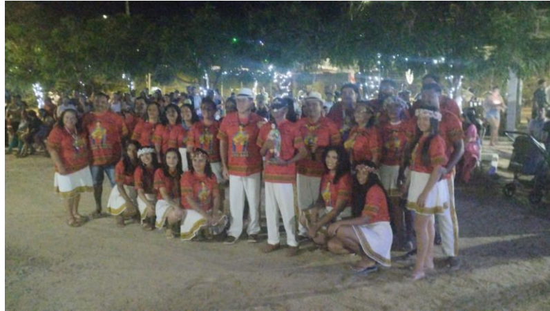
Figura 10 - Brincantes da Dança de São Gonçalo

chegou com mais força, lugares divinos porque são nesses espaços que o povo Anacé se junta para realizar suas atividades coletivas, sabendo que o sagrado habita no coletivo. Sendo de uso e organização do espírito da floresta reproduz na vida o que acontece na mata, pensemos na aranha quando tece seus fios, poderiam ser fios da vida que conectam as pessoas, trazendo comunhão e importância a conexão e a coletividade entre o povo.