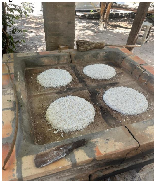
Figura 21 - Etnoaula/Oficina de Cultura Alimentar

A galinha caipira é mais gostosa que a galinha de granja. A gente ainda tem a forma de criar as galinhas nos terreiros para se alimentar do ovo e das próprias galinhas, a mandioca que a gente faz a farinha, a macaxeira, e tem a batata doce. As hortas produtivas, as frutas são plantadas nos próprios quintais da nossa casa. Todas elas contribuem para que a gente tenha uma alimentação saudável. Sabendo que a cultura é móvel, ela vai se moldando e se modificando a cada tempo e a nova era e com essas novas descobertas a gente vai trazendo também o bem viver na própria multimistura que a gente reaproveita as cascas das frutas, as raízes, as sementes, as flores, as folhas por serem comestíveis e tudo passa a ser um nutriente natural que faz bem a nossa própria saúde.