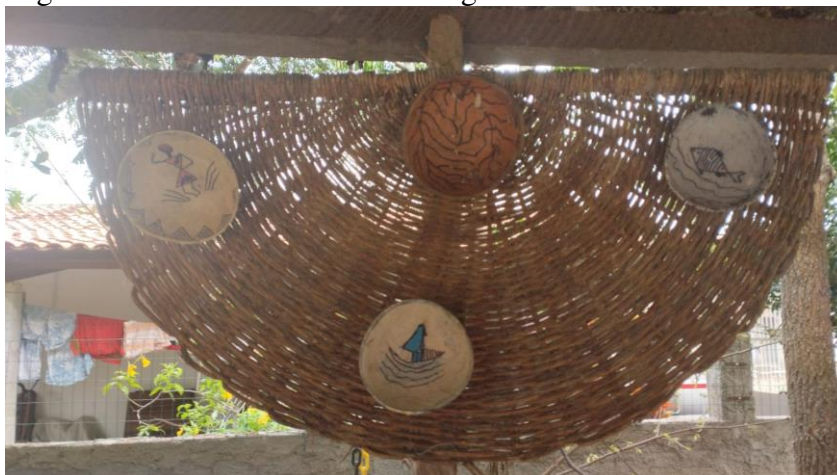
Figura 27 - Artesanato de Dona Angela