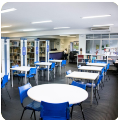
Figura 1 - Biblioteca de Pós-graduação em Economia Professor Ari de Sá Cavalcante