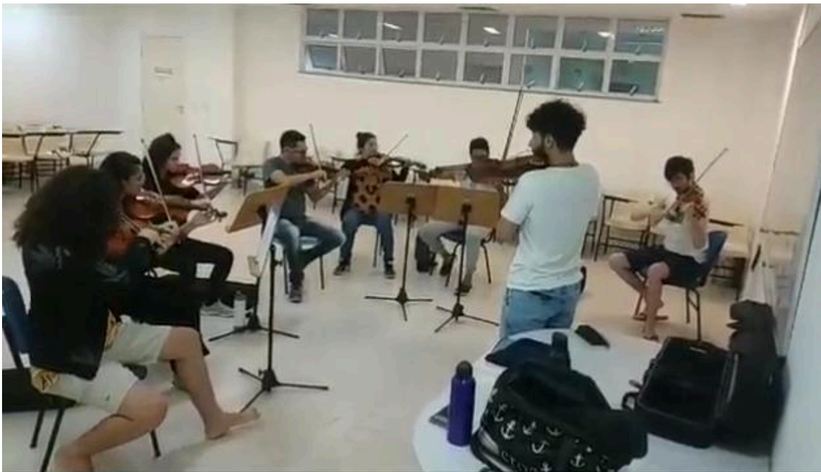
Imagem 1: Aula ministrada pelo autor, turma de violinos iniciante, agosto de 2023.

rostos fixos que requisitavam sempre essas aulas, em grande maioria das vezes alunos de cordas agudas.