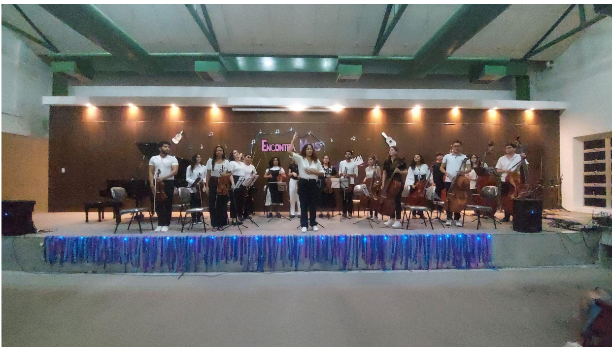
Imagem 3 - Apresentação Encontramus 2024.2