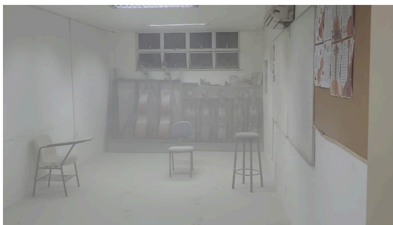
Imagem 4: Registro após o princípio de incêndio ocorrido na sala de cordas friccionadas no dia 06 de Junho de 2024.

Um dos obstáculos mais recorrentes ao longo do projeto esteve relacionado à climatização das salas. Os sistemas de refrigeração apresentavam falhas frequentes, incluindo períodos prolongados sem funcionamento. Esses problemas, apesar de comunicados oficialmente à administração da instituição, não receberam solução definitiva. A ausência de climatização adequada prejudicou o conforto e a permanência dos participantes durante as aulas, além de impactar os instrumentos musicais, especialmente os de madeira, que são sensíveis às variações térmicas. Em regiões de clima quente, como a cidade de Sobral, tais condições podem comprometer a afinação, a resposta sonora e a conservação dos instrumentos, interferindo no rendimento dos alunos e no desenvolvimento das atividades pedagógicas.