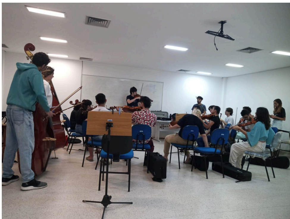
Imagem 2 - Registro de ensaio-aula da turma heterogênea, Agosto de 2023

Por meio das aulas de monitoria, foi possível promover o desenvolvimento progressivo do aluno, de modo que a execução do referido solo foi sendo aprimorada ao longo dos encontros regulares e das monitorias extras. Observou-se, nesse processo, uma melhora significativa tanto na sonoridade quanto na leitura musical do extensionista. De maneira geral, o auxílio prestado caracterizou-se por intervenções simples, porém eficazes, contribuindo de forma relevante para o aprendizado e para o fortalecimento da confiança do aluno.