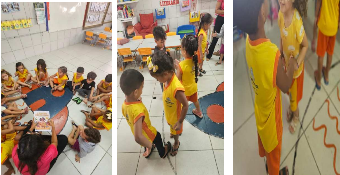
Figura 5 - Registro do diário de campo na data de 23/10/2025