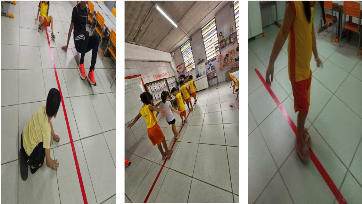
Figura 6 - Registro do diário de campo na data de 23/10/2025

quando propôs a atividade com fita vermelha no chão: “ Agora vamos andar de costas... de lado... ajoelhados! ”. As crianças reagiam com entusiasmo, riam, inventavam novos modos de se mover.