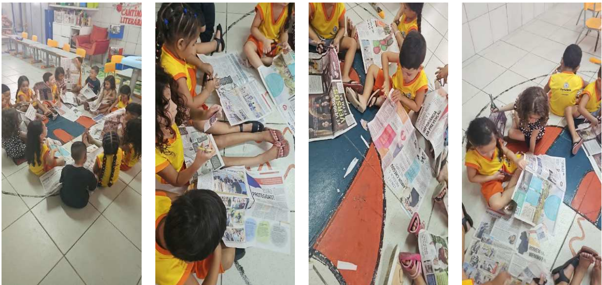
Figura 7 - Registro do diário de campo na data de 04/11/2025