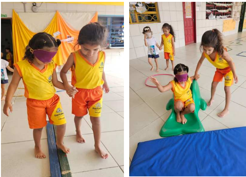
Figura 2 - Registro do diário de campo na data de 18/09/2025

Nas semanas seguintes, as práticas foram ressignificadas pela presença de temas transversais. Durante a Semana da Inclusão, observada em 18/09/2025, o professor transformou o circuito em uma vivência empática: crianças vendadas eram guiadas por colegas, experimentando a sensação da ausência de visão. Antes da atividade, uma conversa coletiva antecedeu o momento prático, um espaço de reflexão sobre respeito e solidariedade.