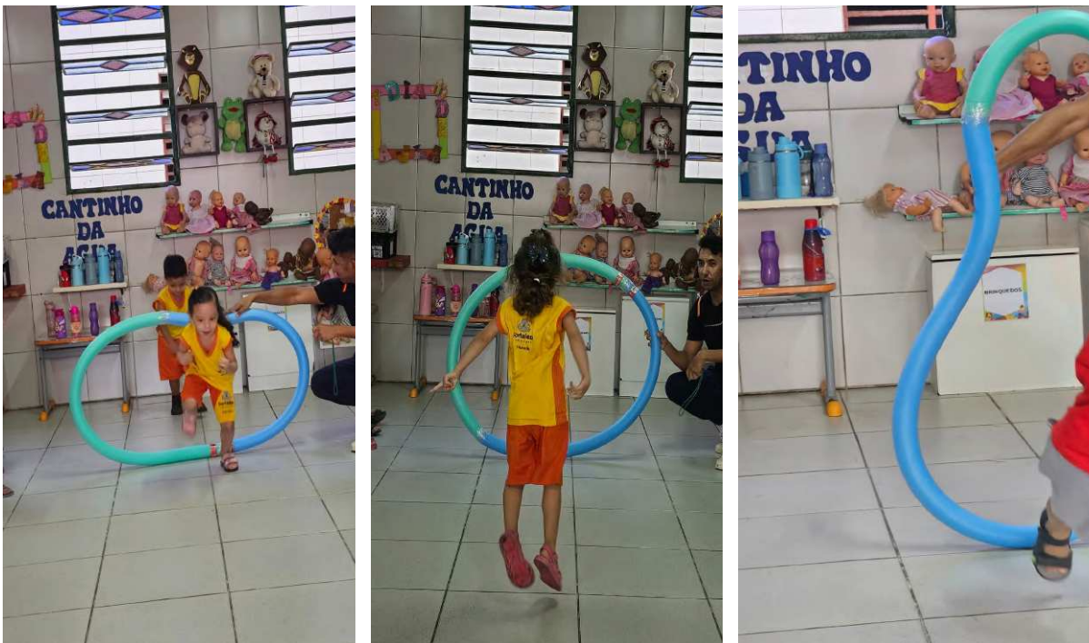
Figura 4 - Registro do diário de campo na data de 16/10/2025

Em outra ocasião, durante a Semana da Criança (16/10/2025), o professor trabalhou com espaguete de piscina, conduzindo as crianças a reconhecerem noções espaciais e formas geométricas: “O que é isso?” — questionou ele. As respostas (“Uma roda!”, “Um círculo!”) revelaram o diálogo ativo entre movimento e linguagem. A atividade evoluiu em graus de dificuldade, exigindo adaptação e controle corporal.