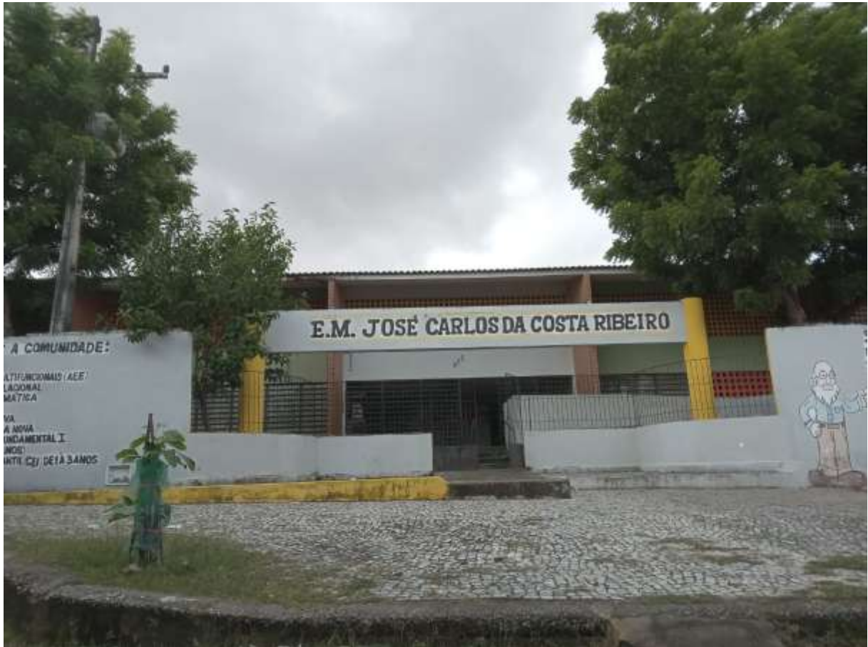
Figura 1 - Escola Municipal José Carlos da Costa Ribeiro, em Fortaleza/CE

atende predominantemente estudantes oriundos da comunidade local. A coleta de dados foi realizada no período de agosto a outubro de 2025.