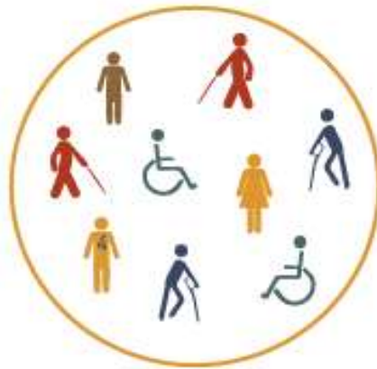
Figura 5 – A inclusão

A inclusão precisa ser vista como uma responsabilidade compartilhada, na qual a sociedade se reconfigura continuamente para acolher a diversidade humana em todas as suas formas, e promover igualdade de oportunidades e o respeito a todos, conforme Figura 5 a seguir.