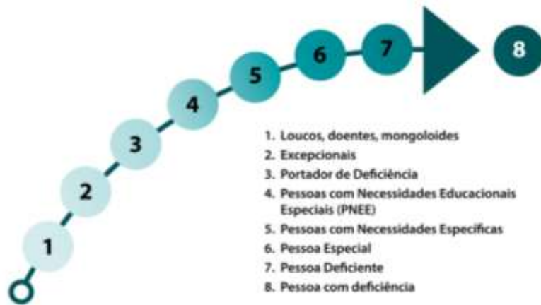
Figura 1 – Evolução histórica das terminologias utilizadas para se referir às pessoas com deficiência