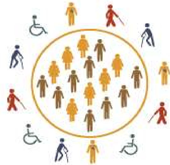
Figura 2 – A exclusão

da dignidade e do potencial pleno de todas as pessoas.