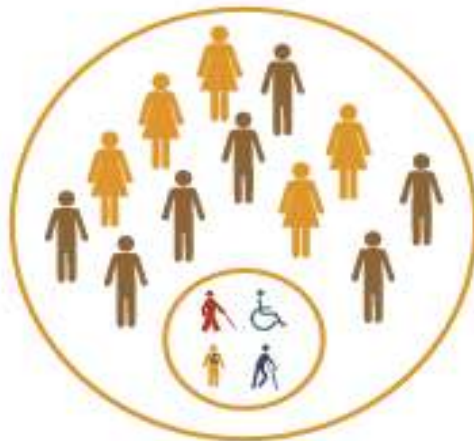
Figura 4 – A integração

A reprodução de barreiras físicas, pedagógicas e atitudinais evidencia que a verdadeira inclusão só será alcançada quando a sociedade deixar de impor condições para o reconhecimento pleno das pessoas com deficiência como sujeitos de direitos e potencialidades, valorizando suas singularidades sem exigir conformidade a um padrão de comportamento e produtividade imposto pela sociedade capitalista.