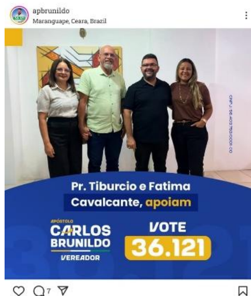
Figura 6 – Apoio intereclesiástico.