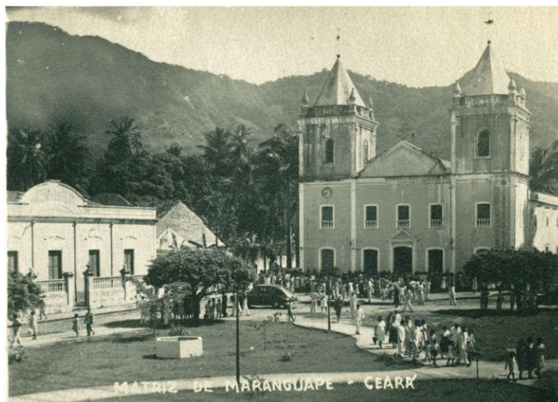
Figura 1 – Praça da igreja Matriz de Maranguape.