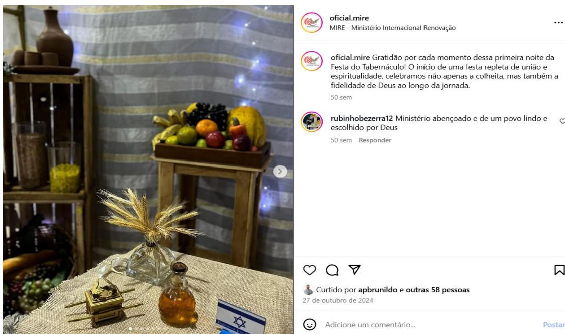
Figura 5 – Festa do tabernáculo.