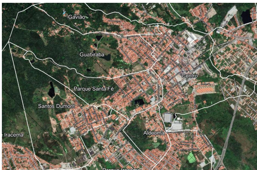
Figura 3 – Bairros onde os pastores lideram.