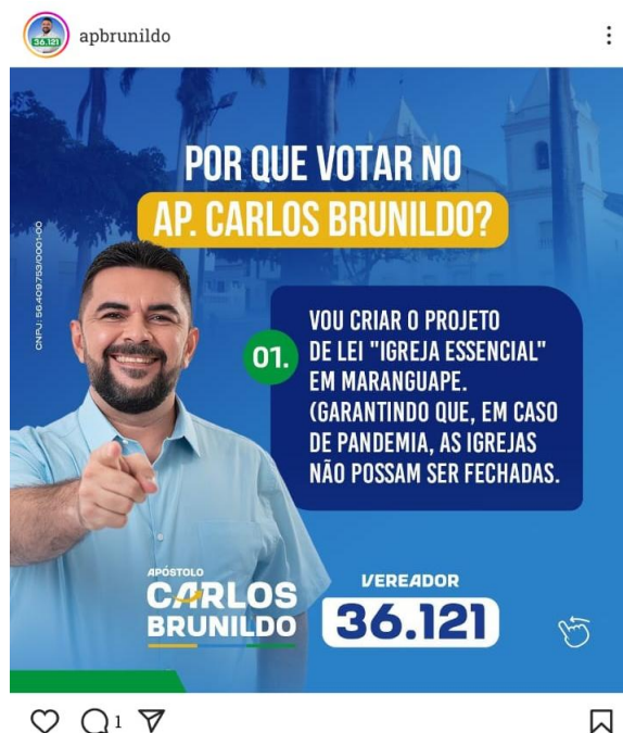
Figura 4 – Projeto “igreja essencial”.