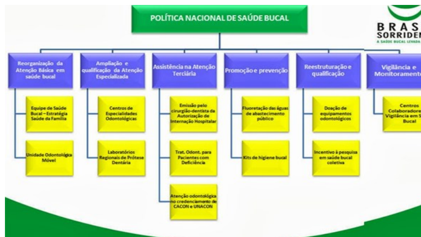
Figura 2 - Eixos centrais da Política Nacional de Saúde Bucal

A Figura 2 apresenta os eixos centrais da PNSB e os elementos da rede, distribuídos em: reorganização da atenção básica em saúde bucal; ampliação e qualificação da atenção especializada; assistência na atenção terciária; promoção e prevenção; reestruturação e qualificação; vigilância e monitoramento.