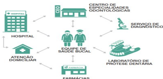
Figura 3 - Rede de Atenção à Saúde Bucal (RASb)

Na Figura 3, é possível observar os elementos da Rede de Atenção à Saúde Bucal (RASb), constituídos por: Centro de Especialidades Odontológicas; Serviços de Diagnóstico; Laboratório de Prótese Dentária; Farmácias; Atenção Domiciliar; Hospital. Conforme demonstrado, a RASb se estrutura em torno de diferentes pontos de atenção, cada um com especificidades e responsabilidades.