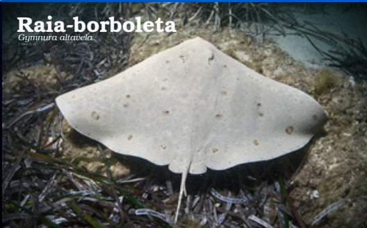
Raia-borboleta Gymnura altavela