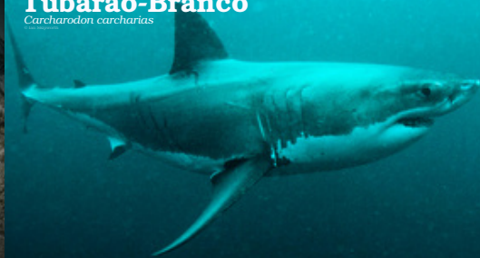
Tubarão-Branco Carcharodon carcharias