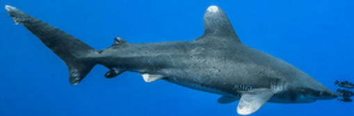
Tubarão-galha-branca Carcharhinus longimanus