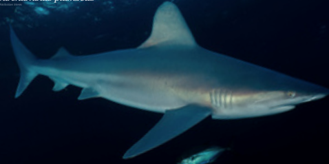
Tubarão-galhudo Carcharhinus plumbeus