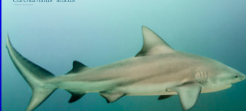
Cabeça-chata Carcharhinus leucas