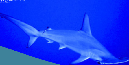
Tubarão-Martelo-Recortado Sphyrna lewini