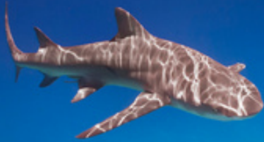
Cação-limão Negaprion brevirostris