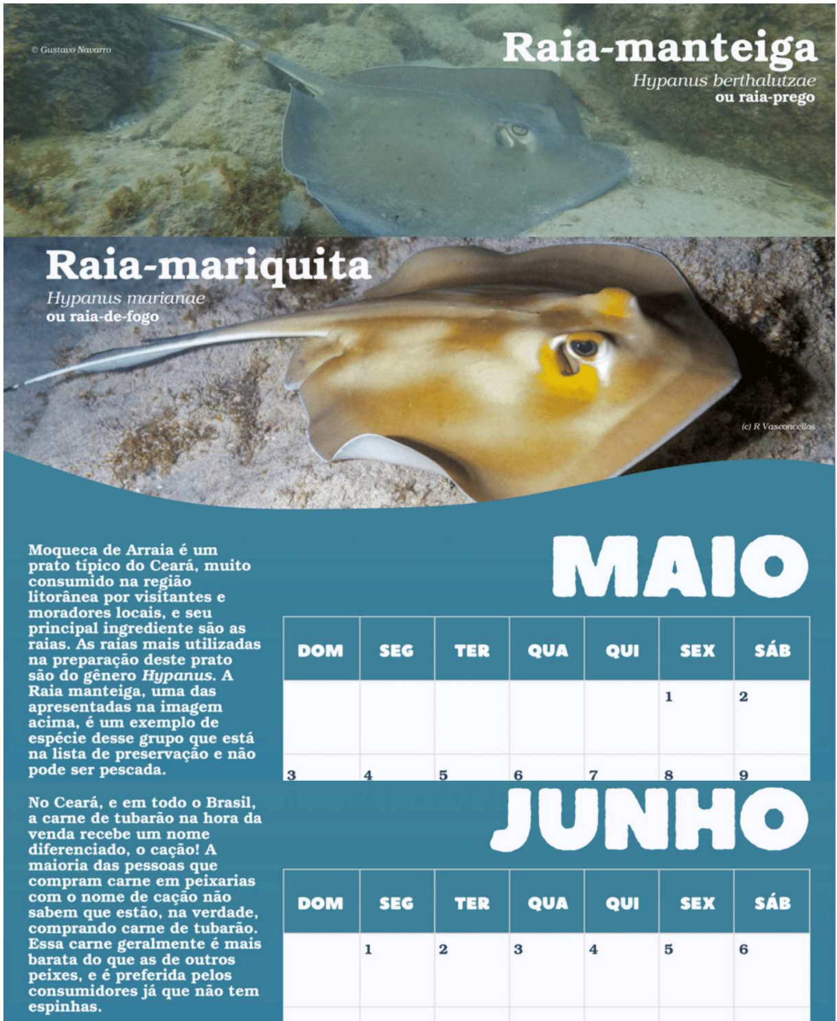
Figura 5 – Textos do calendário que abordam como estes animais estão inseridos na cultura através da linguagem e alimentação cearense.