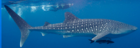
Tubarão-Baleia Rhincodon typus