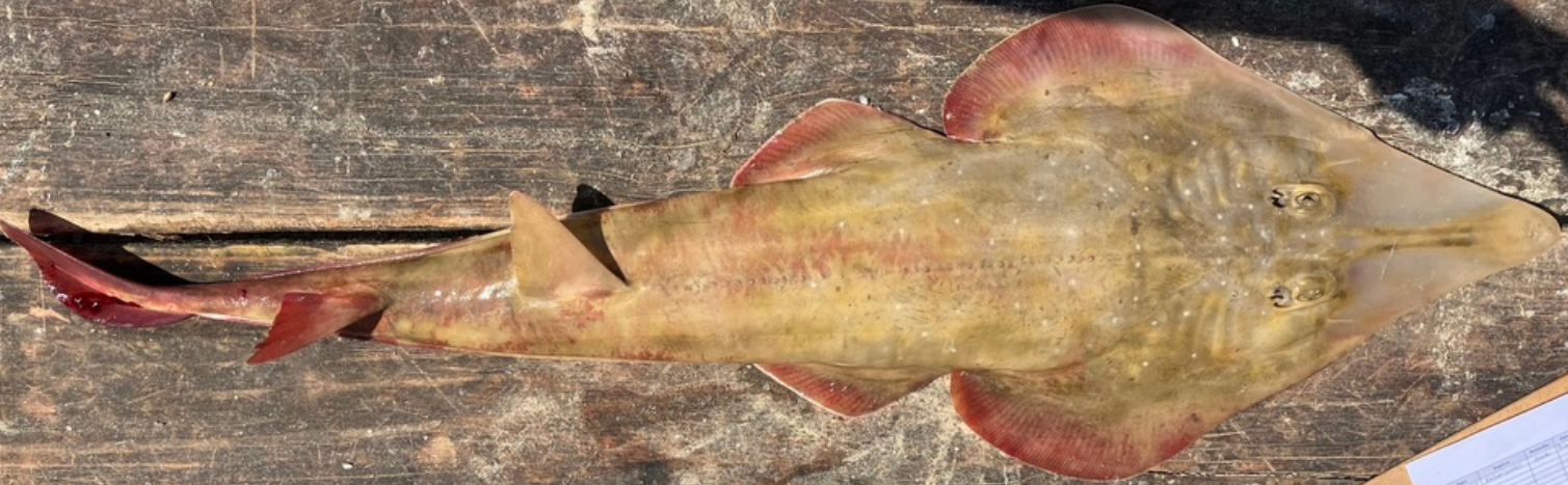
raia-viola, ou viola

A Cação-viola, a raia da imagem acima, está classificada como Vulnerável pela União Internacional para Conservação da Natureza - IUCN. Este tipo de classificação indica que “quando as melhores evidências disponíveis indicam que se atingiu qualquer um dos critérios quantitativos para Vulnerável, e por isso considera-se que a espécie está enfrentando risco alto de extinção na natureza”