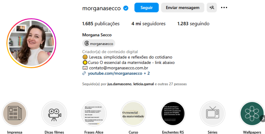
Figura 5 - Perfil de Morgana Secco, no qual é possível ver a indicação do curso “O essencial a Maternidade”