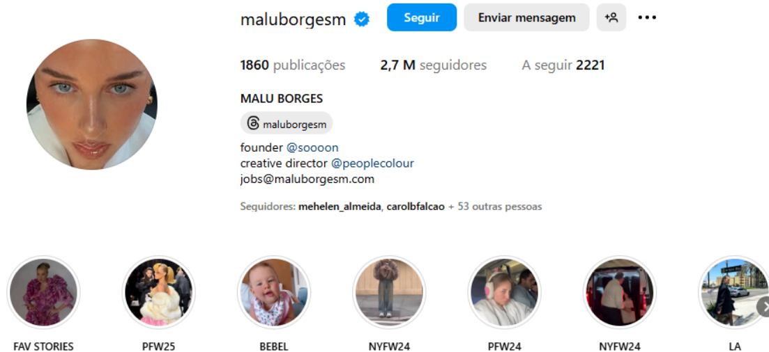
Figura 4 - Instagram da influenciadora Malu Borges, no qual é possível ver destaque para sua filha