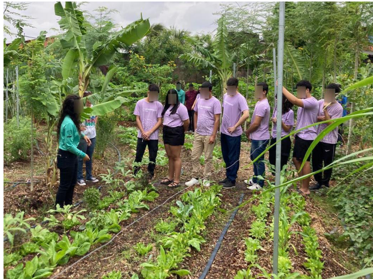
Figura 19 – Visita de jovens que cursam ensino médio, conhecendo nossa mandala

escolas e ONGs, sem custo algum a estas entidades.