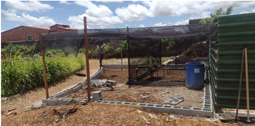
Figura 12 – Construção do viveiro de mudas

À medida que a parte agrônômica acontecia, em que os primeiros ciclos eram plantados (Figura 13) (semente em bandejas ou direto no solo, propágulos...), irrigação via sânteno era disposta na área, a reforma estrutural ocorria com as instalações de áreas de convivência, cozinha, banheiros, etc.