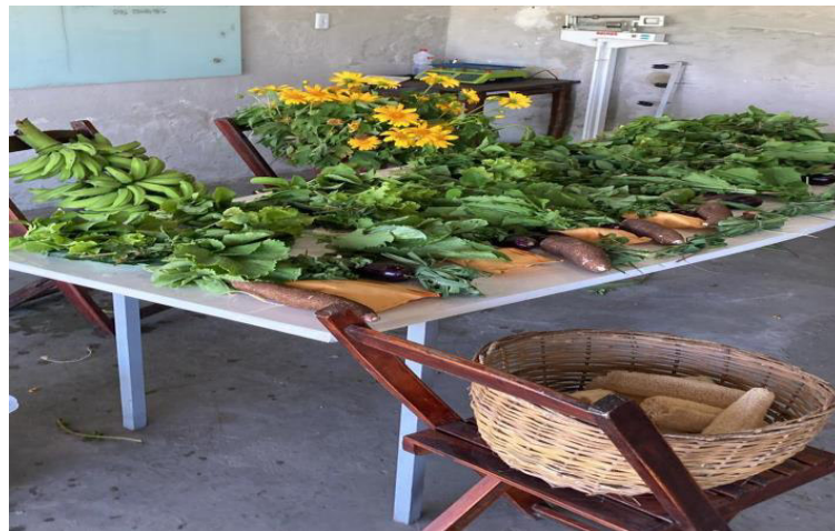
Figura 13 – Organização e disposição da colheita