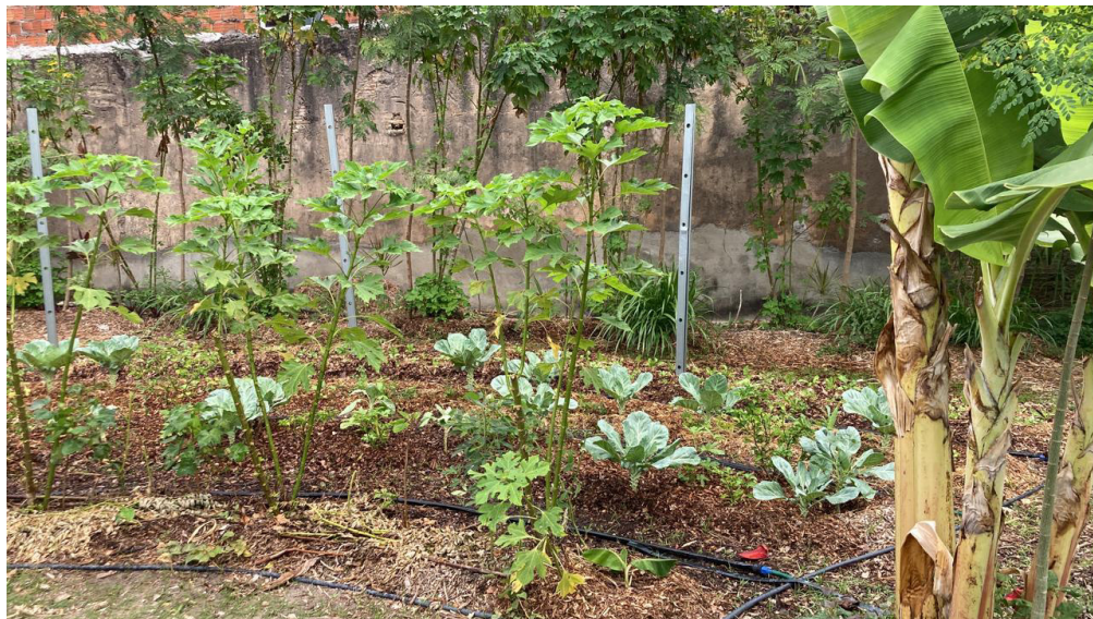
Figura 15 – Parte da mandala com extrema biodiversidade

Após algumas semanas de colheita, organização e ajustes, a metodologia de colheita, processamento mínimo, embalagem (Figura 21) e transporte ficaram bem estabelecidas, utilizamos inclusive uma estratégia inusitada, forramos toda a parte interna da sacola de papel kraft com folhas de bananeira, pois através de testes, demonstrou-se uma