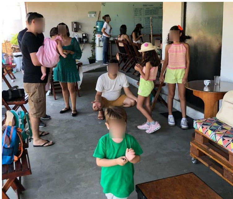
Figura 20 – Funcionários do INEC e familiares, em um sábado, conhecendo o equipamento