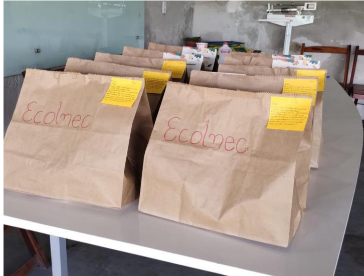
Figura 16 – Cestas embaladas em papel Kraft com descrição manuscrita do conteúdo

eficiente estratégia para se manter umidade e frescor de folhas, tal qual uma câmara úmida.