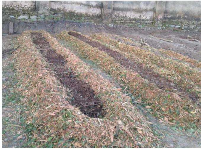
Figura 5 – Preparo de canteiros da área de pomar (maio/2023)