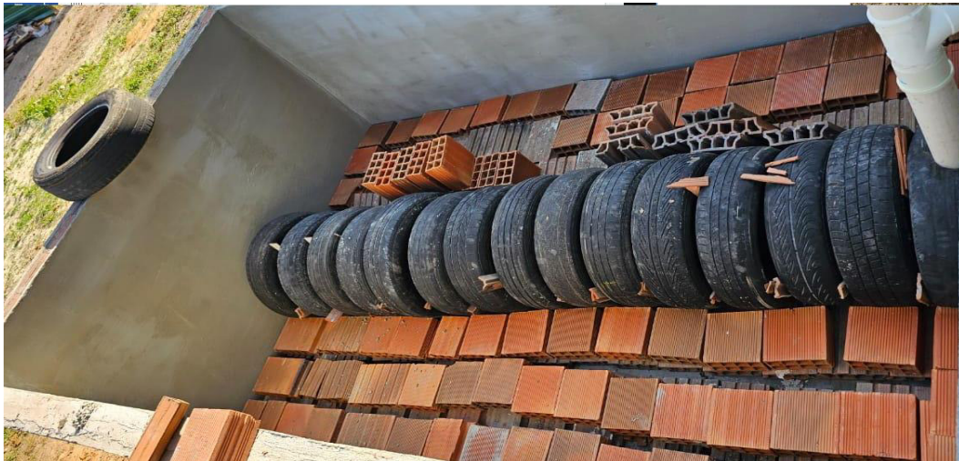
Figura 14 – Construção da Bacia de Evapotranspiração

E todas as águas cinzas ou marrons destas estruturas eram destinadas aos ciclos de bananeiras ou BET respectivamente, que também estavam sendo construídos (Figura 10) neste período.