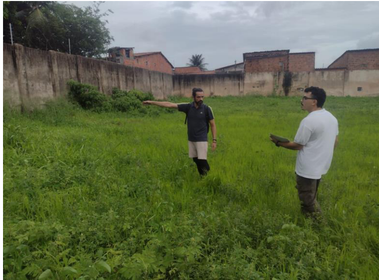
Figura 1 – Primeira visita ao terreno, infestado de plantas espontâneas sobre os entulhos de construção (março/2023)