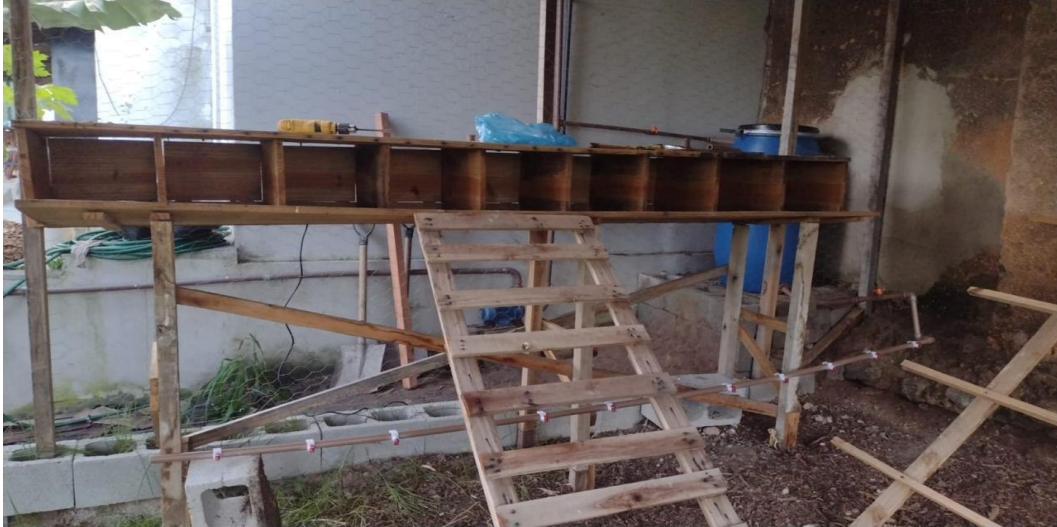
Figura 11 – Construção do galinheiro