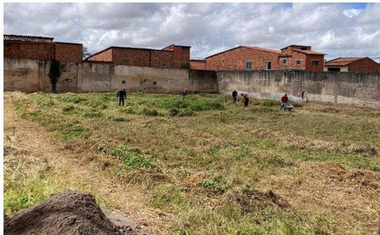
Figura 4 – Roçagem, enleiramento e retirada de entulhos (maio/2023)

O primeiro desafio foi o preparo da área, transformar um terreno baldio que servia de descarte irregular de entulhos por parte da vizinhança e infestado de plantas espontâneas, em especial tiriricas ( Cyperus haspan ), em uma área agroecossistema produtivo. A mão de obra contratada para estes serviços iniciais foi de pessoas que moravam nas proximidades do terreno, principalmente. À medida que o terreno estava sendo preparado por meio de roçagem, capina, descompactação, retirada de entulhos (Figura 3), também estava sendo obtido as mudas, sementes e propágulos para início dos cultivos.