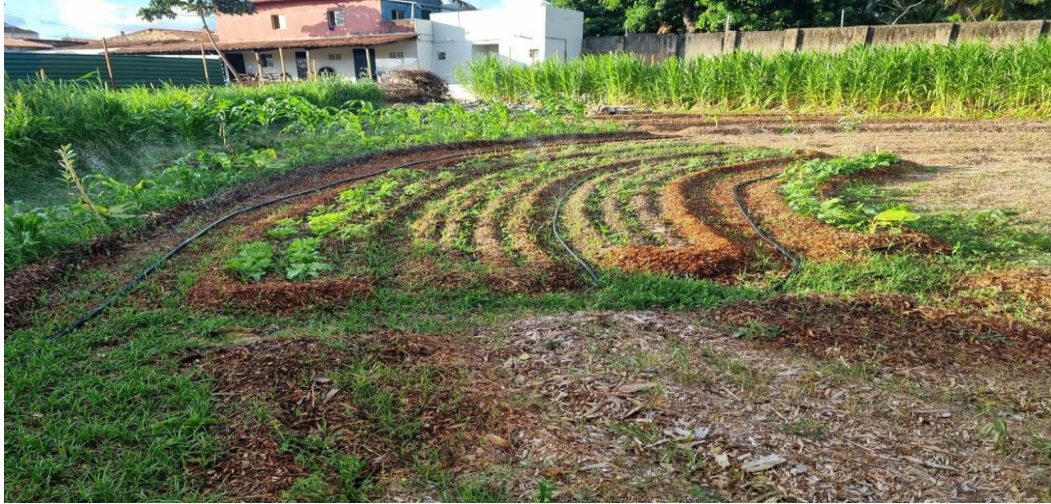
Figura 13 – Primeiros ciclos de plantio (outubro/2023)