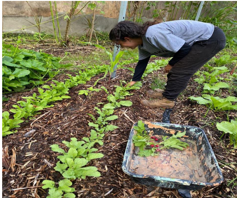
Figura 14 – Bolsista realizando colheita de rabanete