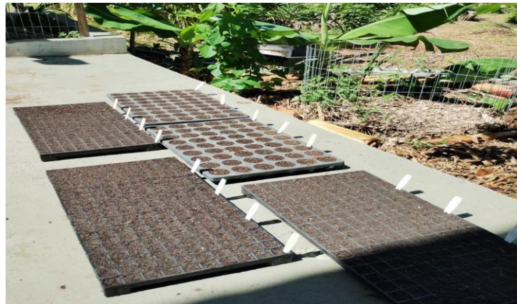
Figura 15 – Preparo de bandejas para produção de hortaliças

A partir de janeiro de 2024, as culturas de ciclo curto, como milho, jerimum, feijão e hortaliças começaram a despontar nas colheitas, e estes alimentos começaram a ser distribuídos aos funcionários do INEC para que pudessem conhecer mais sobre sua célula de atuação ambiental, o ECOINEC.