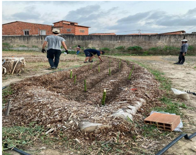
Figura 7 – Montagem de canteiro de barreira de vento para proteção de hortaliças da mandala (junho/2023)