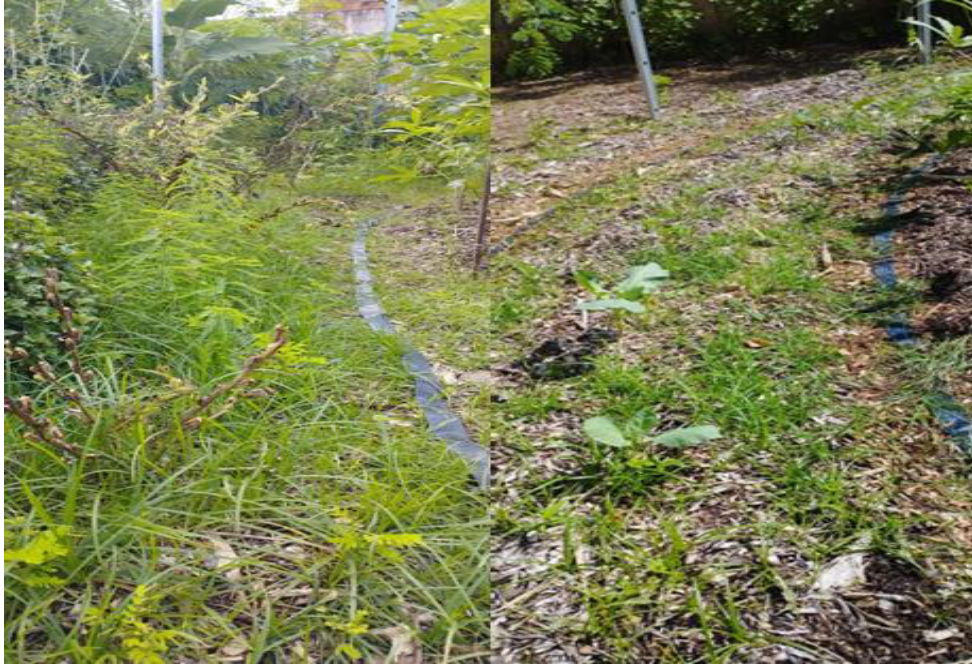
Figura 9 – Imagem do primeiro ciclo de plantio de hortaliças na mandala (julho/2023)