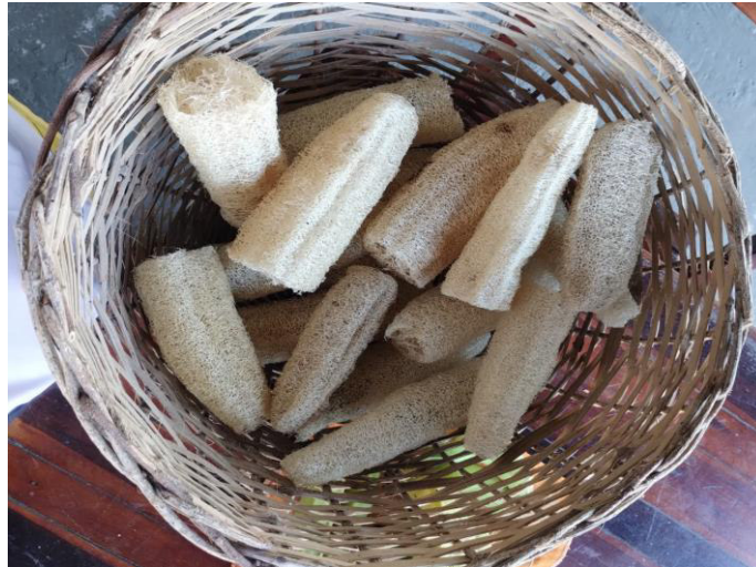
Figura 17 – Bucha vegetal, mais um dos produtos do projeto