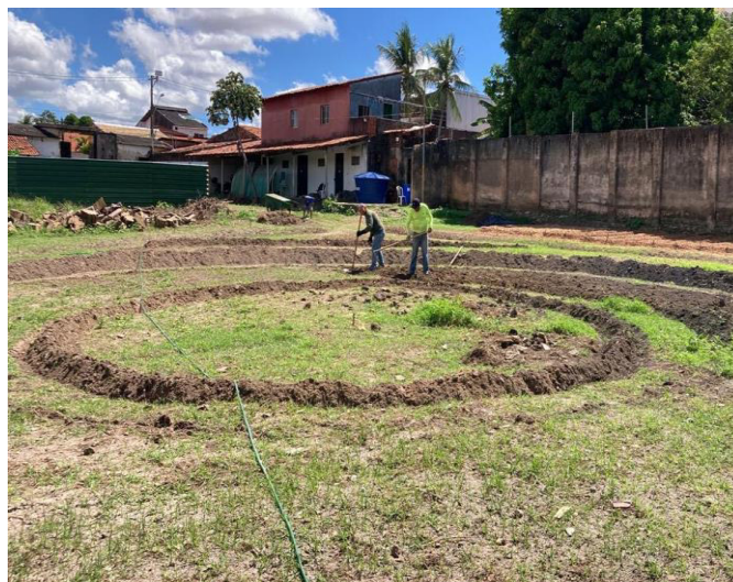
Figura 6 – Montagem da mandala (maio/2023)

O modelo de canteiro côncavo-convexo, também conhecido como "cocuruto", foi a técnica utilizada em todos os canteiros de nosso sistema. Esse tipo de canteiro é projetado para otimizar a captação e a infiltração de água, além de melhorar a conservação do solo, sendo particularmente útil em regiões de irregularidade pluviométrica. Este modelo é inspirado nos ensinamentos de Götsch (2019).