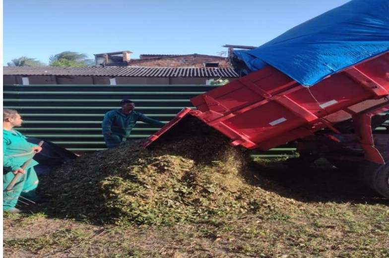
Figura 4 – Recepção de podas trituradas de árvores da cidade