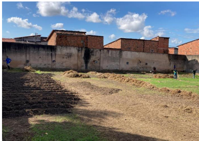
Figura 5 – Roçagem concluída, capina em andamento e preparo de canteiros do pomar (maio/2023)

É importante ressaltar que a ênfase do desenvolvimento do agroecossistema está nos processos, portanto pode ser considerada uma agricultura associada a processos naturais e não de insumos. Sementes e propágulos foram nosso material genético para desenvolver as cultivares de interesse e de serviço (adubação verde e produtoras de biomassa), as podas trituradas da arborização da cidade iriam para aterros sanitários ou beneficiadas para se transformar em bastonetes para se queimar em pizzarias, ou seja, o insumo utilizado foi na verdade um aproveitamento de um material em abundância para agregar carbono, nutrientes e vida no solo. Ou seja, nos balizamos de práticas agrícolas que otimizam os processos ecológicos, como a ciclagem de nutrientes, a biodiversidade e o manejo sustentável de recursos naturais. Sem dependência de fertilizantes químicos ou defensivos químicos.