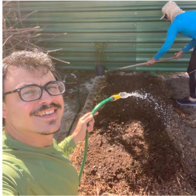
Figura 8 – Preparo da primeira pilha de compostagem