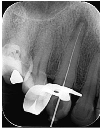
Figura 8 – Confirmação radiográfica da odontometria eletrônica.

Ao atingir-se o limite de penetração da broca o guia foi retirado de posição. Realizou-se então o isolamento absoluto do campo operatório com lençol de borracha (Madeitex, Santa Branca, SP, Brasil) e grampo nº 206 (SSWhite Dufflex, São Cristóvão, RJ, Brasil). Munido de limas K-Flexofile #8, #10 e #15 (Impla, Londrina, PR, Brasil) e empregando hipoclorito de sódio a 2,5% (Rioquímica S/A, São José do Rio Preto/SP, Brasil) como solução irrigadora, efetuou-se o cateterismo do canal; odontometria foi realizada com o localizador eletrônico foraminal Iroot Apex (Bomedent, Changzhou City, Jiangsu, China), determinando-se o comprimento real do dente (CRD); este foi estabelecido em 27,5 mm. Radiografia periapical para confirmar o acesso ao canal radicular (FIGURA 8).