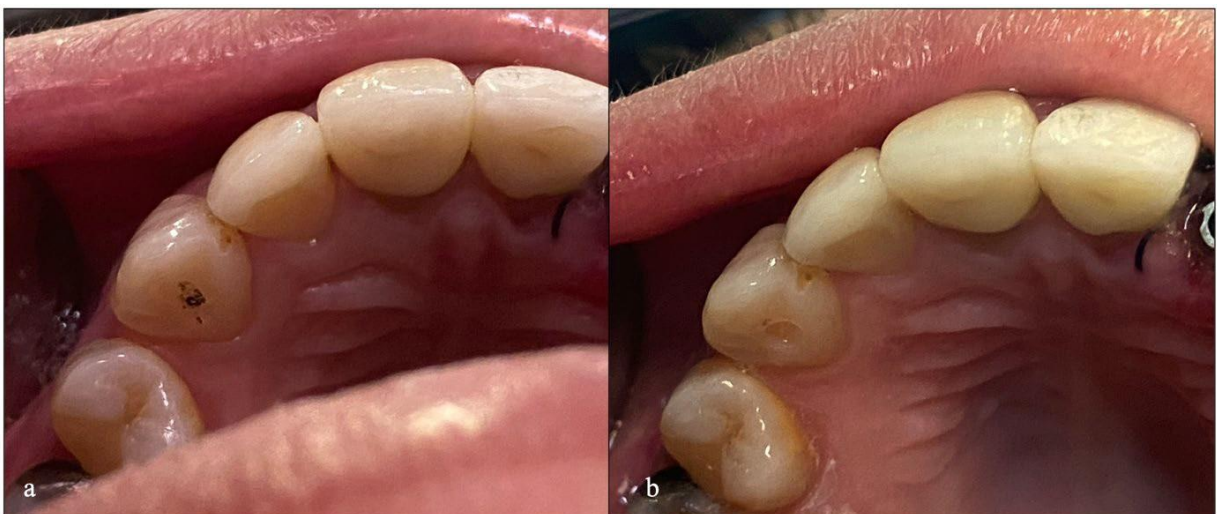
Figura 5 - Área previamente demarcada com grafite (a); imagem após o desgaste inicial (b).

Ainda com o guia em posição, uma marcação com grafite foi realizada no intuito de demarcar a posição do desgaste do esmalte (Figura 5a). Sendo o guia retirado, procedeu-se a realização da anestesia local infiltrativa, no fundo de sulco vestibular com 1,8 mL de mepivacaína a 2% com epinefrina 1:100.000 (DLA Pharma, Catanduva, SP, Brasil). Procedeu-se, então, o desgaste inicial do esmalte coronário com uma ponta diamantada (#1014; KG Sorensen, São Paulo, SP, Brasil), acionada em alta rotação e sob abundante irrigação, limitando-se à área previamente demarcada com grafite (Figura 5b).