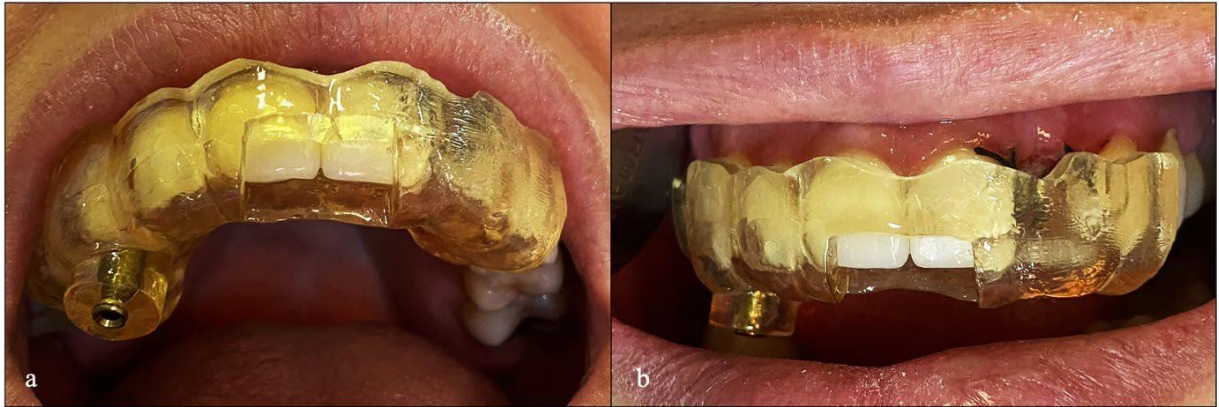
Figura 4 - Guia adaptado a arcada superior (a); detalhe da janela de segurança (b).

Na sessão de atendimento, o guia foi descontaminado com CHX (digluconato de clorexidina) a 2% (Maquira, Maringá/PR, Brasil) e adaptado à arcada superior da paciente (Figura 4a/b). A “janela” existente na guia permitiu que fosse verificada seu correto posicionamento (Figura 4b).