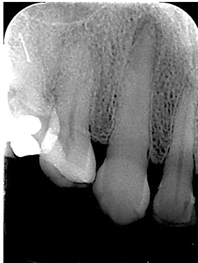
Figura 1 - Radiografia periapical do elemento 23.

Paciente do sexo feminino, normosistêmico, 36 anos de idade, compareceu à clínicaodontológica da Universidade Federal do Ceará – Campus Sobral , para avaliação odontológica. Durante o exame clínico observaram-se facetas em resina nos elementos 11, 12, 21 e 22; nestes, áreas de inflamação gengival eram perceptíveis. Diante do achado, exames radiográficos periapicais dos elementos citados foram realizados, oportunidade na qual foi percebido a presença de uma lesão periapical e calcificação pulpar no dente 13 (Figura 1).