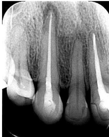
Figura 9– Radiografia periapical após a conclusão do tratamento endodôntico.

Realizou-se prova do cone de guta-percha, empregando-se cone FM extralongo (Tanari, Boa Vista, RR, Brasil) calibrado no #40 e adaptado no CT. Em seguida, irrigou-se com EDTA a 17% (Biodinâmica Química e Farmacêutica, Ibioporã, PR, Brasil), agitando-se a solução com Easy Clean (Easy, Belo Horizonte, MG); seguiu-se irrigação com soro fisiológico (Farmace, Barbalha, CE, Brasil). O canal foi então seco com cones de papel absorvente estéreis calibrados #40 (Dentsply-Maillefer, São Paulo, SP, Brasil). Empregou-se o cimento Hydro Sealer (Biodinâmica Química e Farmacêutica), manipulado de acordo com as instruções do fabricante. O cimento foi levado ao canal por meio do próprio cone, com movimentos lentos em sentido apical, com moderada pressão, até atingir o comprimento desejado. Em seguida realizou-se a termoplastificação do cone de guta-percha empregando condensador de McSpadden #50 (Dentsply-Maillefer), seguida de condensação vertical com condensadores de Schilder (Odous de Deus, Belo Horizonte, MG, Brasil). Procedeu-se radiografia periapical comprobatória que foi sucedida limpeza da cavidade de acesso e sua restauração final com resina composta Opallis (FGM, Joinville/SC, Brasil); por fim foi realizada a radiografia final (Figura 9).