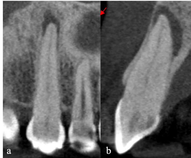
Figura 2 - Tomografia computadorizada de feixe cônico, mostrando detalhes das imagens do terço cervical, terço médio e terço apical; visão frontal (a) e sagital (b).

Tendo em vista a dificuldade de alcançar o canal radicular por métodos convencionais, foi proposta a confecção de um guia, por meio de um planejamento virtual, para a realização do acesso ao canal radicular. Após a concordância da paciente, ela foi encaminhada para realizar um escaneamento intraoral, necessário para confecção do Endoguide. De posse do escaneamento e da TCFC foi realizado o planejamento da guia cirúrgica personalizada (EXON, Fortaleza, CE, Brasil) fabricado em uma impressora 3D (Figura 3a/b).