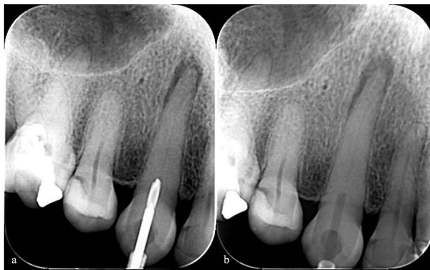
Figura 7 – Radiografias transoperatórias com a broca (a); Radiografias transoperatórias (b).

Radiografias transoperatórias (FIGURA 7 a/b) foram realizadas no intuito de confirmar a correção do trajeto realizado pela broca.