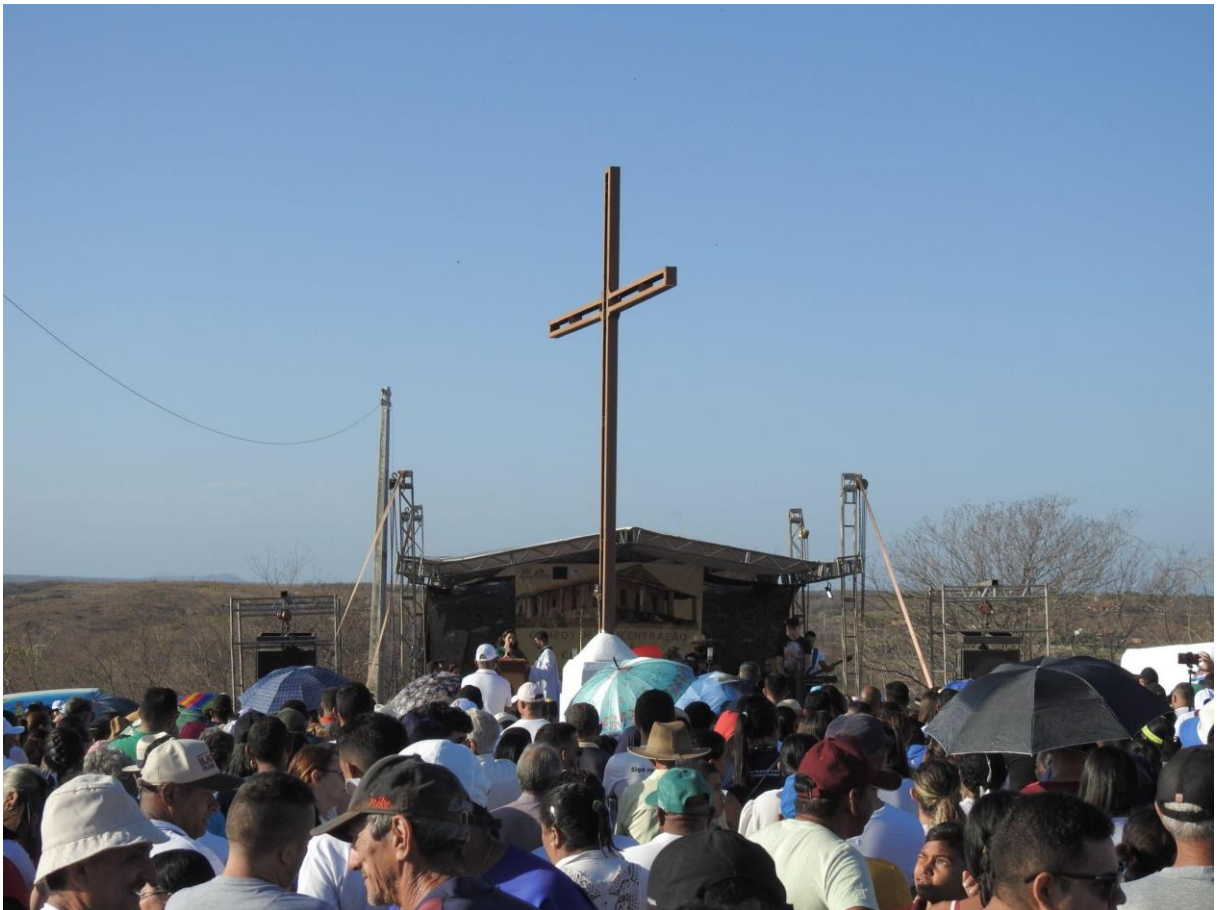
Figura 10 – Fiéis participam de missa ao lado do Cemitério da Barragem

Ao lado do Cemitério da Barragem é realizada uma missa junto com autoridades católicas (padres e bispos) e políticas (como o prefeito da cidade). Mesmo que seja um rito voluntário e a visita ao Cemitério da Barragem atraia maior atenção e interesse, especialmente naqueles que foram “pagar” promessas ou realizar orações e entrega de ex-votos, a presença da Igreja Católica oficial demarca um espaço que a interessa e que, portanto, não está disposta a abrir mão dele.