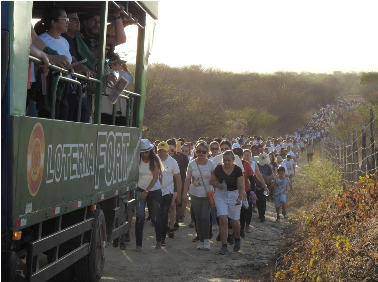
Figura 7 – Caminhada das Almas em Senador Pompeu em 12 de novembro de 2023