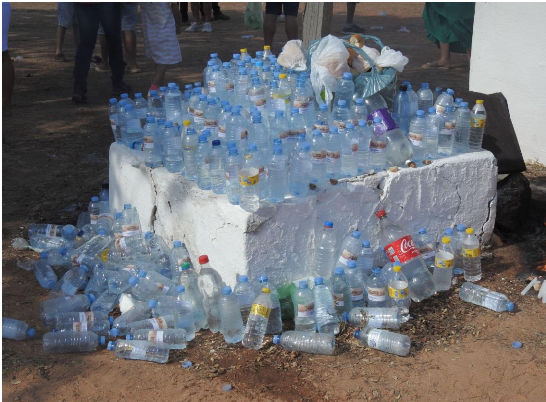
Figura 16 - Inúmeras garrafas de água e sacos de pães depositados nos túmulos com o objetivo de “matar” a sede e a fome dos flagelados

as tentativas de definir ou avaliar o martírio são impotentes para impedir a aclamação dos mártires” (Middleton, 2014, p. 130, tradução nossa) 51 . Dito isso, o que é o martírio? Para Middleton (2014), o martírio não pode ser definido. É uma narrativa, ou um conjunto delas, úteis para criar ou manter a identidade de um grupo, que geralmente destaca um representante ideal que escolheu ou foi feito para morrer por seus valores.