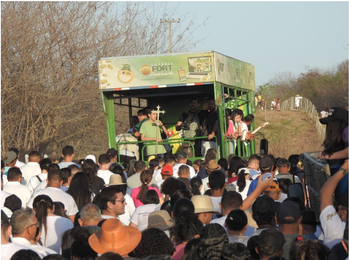
Figura 9 – Peregrinos em direção ao Cemitério da Barragem

Assim como outros fenômenos religiosos, a devoção às Santas Almas da Barragem assume uma relação de maior diálogo com o catolicismo oficial, especialmente por ter sido a Igreja Católica a precursora da Caminhada da Seca. Não por acaso, é um automóvel com aparelho de som e cânticos católicos que guia os peregrinos durante a caminhada até o Cemitério da Barragem e relembra o sofrimento vivido pelos flagelados. Essa condução é feita por integrantes da instituição.