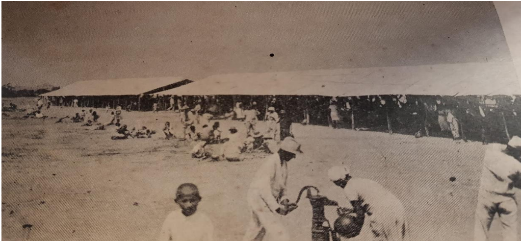
Figura 4 – Campo do Urubu, no bairro do Pirambu, em Fortaleza