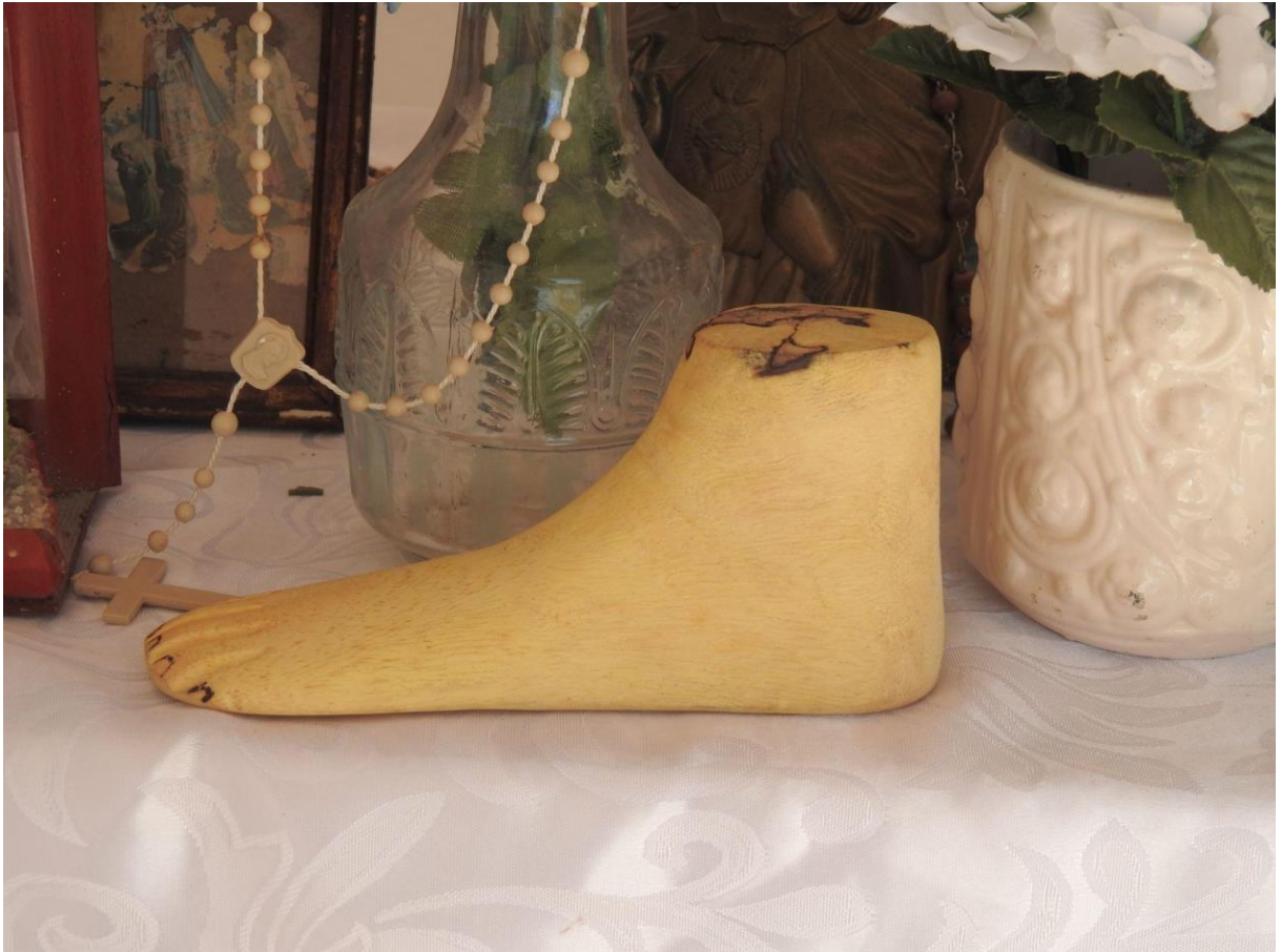
Figura 17 – Réplica de um pé depositado na capela construída no Cemitério da Barragem

construída na década de 1980, que abriga esses bens simbólicos. Há no espaço fotografias, imagens de santos, terços, ex-votos e diversas garrafas de água. Na foto abaixo, um pé simboliza a realização de um pedido ou uma graça alcançada, atitude que fortalece a relação entre os devotos e as Santas Almas.