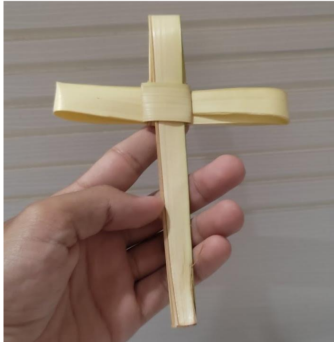
Figura 6 – Cruz produzida a partir de palha de carnaúba