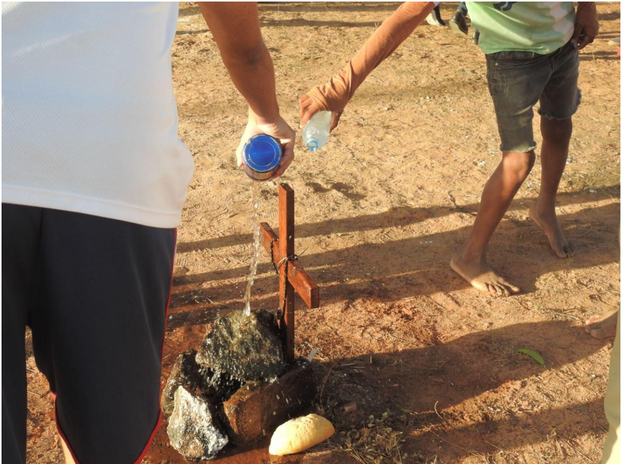
Figura 18 - Devotos derramam água sobre túmulo no Cemitério da Barragem

distribuição ao longo do percurso. O ato simboliza a devoção com as Santas Almas, mortas diante de um cenário hostil, com políticas públicas praticamente inexistentes e recursos escassos durante o período de seca severa. Os túmulos se tornam espaços de hierofania (Eliade, 1992), ou seja, de manifestação do sagrado, e se revelam a partir de uma representação do simbólico que está além da materialidade visível.