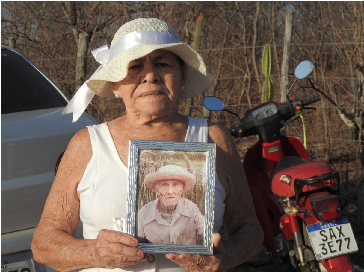
Figura 15 – Peregrina segura um porta-retrato com a imagem de seu pai, já falecido, um dos sobreviventes do Campo de Concentração do Patu