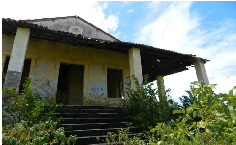
Figura 5 – Antiga casa do engenheiro-mor, Senador Pompeu, Ceará

O Campo do Patu, como foi batizado, aproveitou as construções da vila operária criada para as obras de construção da chamada Barragem do Patu, que haviam sido interrompidas anos antes pela Inspeção de Obras Contra as Secas (IFOCS) 31 . O Campo chegou a confinar cerca de 20 mil pessoas em maio de 1932 (Neves, 1995) e era formado por um complexo constituído originalmente por nove residências (casa dos apontadores, dos engenheiros e do engenheiro-mor), um hospital, uma estação ferroviária, além de um armazém, uma oficina, uma casa de geração de energia, dois locais para armazenamento de pólvora e uma vila operária composta por aproximadamente duzentas casas de taipa 32 . Segundo Coelho (2021), os retirantes foram alocados nas casas construídas para os operários da obra. Apesar disso, o crescimento populacional do Campo obrigou as famílias excedentes a se alojarem em barracos improvisados. Já a casa do engenheiro-mor se tornou um ponto de administração do Campo do Patu e responsável pela distribuição dos alimentos.