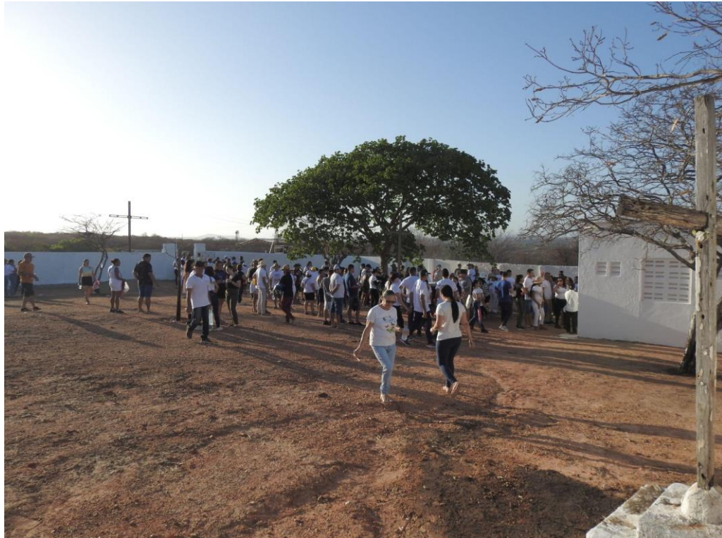
Figura 12 – Cemitério da Barragem durante a peregrinação dos devotos

o Cemitério da Barragem, há a entrega de águas, pães e velas às Almas da Barragem, elementos que serão melhor discutidos no próximo capítulo.