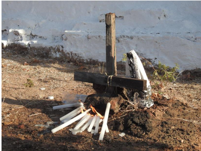
Figura 8 – Túmulo no Cemitério da Barragem em Senador Pompeu-CE