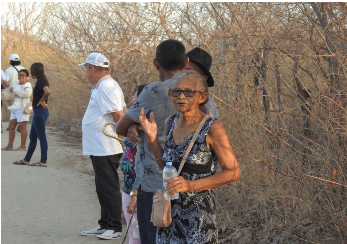
Figura 14 – Peregrina faz uma pausa durante a Caminhada da Seca e ora às Santas Almas da Barragem