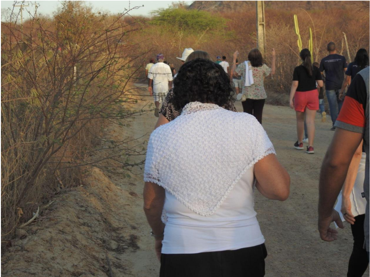
Figura 13 – Trajes brancos estão presentes na maioria dos peregrinos

utilizem roupas comuns do cotidiano, muitas delas destacam o branco como força de mobilização religiosa.