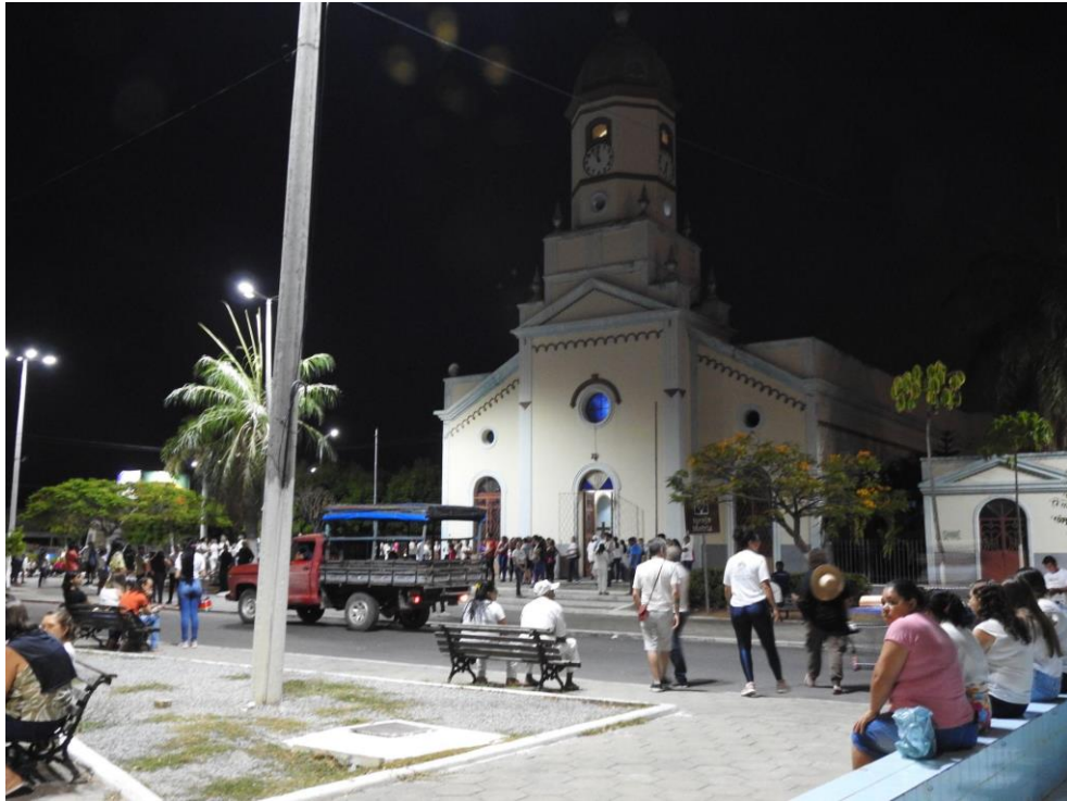
Figura 11 – Devotos se concentram na Igreja Matriz para participar da Caminhada da Seca