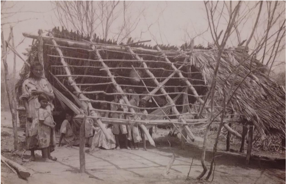
Figura 1 – Alojamento de retirantes

Concentração, que recebeu o apelido de “Curral do Governo” 20 , eram péssimas. “Os números da morte também se concentraram: em geral, era mais fácil morrer no campo do que fora dele” (NEVES, 1995, p. 100).